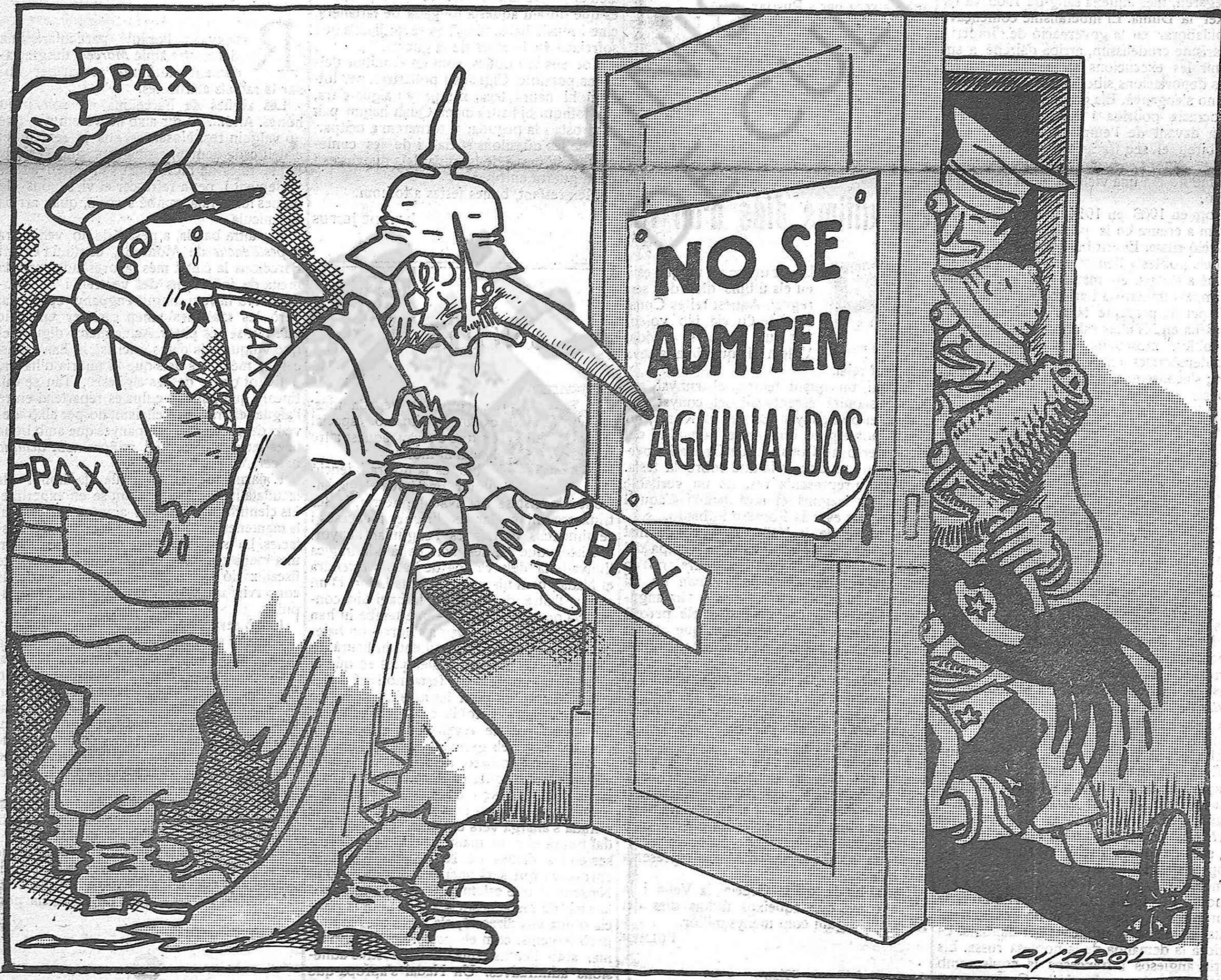
El pelut. — Guaiteu-lo, pobre ignocent! ... l'hem deixat amb un pam de nas!...