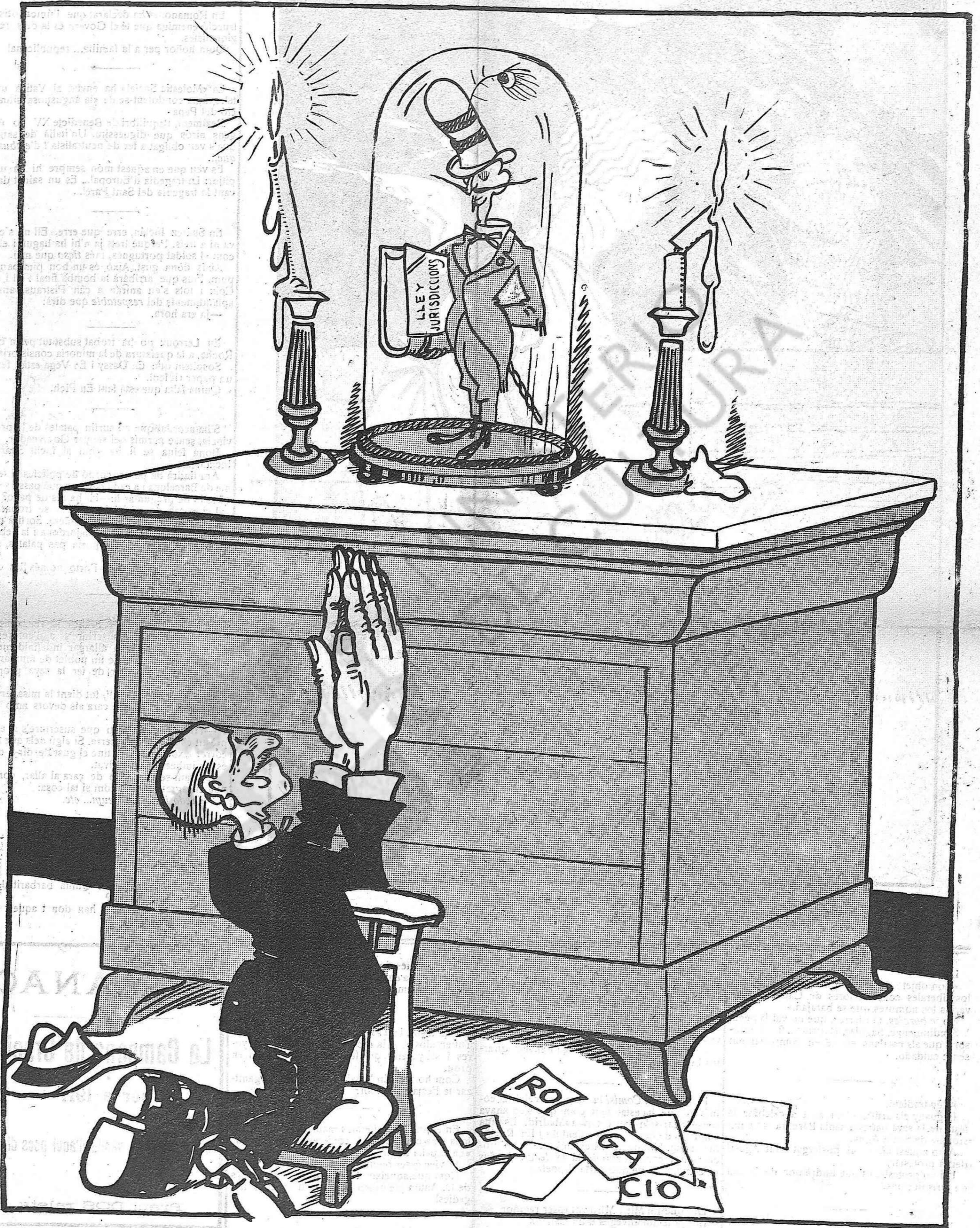
“Primer és la devoció que la obligació”