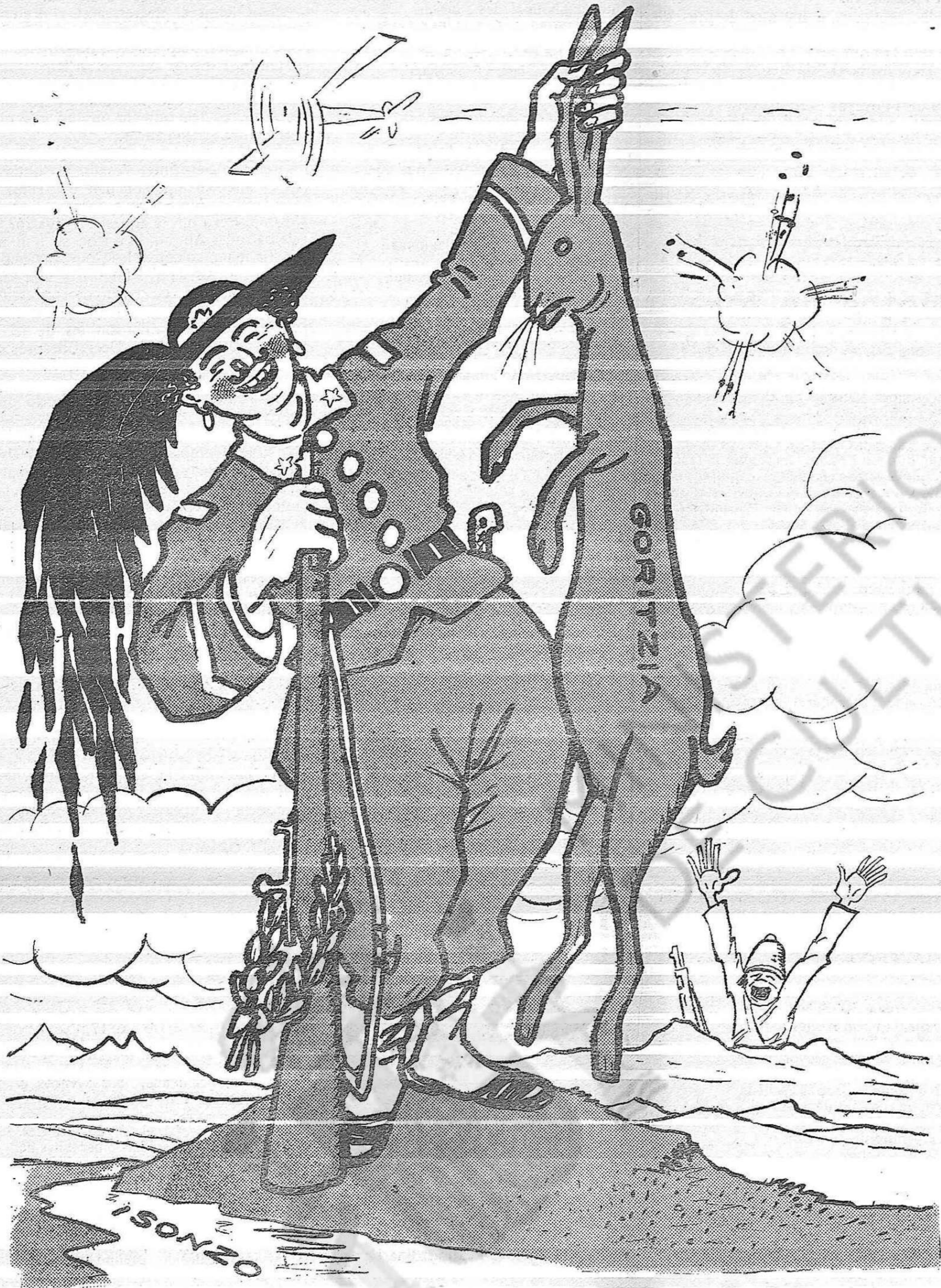
-Què me'n dieu d'aquesta llebra?

«Tantas idas y venidas tantas vueltas y revueltas diu el cavall quiero, amiga que me diga ¿son de alguna utilidad?».