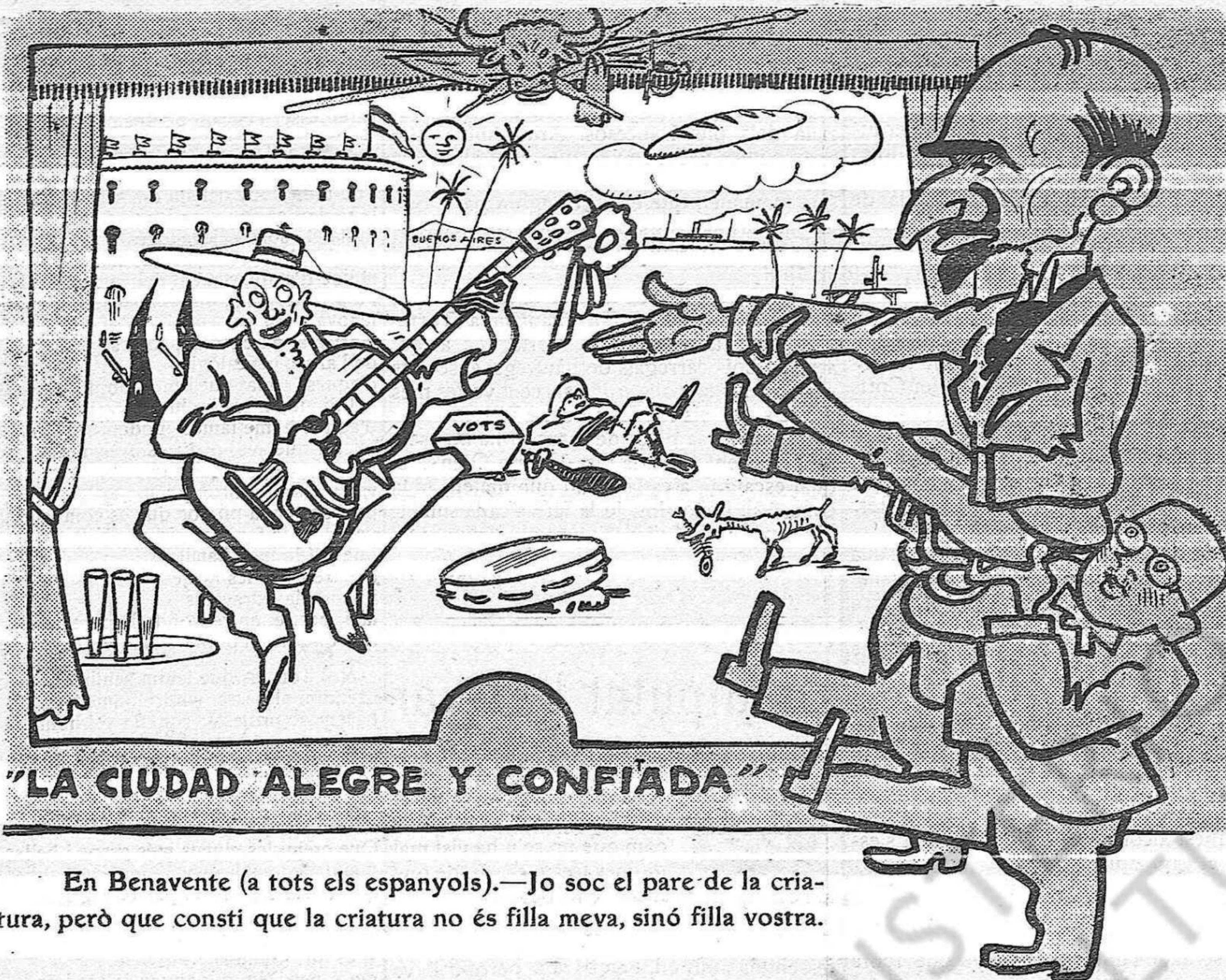
"LA CIUDAD ALEGRE Y CONFÍADA"

En Benavente (a tots els espanyols).—Jo soc el pare de la criatura, però que consti que la criatura no és filla meva, sinó filla vostra.