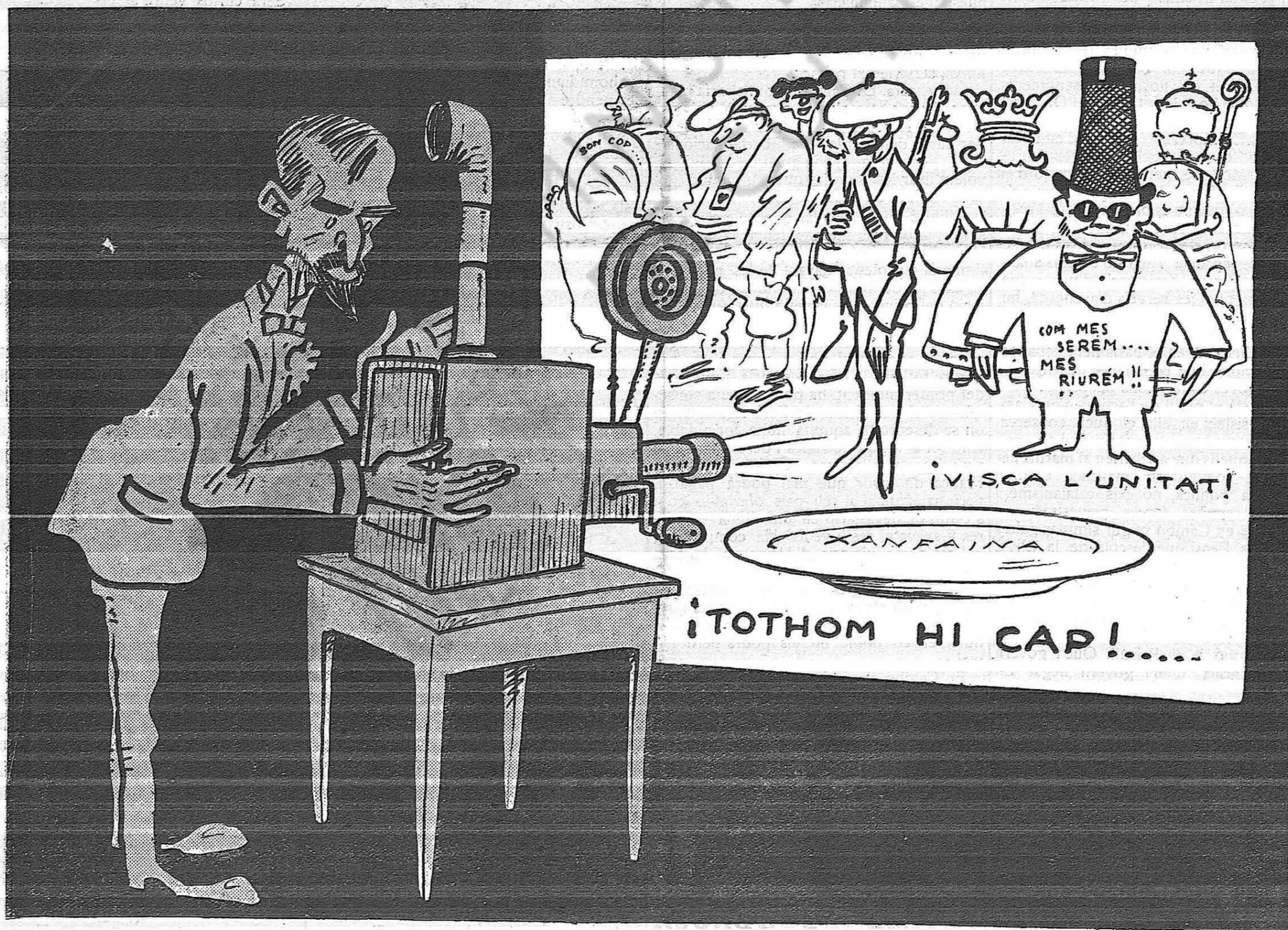
— Veuen tot això?... Doncs tot això és la Lliga.