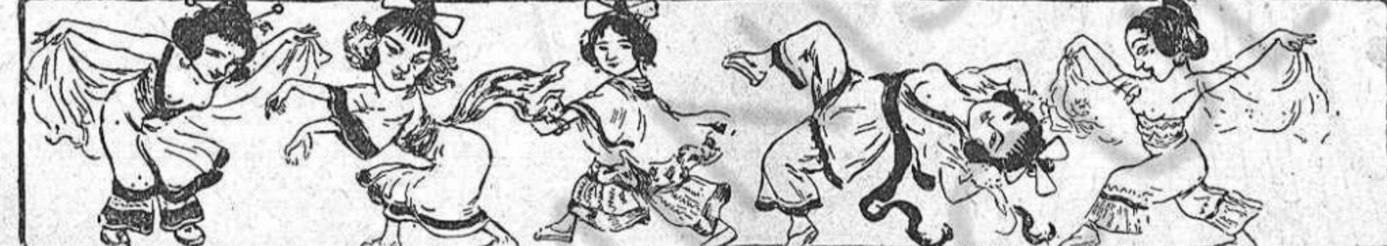
Primer acte.—Gran ball de torpedos voladors (dirigit per l'almirant Togo.)