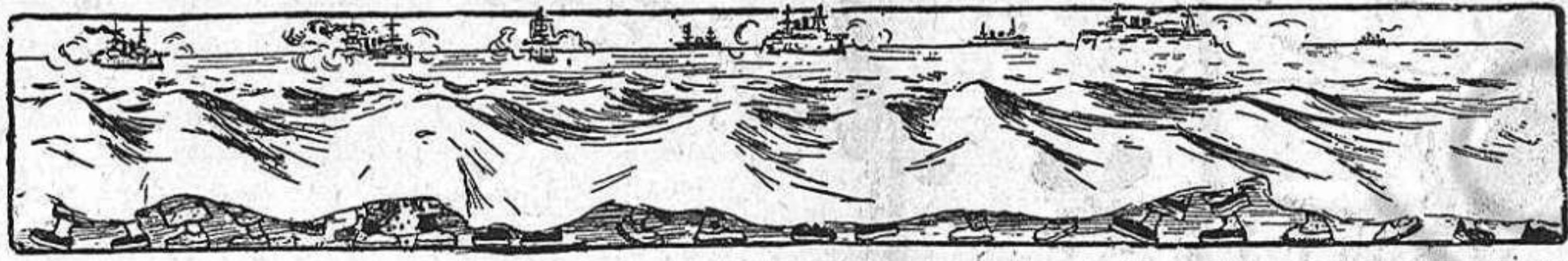
Quadro primer del prólech: L'atach de Port-Arthur. (Observis ab quin cuydado la Direcció ha arreglat el moviment de las onadas.)