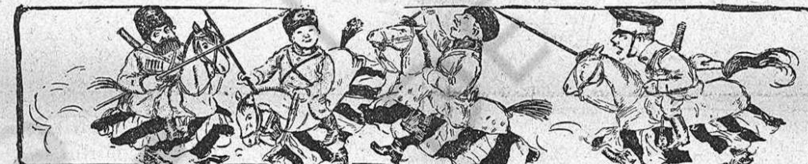
Acte quint.—Gran pantomima equestre, pels Cossachs de Siberia (direcció del Sr. Kuropatkine) (De Le Rtre.)