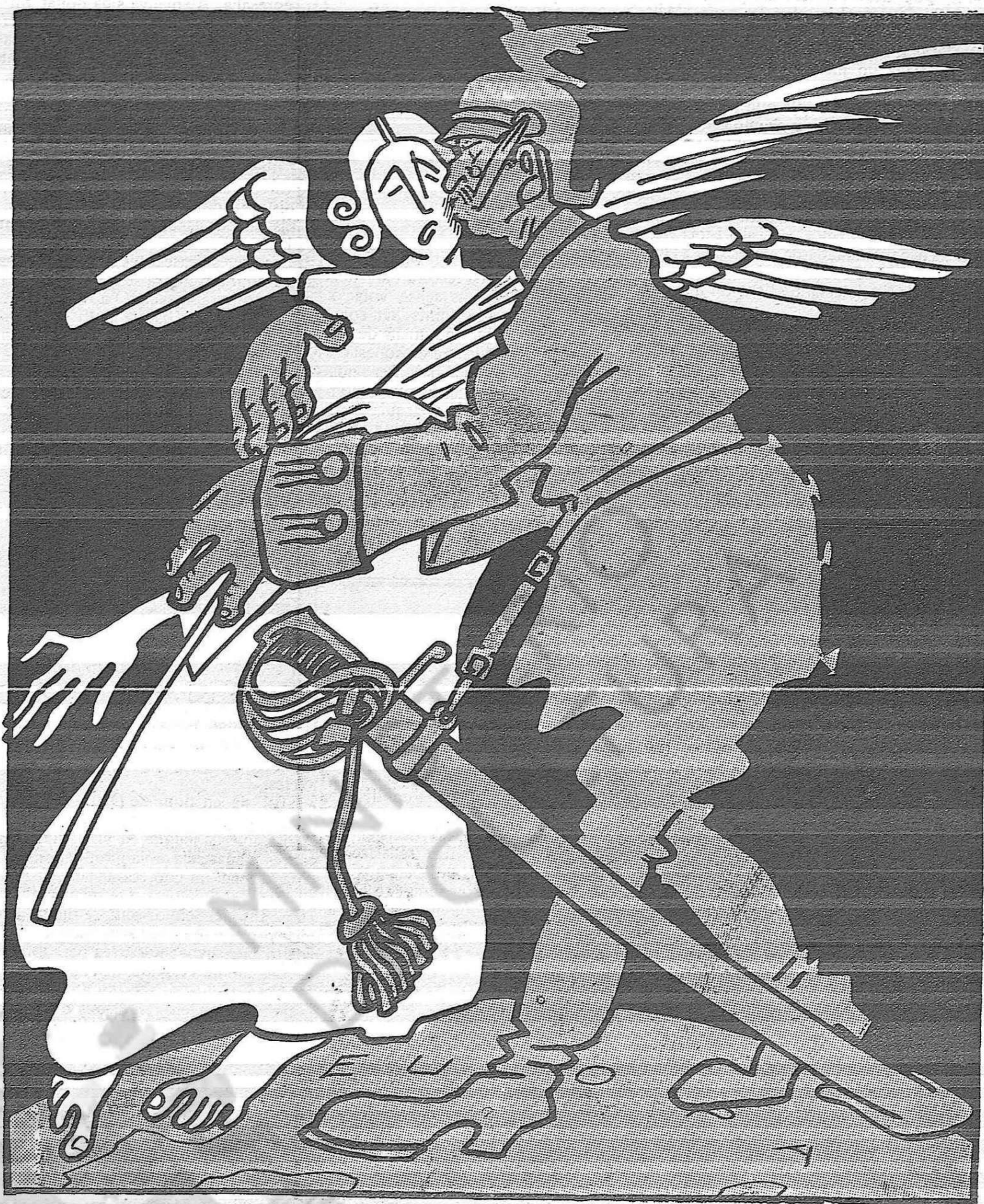
El petó de Judes.

Nosaltres, doncs, al revés dels heretges letrouixistes, que s'han mostrat clericals acatant les ordres del Sant Pare i barrejant, enguany hem fet dejuni.