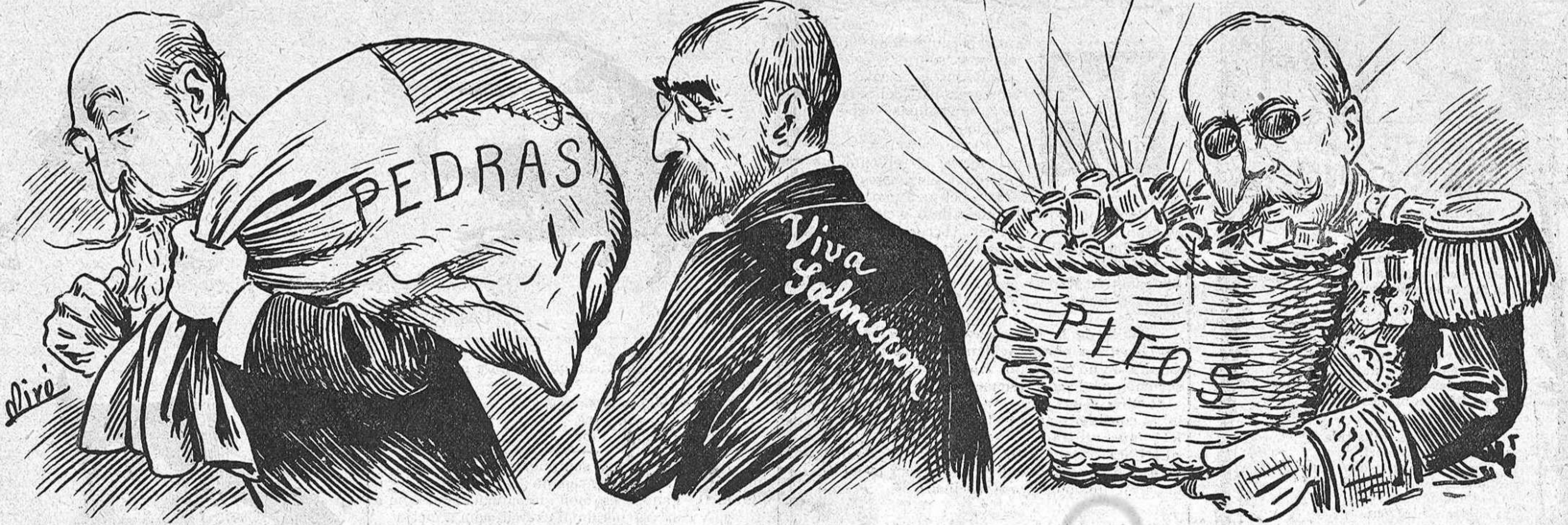
¡Aixó es tot lo que han cullit passejant per las provincias!

De un article de El País : «Serán aquestas Corts las que farán caure moltes caretes, convertirán algunas faixas en dogals y las dauradas espuelas en grilletos. »La minoria republicana vetllará per l'honor de la patria, del exercit y de la marina, y s'formará l'sumari qu' en 1898 se va sobreseir per falta de probas.» Aixó es lo que ha de succehir. Y aquesta es de moment la missió principal dels diputats republicans. Contin en la seva obra ab l'apoyo unánim de un país, que no pot resignarse á sucumbir en l'oprobri y la vergonya.