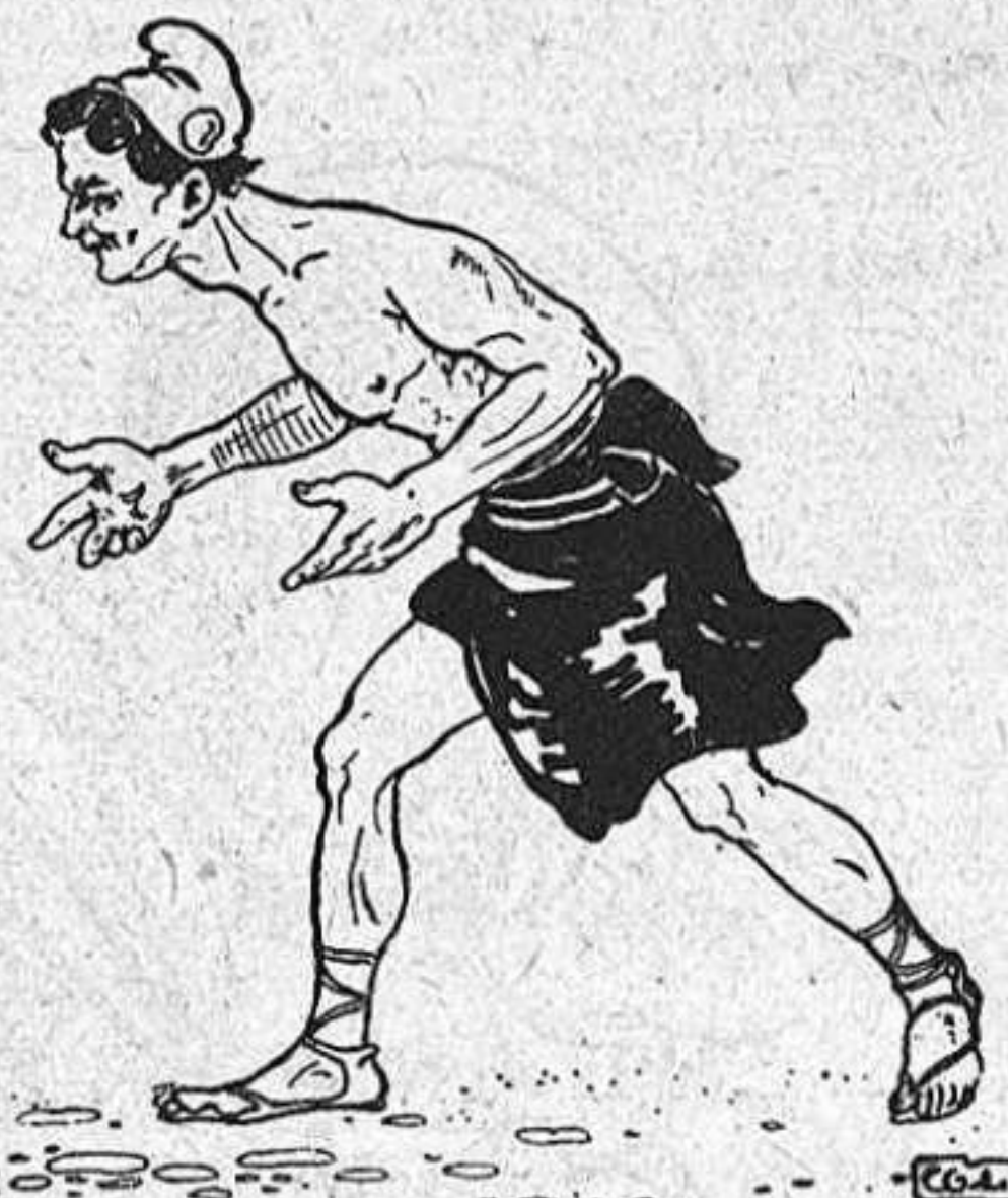
Las llyuatas de nostres días.

Una noya al seu xicot, que li ha fet no sé quinas picardias: