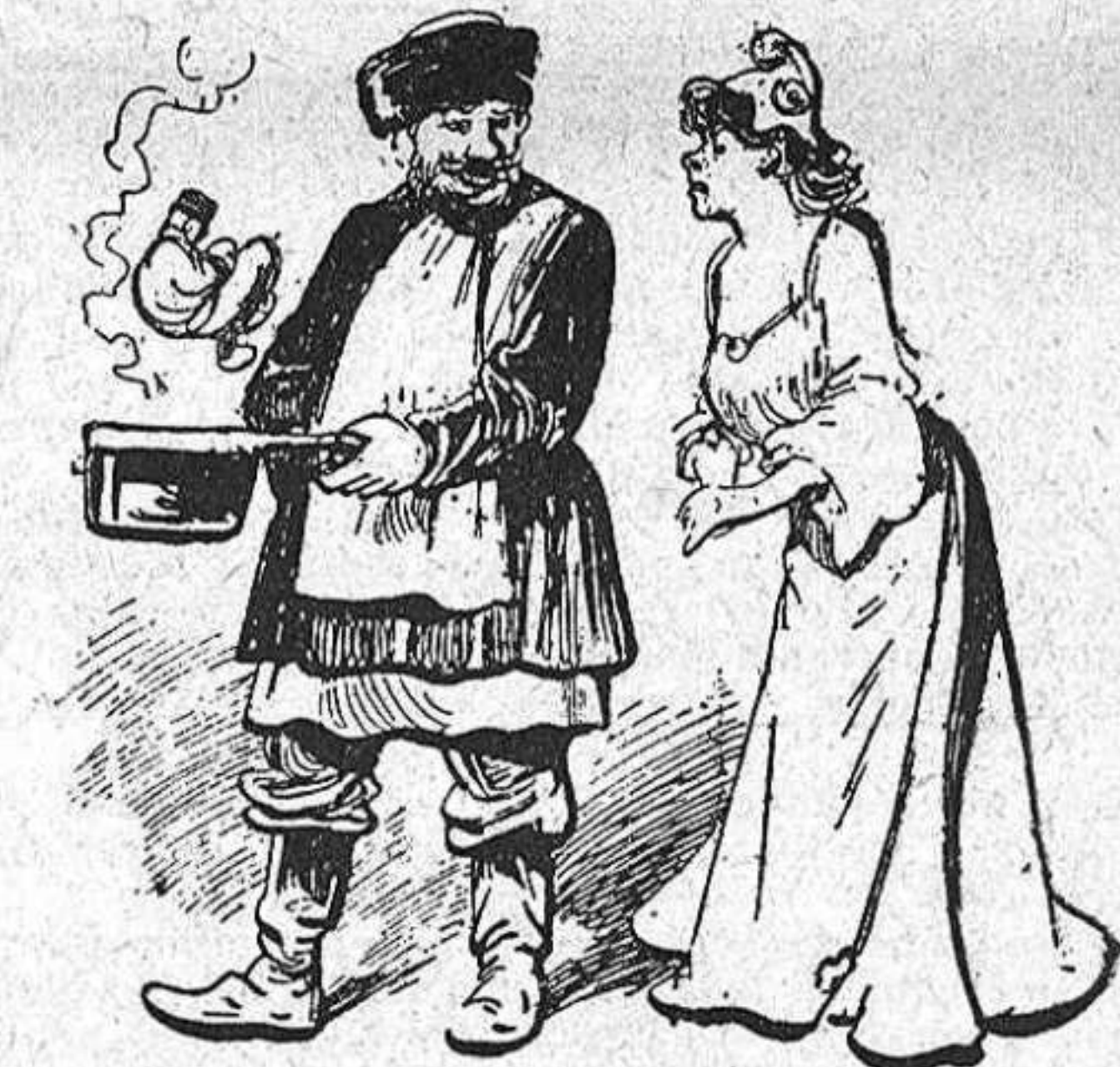
—¿Tan mateix pensas menjártel el Japó? —No encare!... Fins que sigui ben cuyt.