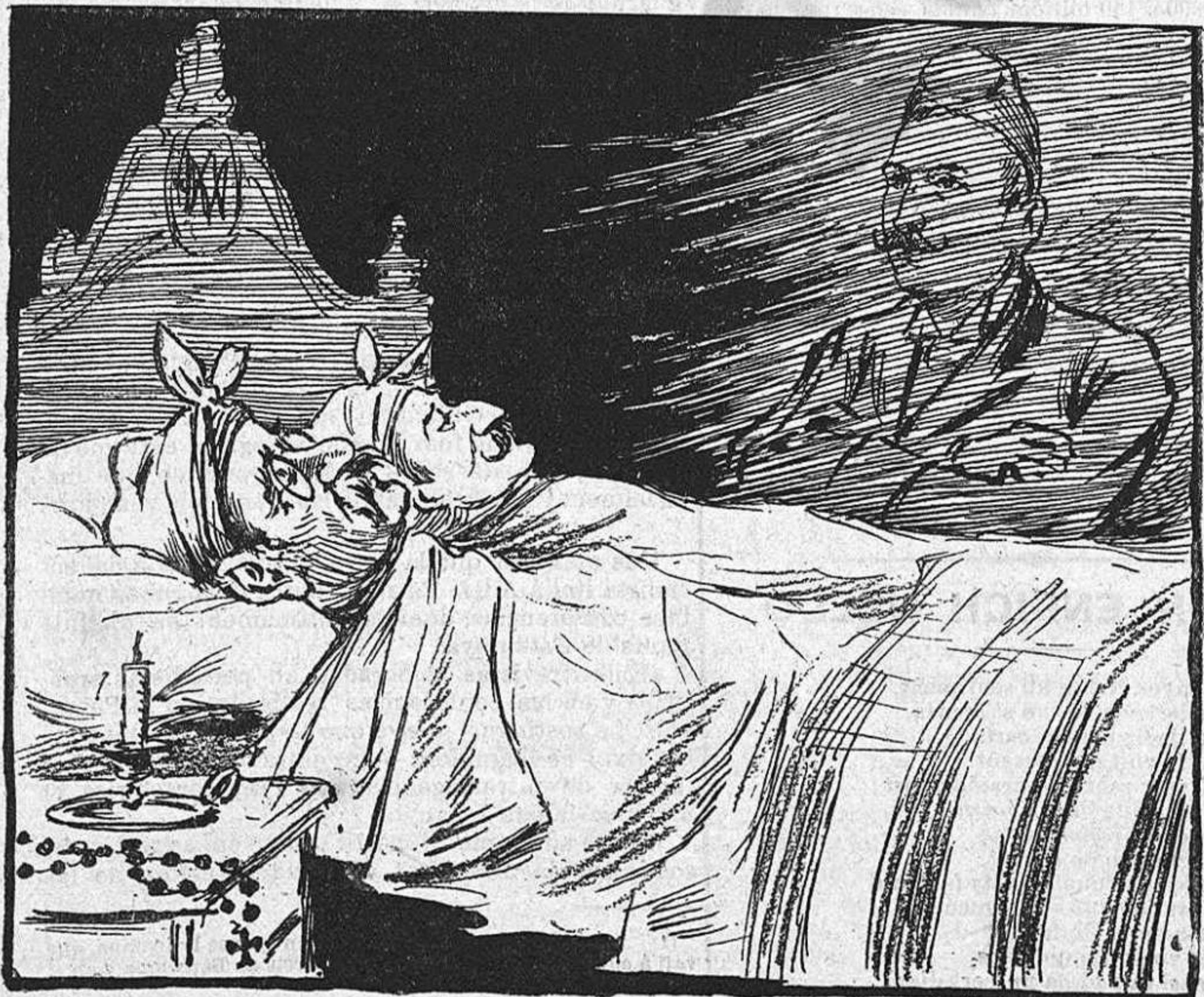
L' únich fantasma que somfan.