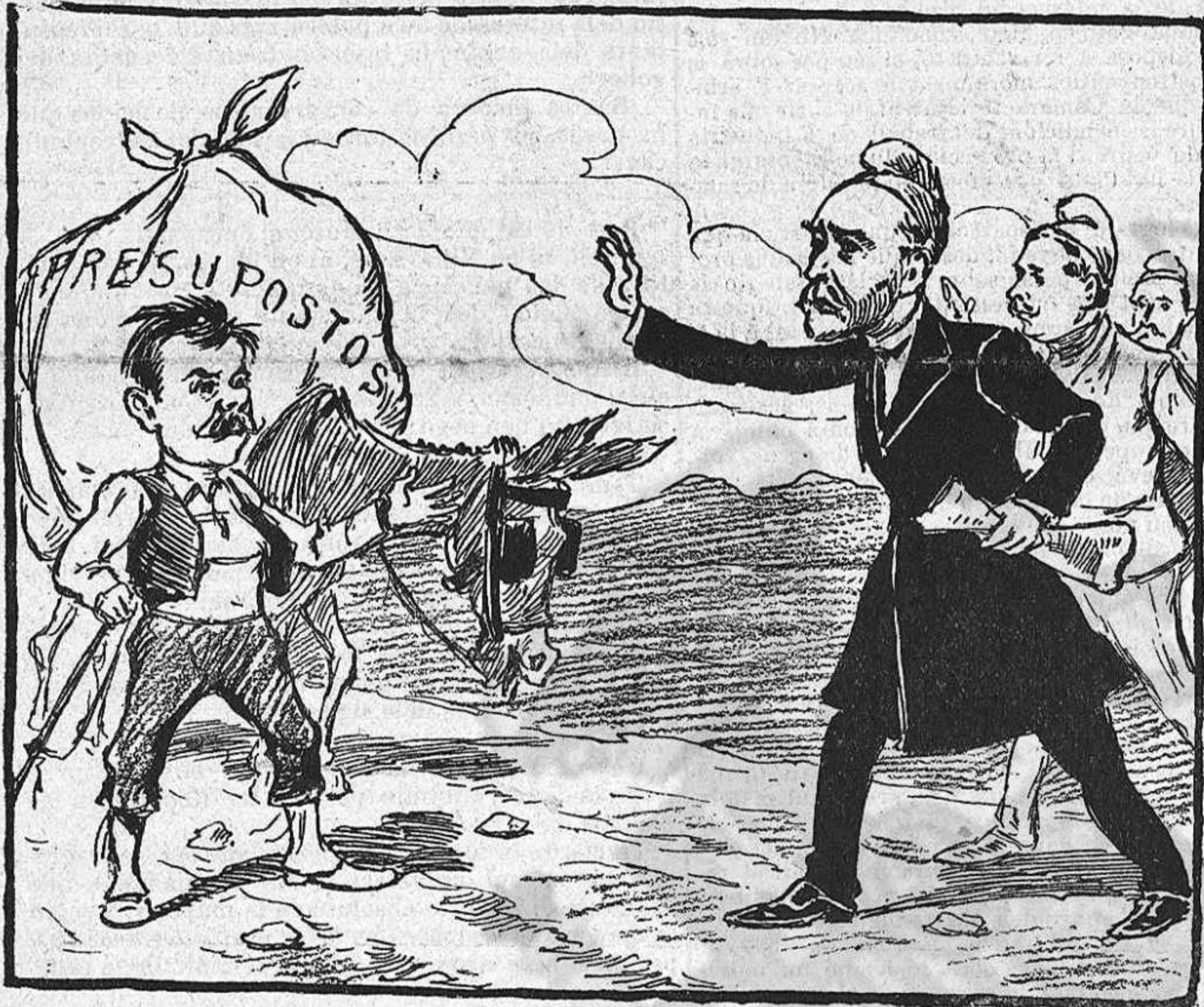
—Poch á poch, mestre: sense 'l nostre permís, aixó no passa.