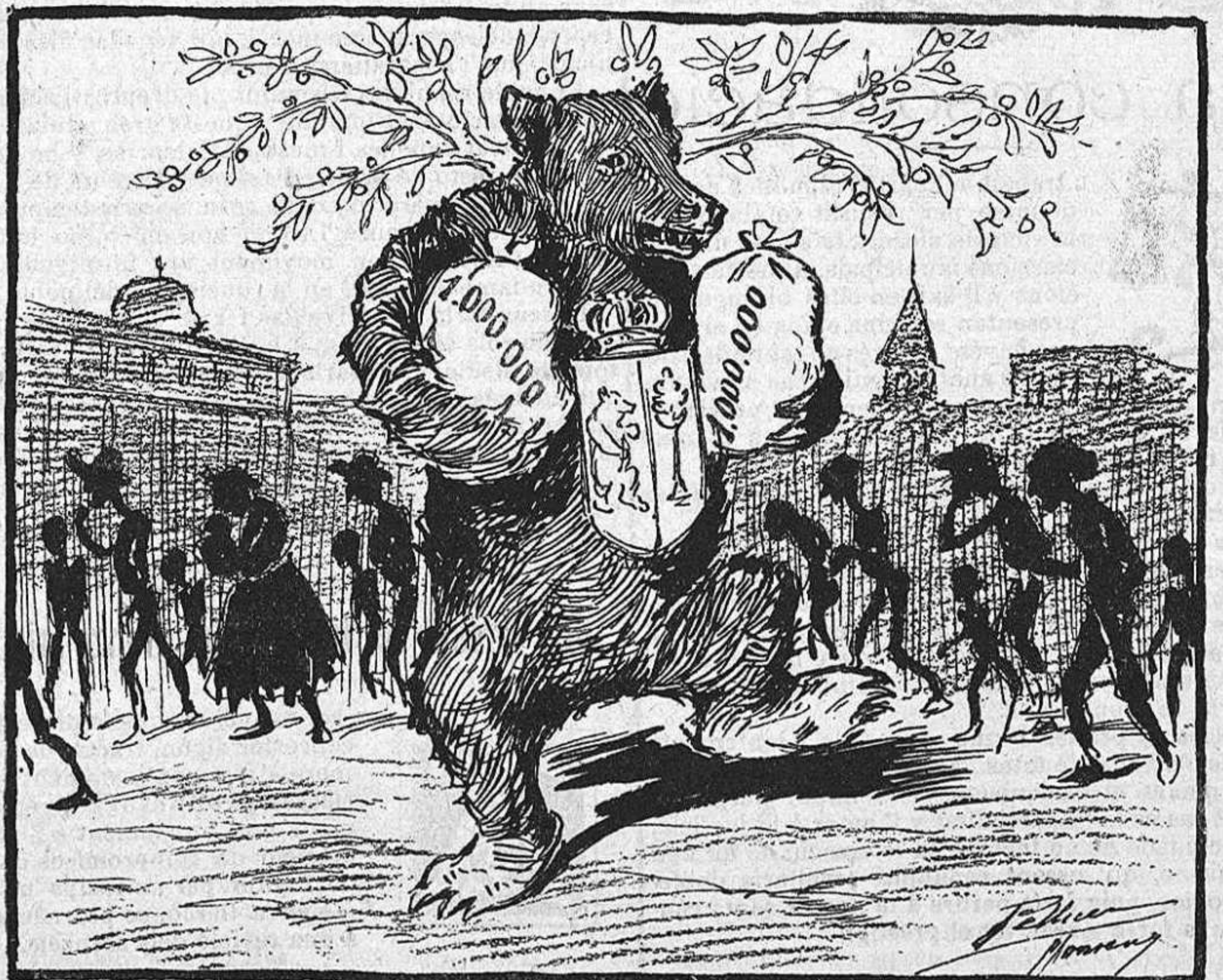
—Per dos miserables milions de propina, ¡vés quín escándol arma 'l país!... Encare no 'n tinch per vuyt días de juerga.