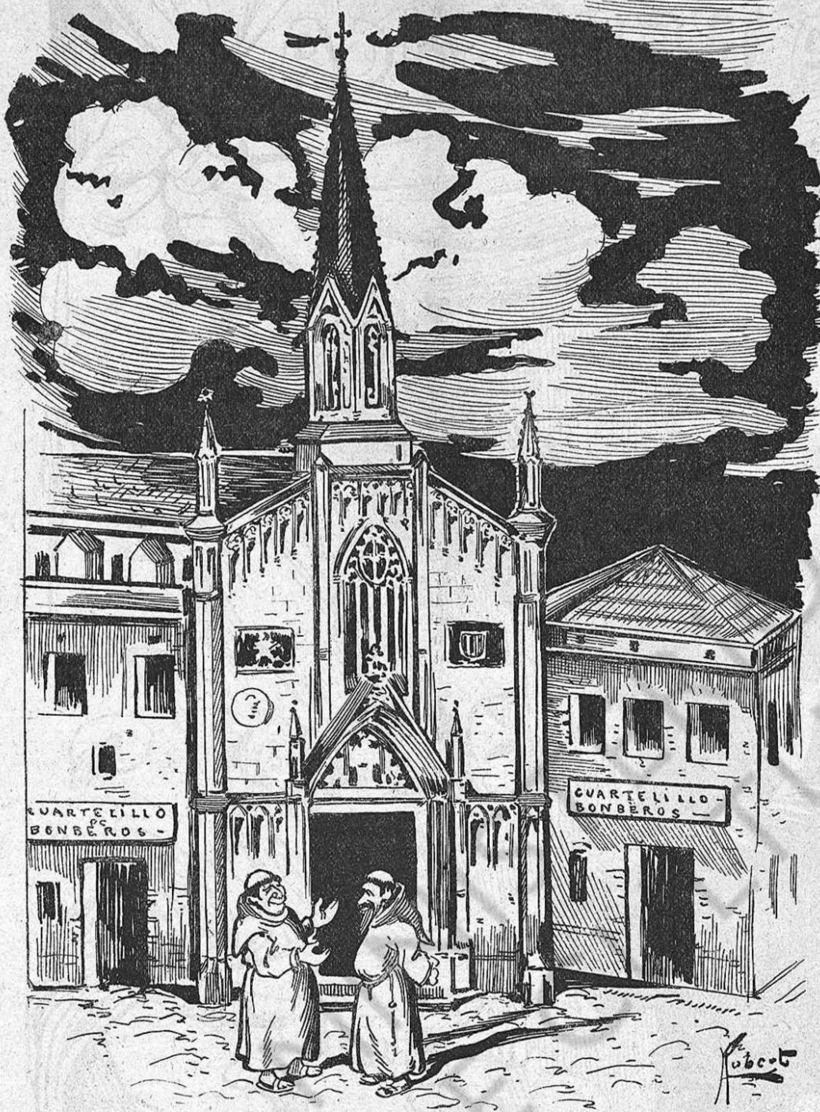
—¿Veyeu, pare Nofre? Sembla que ab un quartellillo de bombers á cada costat, un hom está més tranquil.