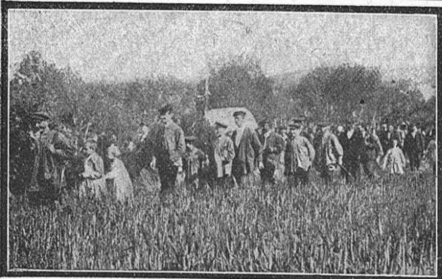
Arribada de la comitiva de Rubí.