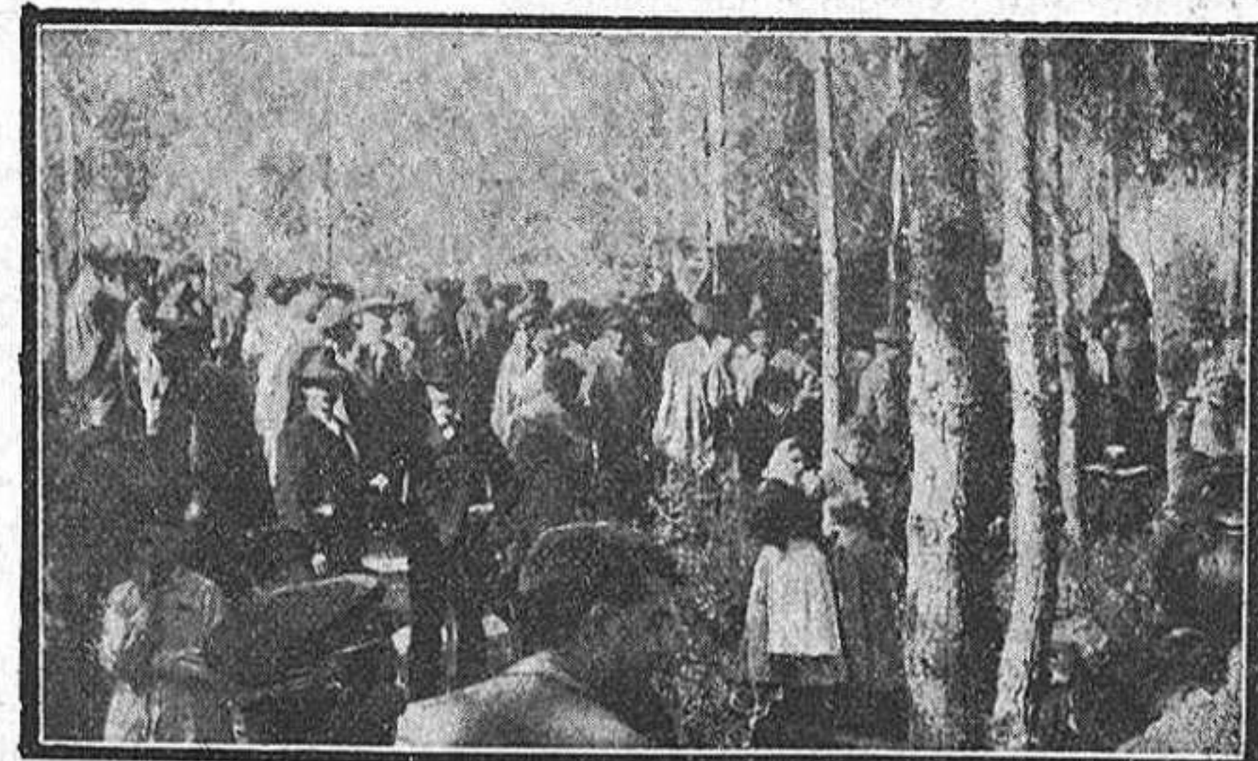
Disposantse pera 'l retorn.