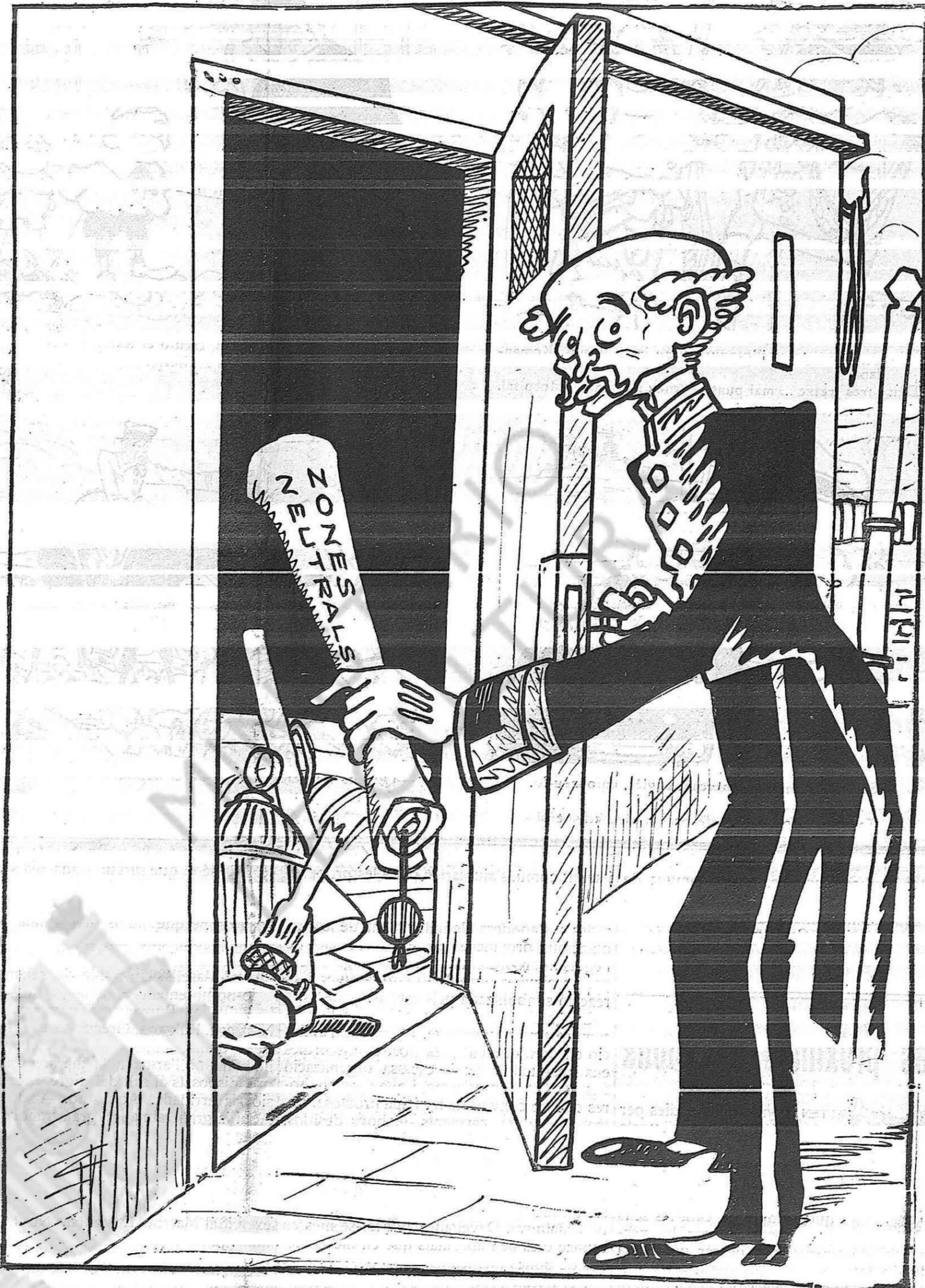
— Tan-se-val que ho desem al quarto dels mals endreços.