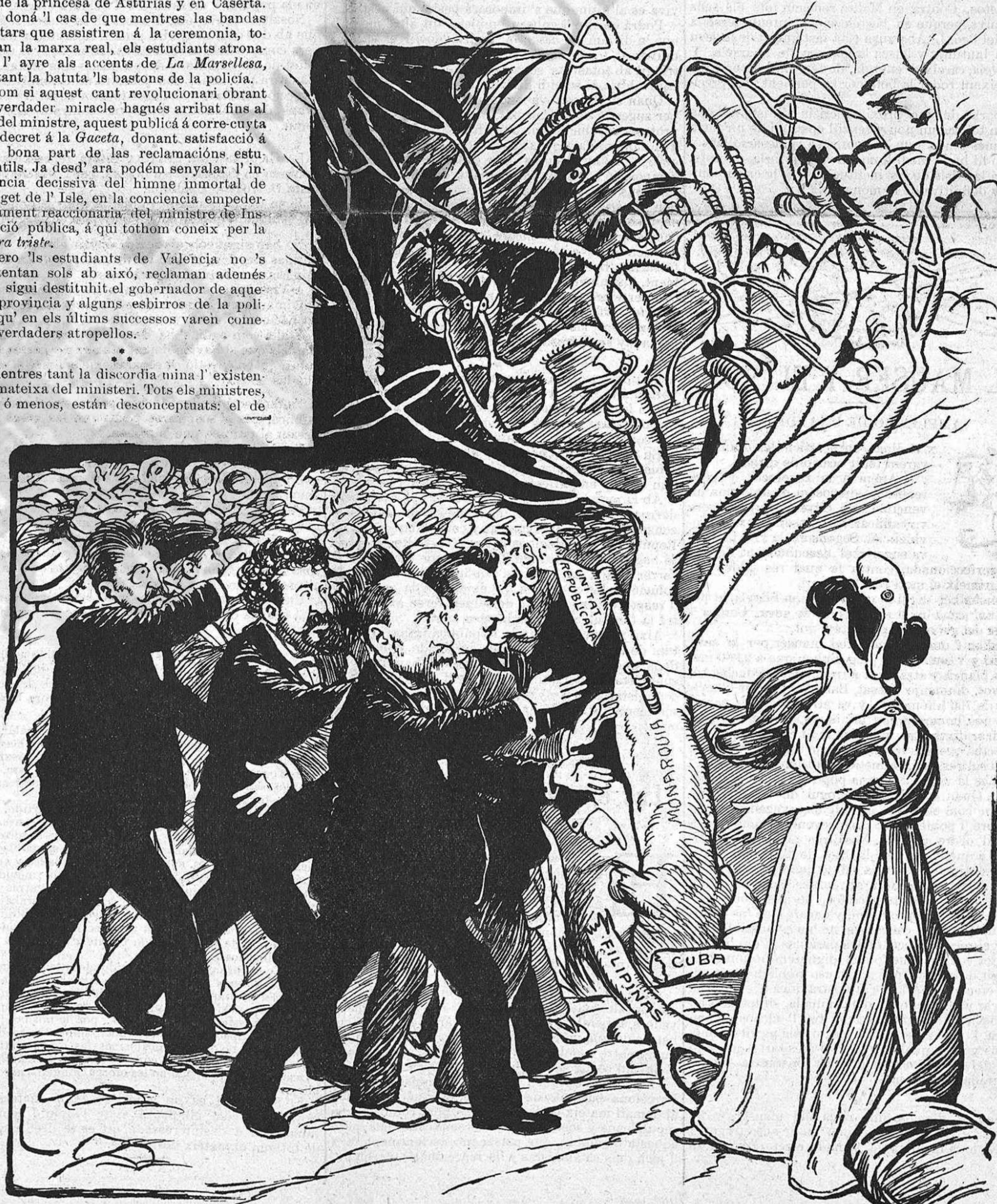
—Teniu, lo que ara interessa es aixó: tirar entre tots l'arbre a terra. Després ja veurém lo que s'hi ha de plantar.