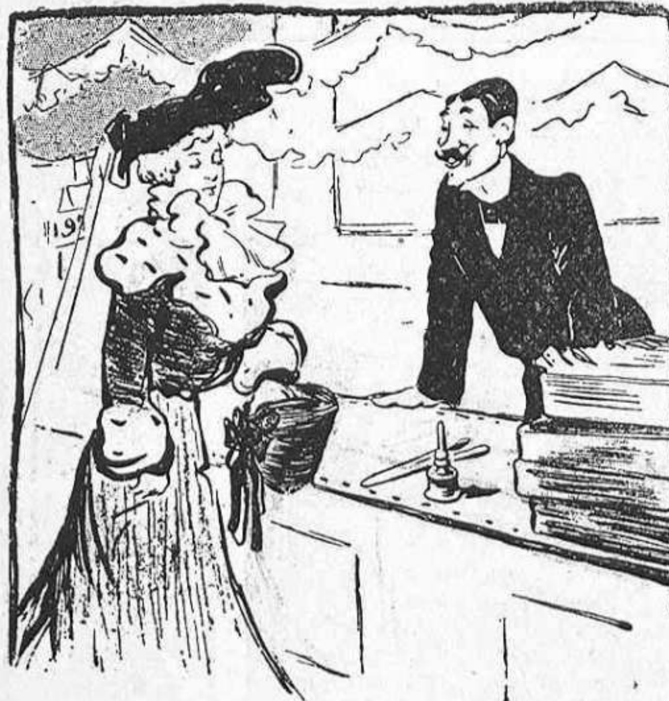
—Li recomano, senyora, el nostre guant «Guerra del Transvaal», un article de duració ilimitada.