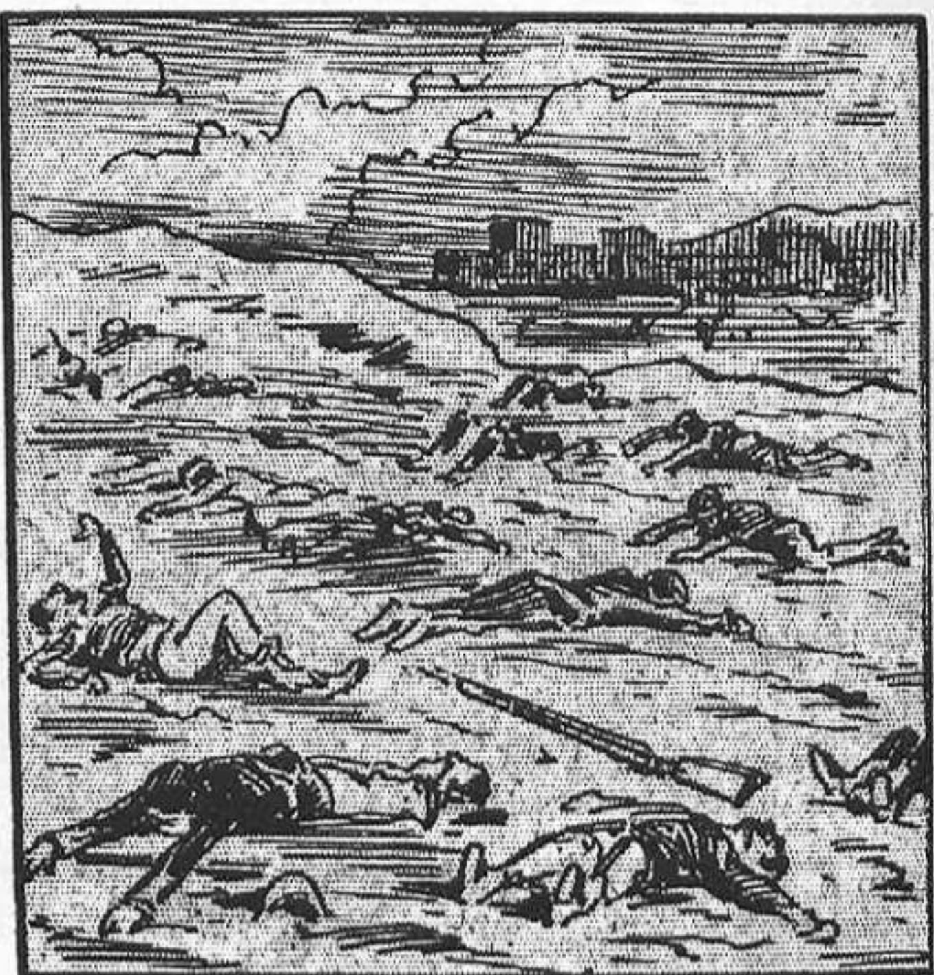
—D' aixó l' general Kitchener ne diu «dormir sobre las posiciones del enemich.»