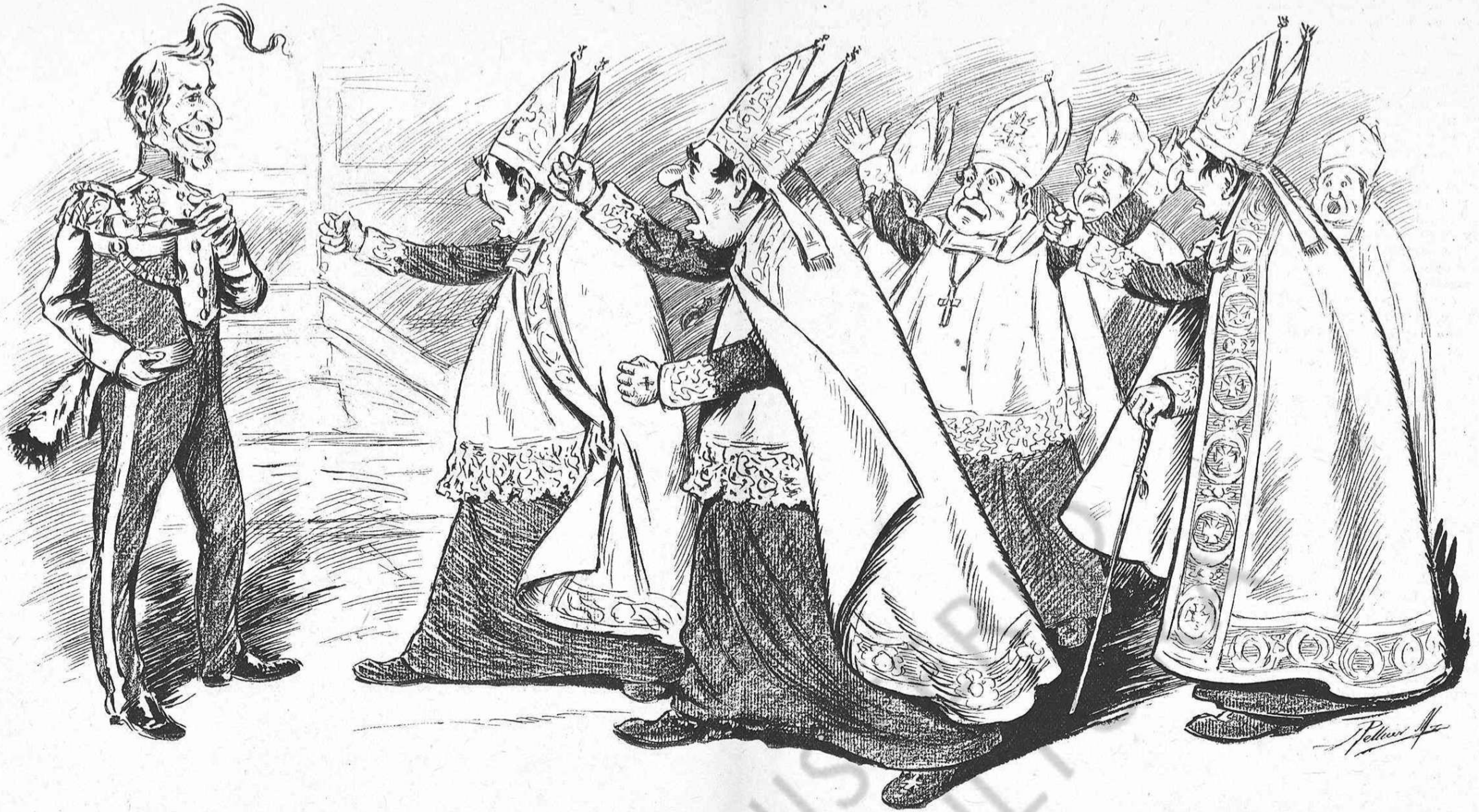
—No s' alarmin; si m vesteixo de miliciano y m' omplo 'l morrió de frares, es porque 'l poble estigui content; pero per lo demés, ja sabeu que l' Iglesia pot contar sempre ab mí.

hagué per son cadavre ni quatre miserables pots de fusta: embolicat ab un llenzol y sense l' assistència de un sol ensotant sigué conduhit al cementiri, produhint entre tot el vehinat verdader disgust. Aixís practican la caritat, sobre tot els que s' dedican a campársela predi-cantla.