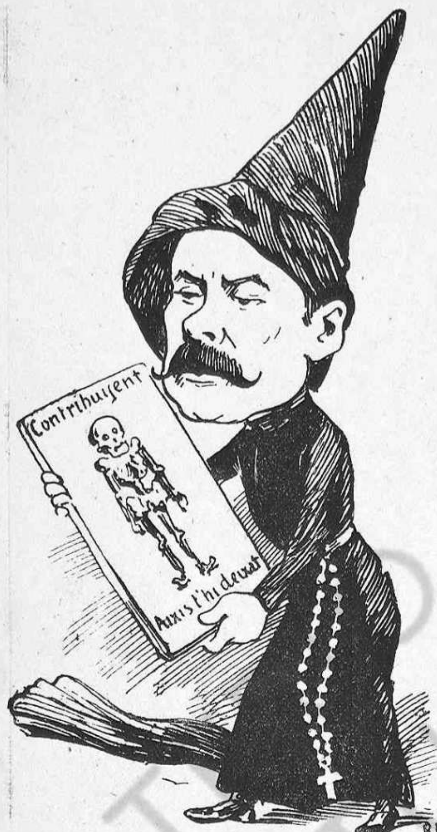
El congregant Vila-pierde.

«Aixó no es molt civilisador—deya—pero... es negoci!» Lo dit: en plena prosa de la vida.