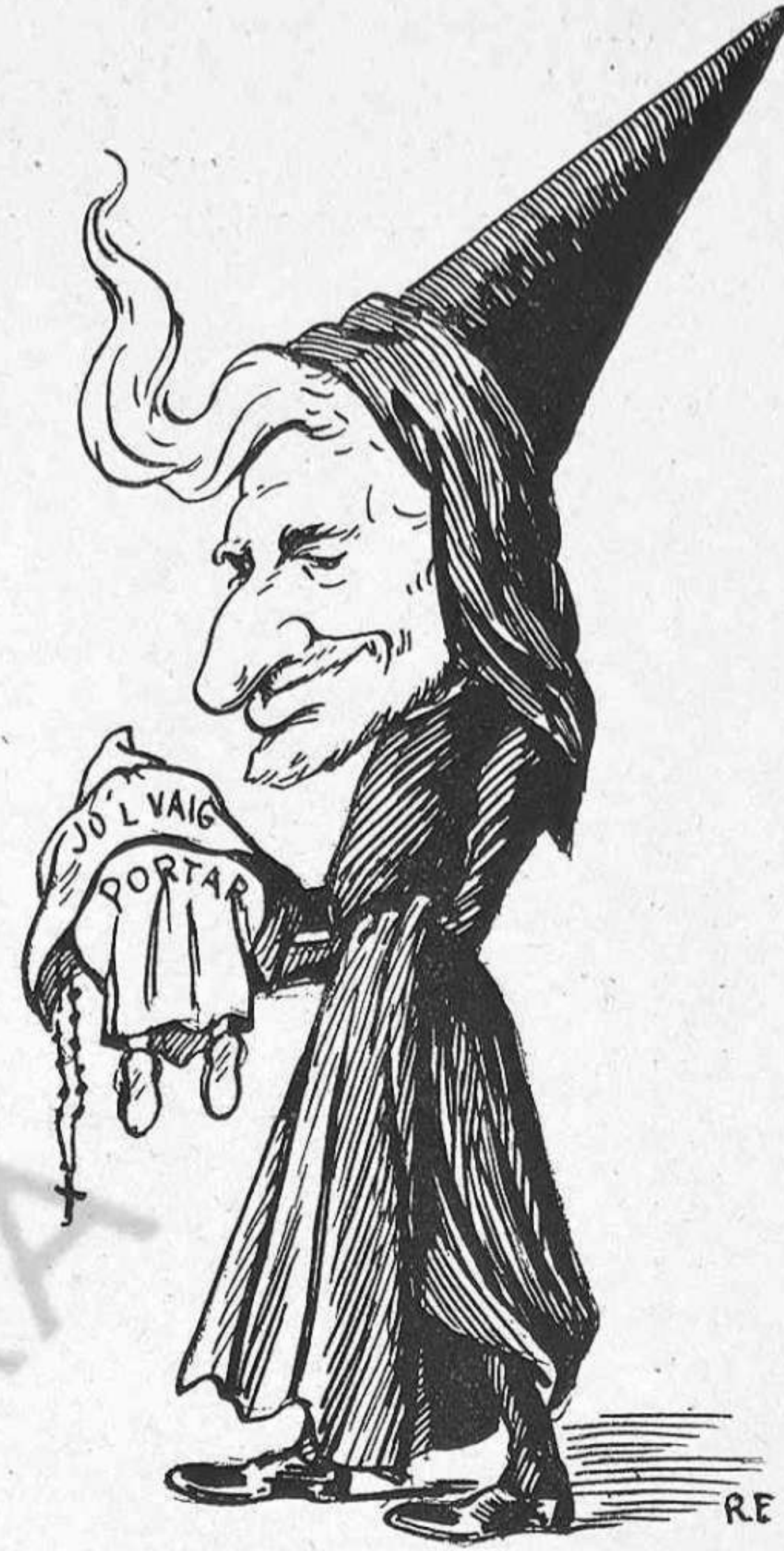
El congregant Se-la-gasta.

mes que una fábula, ha sigut desgraciadament un fet real—que de no haver-ho sigut, altre gall eis cantaria—precisa que desaparegui per sempre més, es de tot punt indispensable que se 'n perdi hasta 'l recort.