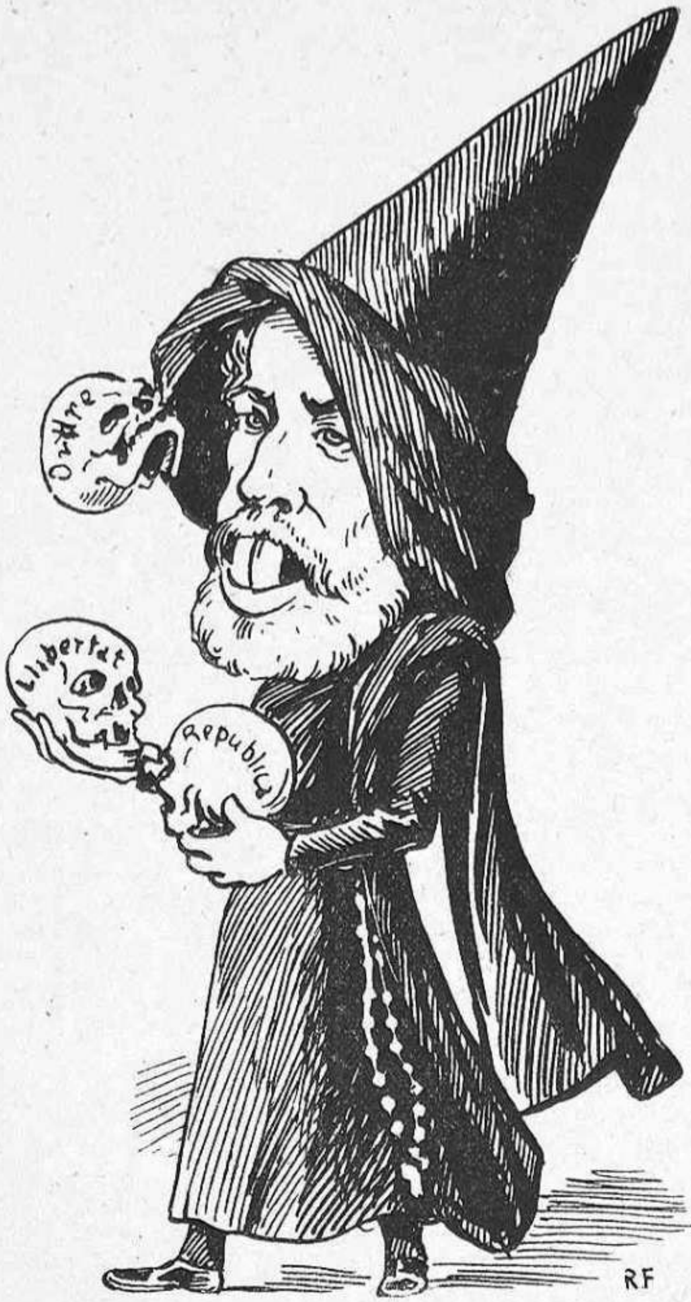
El congregant Ramero.