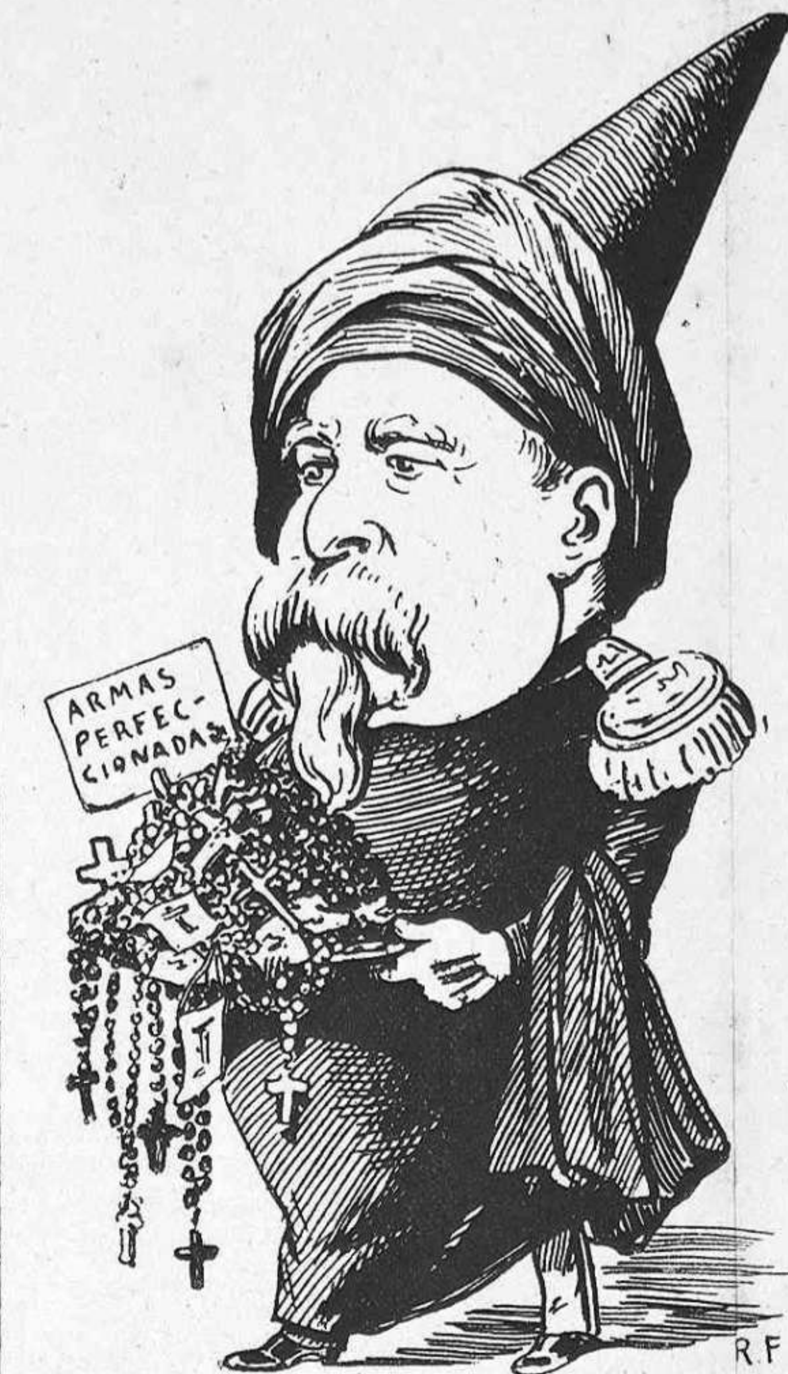
El congregant As-carrega.

Alló que 'ls firmants califcan de «legenda de la desunión republicana» y que parlant ab plena sinceritat,