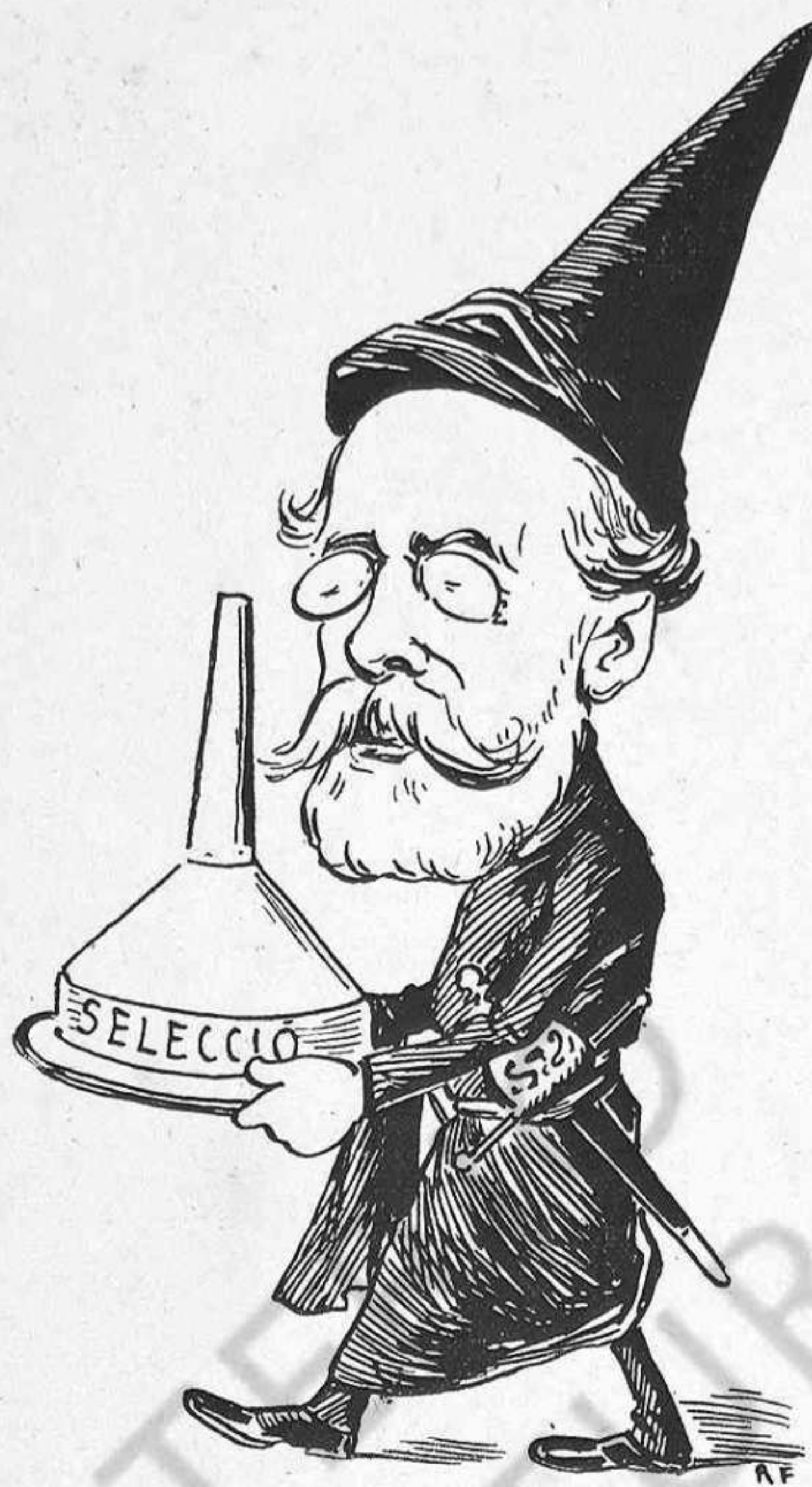
El congregant Sin-vela.