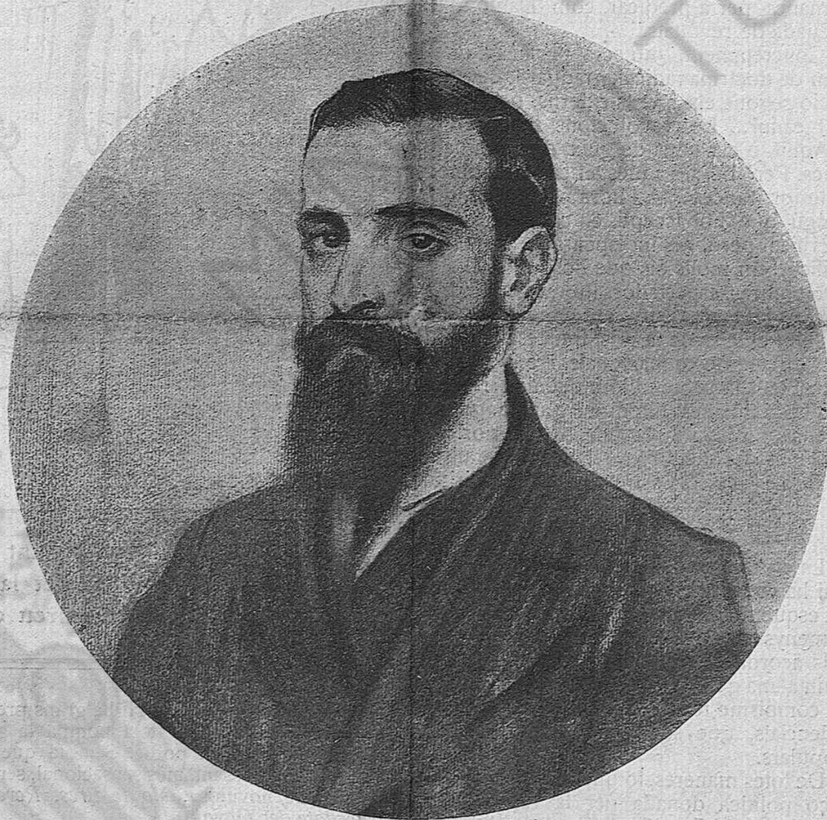
D. FRANCESC CAMBÓ

Després de la qüestió del Marroc cap gesta parlamentària, de les que han vingut després, podia interessar-nos. Curiosos sí que ho són, les coses que s'han dit els polí-