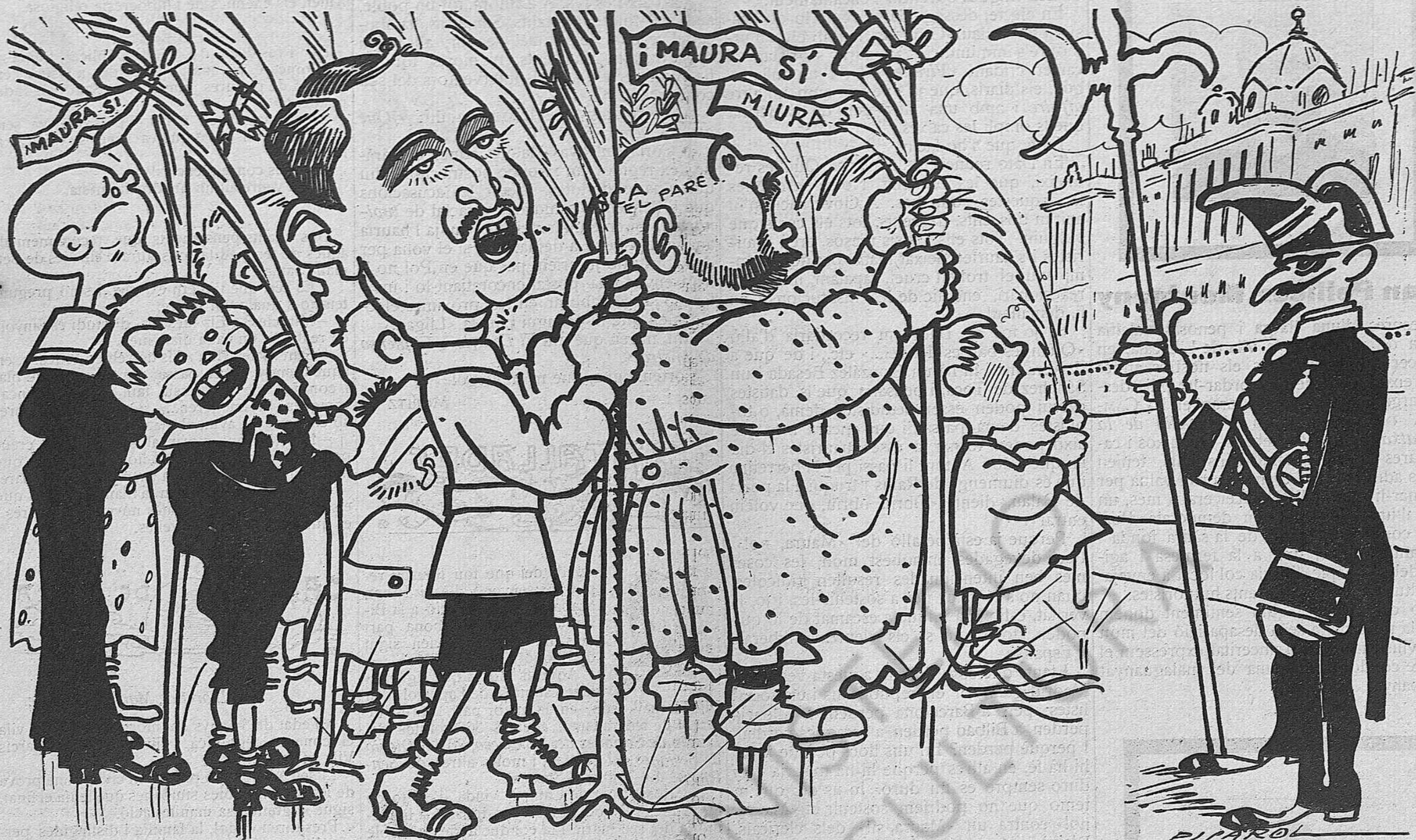
—Obriu!... Obriu!... Obriu, que volem entrar!...