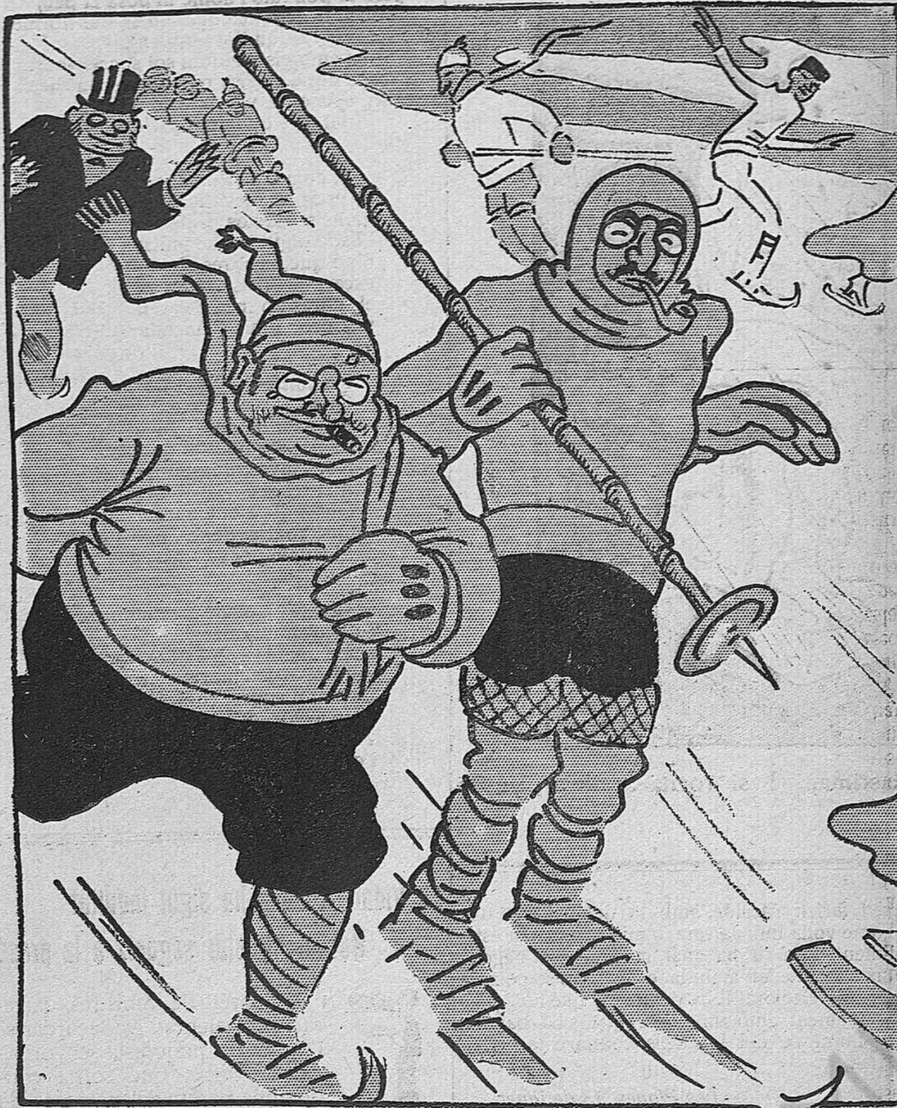
Els alegres sports d'hivern.