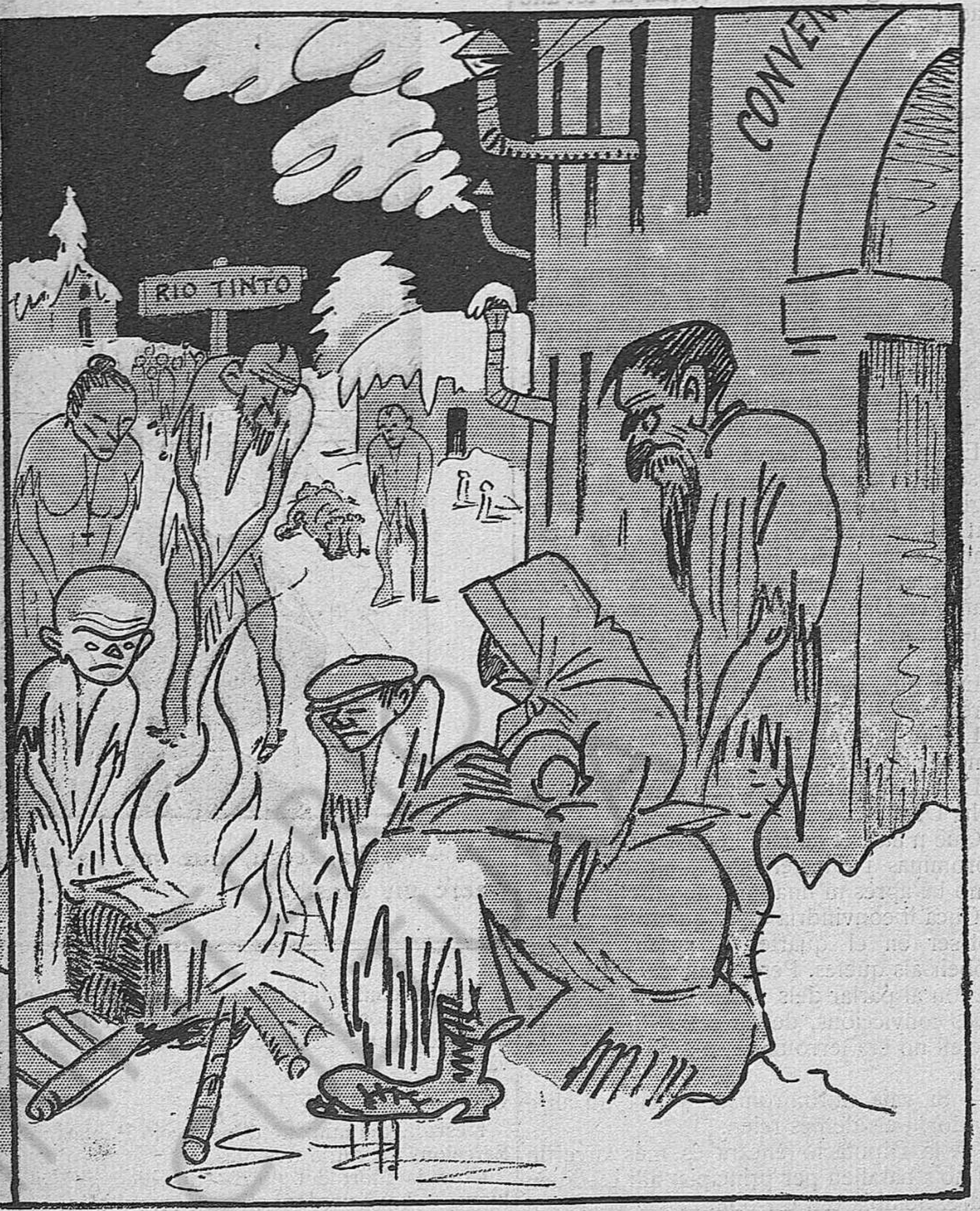
Els tristos sports d'hivern.

empresa per tota la Premsa avançada, no logrés convèncer al Govern.