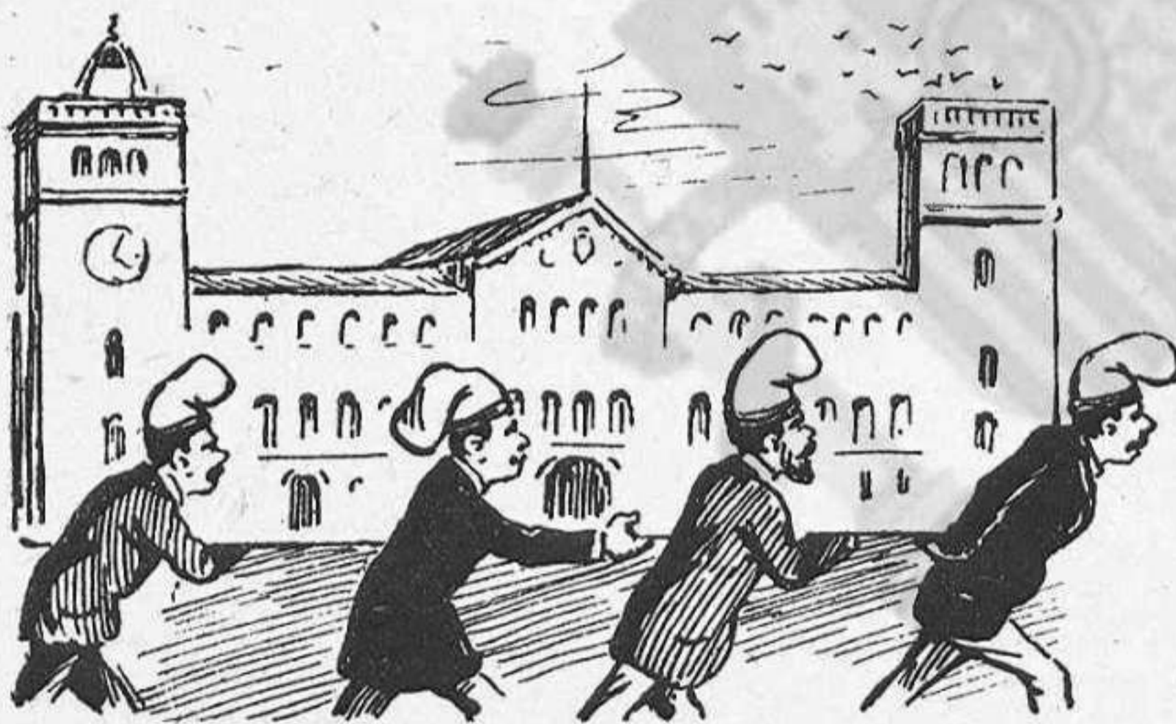
«El catalanismo se ha apoderado de la Universidad.»