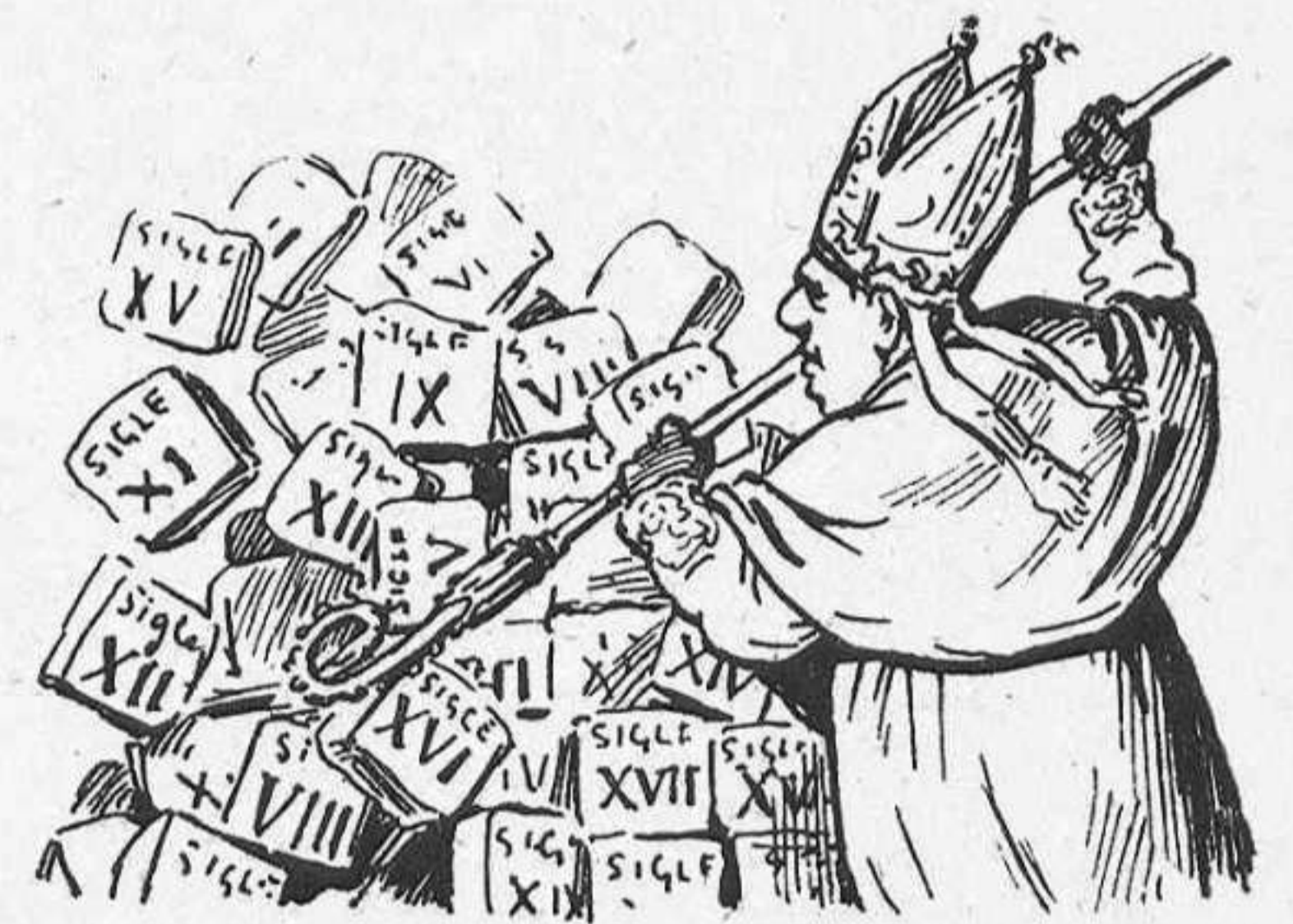
«El Obispo de Barcelona ha pretendido deshacer la obra de los siglos.»