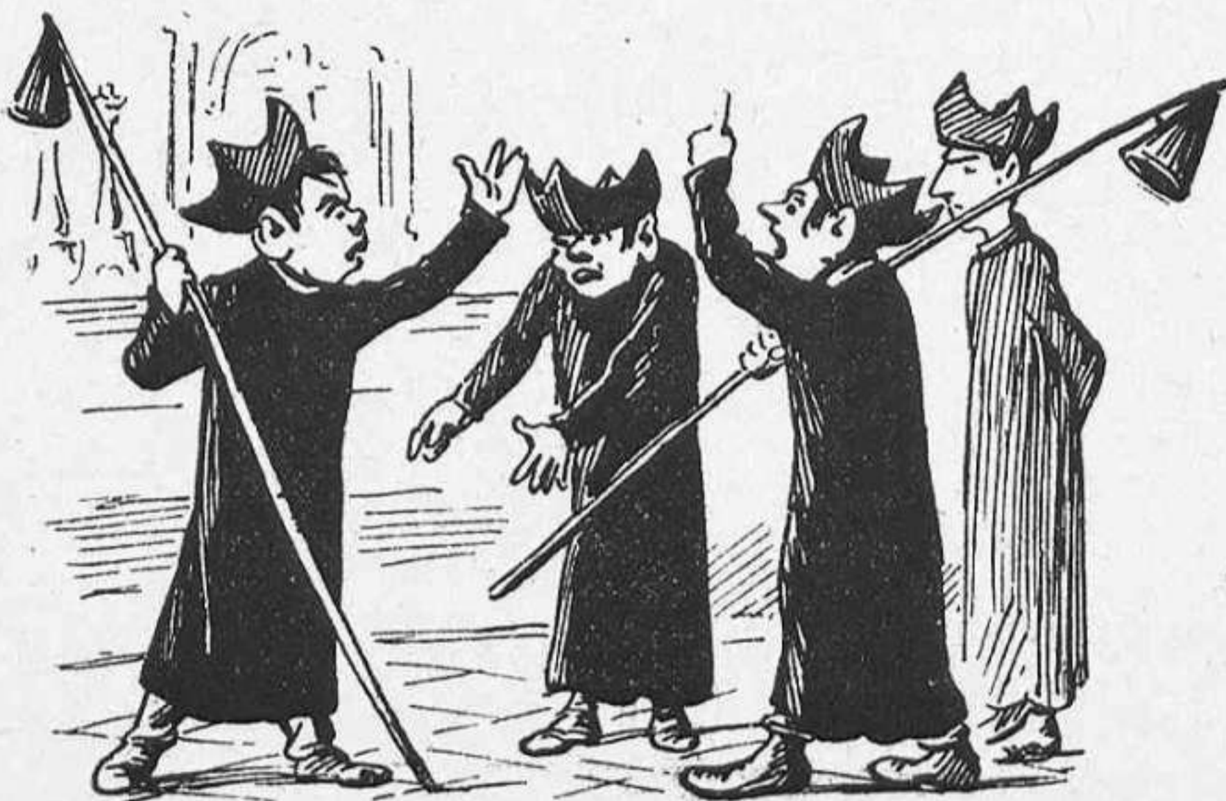
«Las sacristías son clubs de insurrección.»