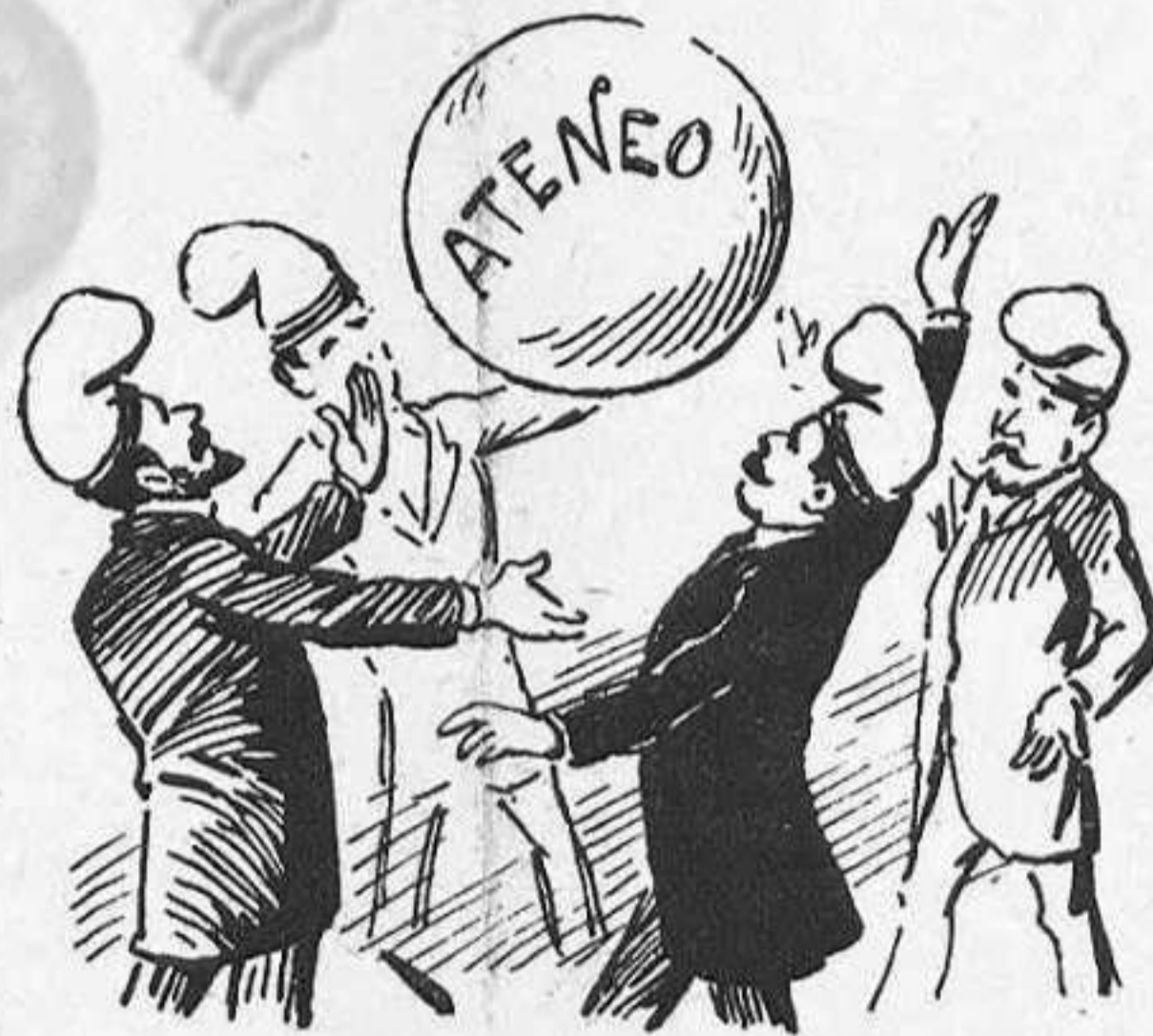
«El Ateneo está en manos del grupo catalanista.»