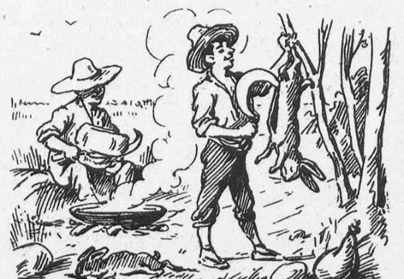
«¿Sabéis finalmente qué significa el himno de los Segadors? Un himno de exterminio.»