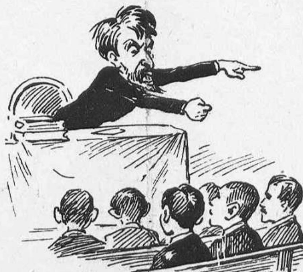
«Los catedráticos en vez de infundir la ciencia infunden odio y rencor.»