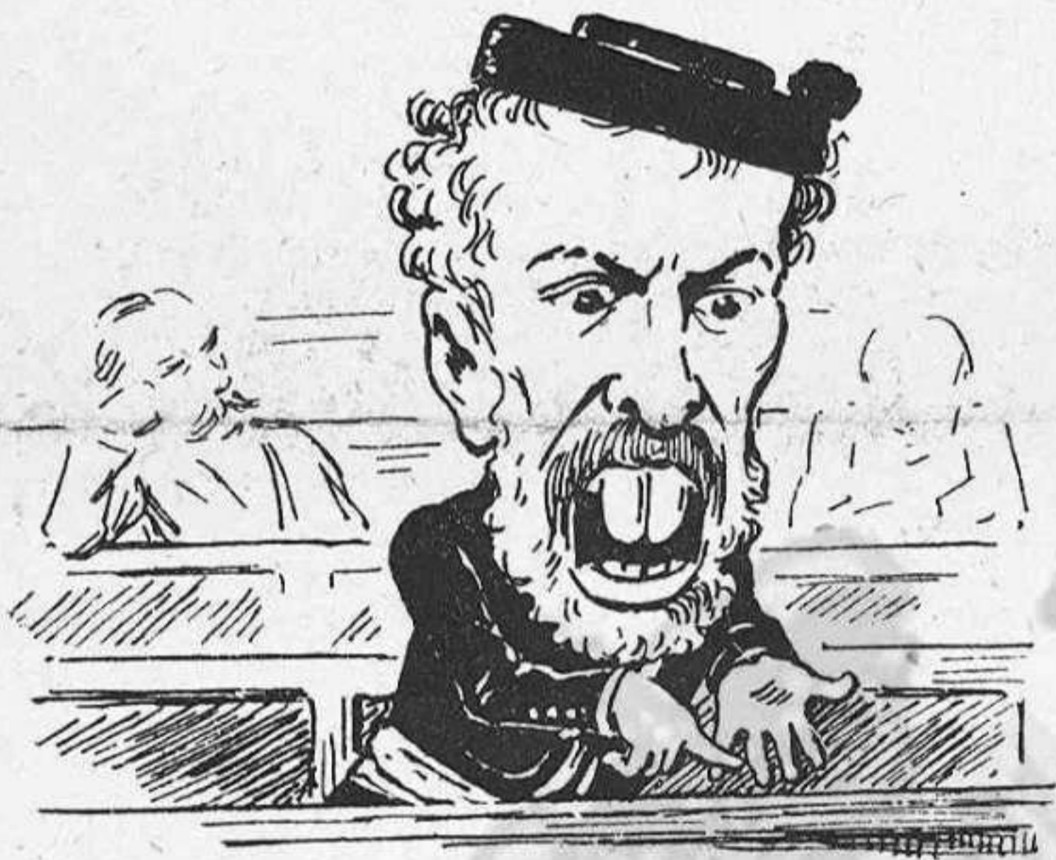
«Voy á enumerar los elementos catalanistas.»