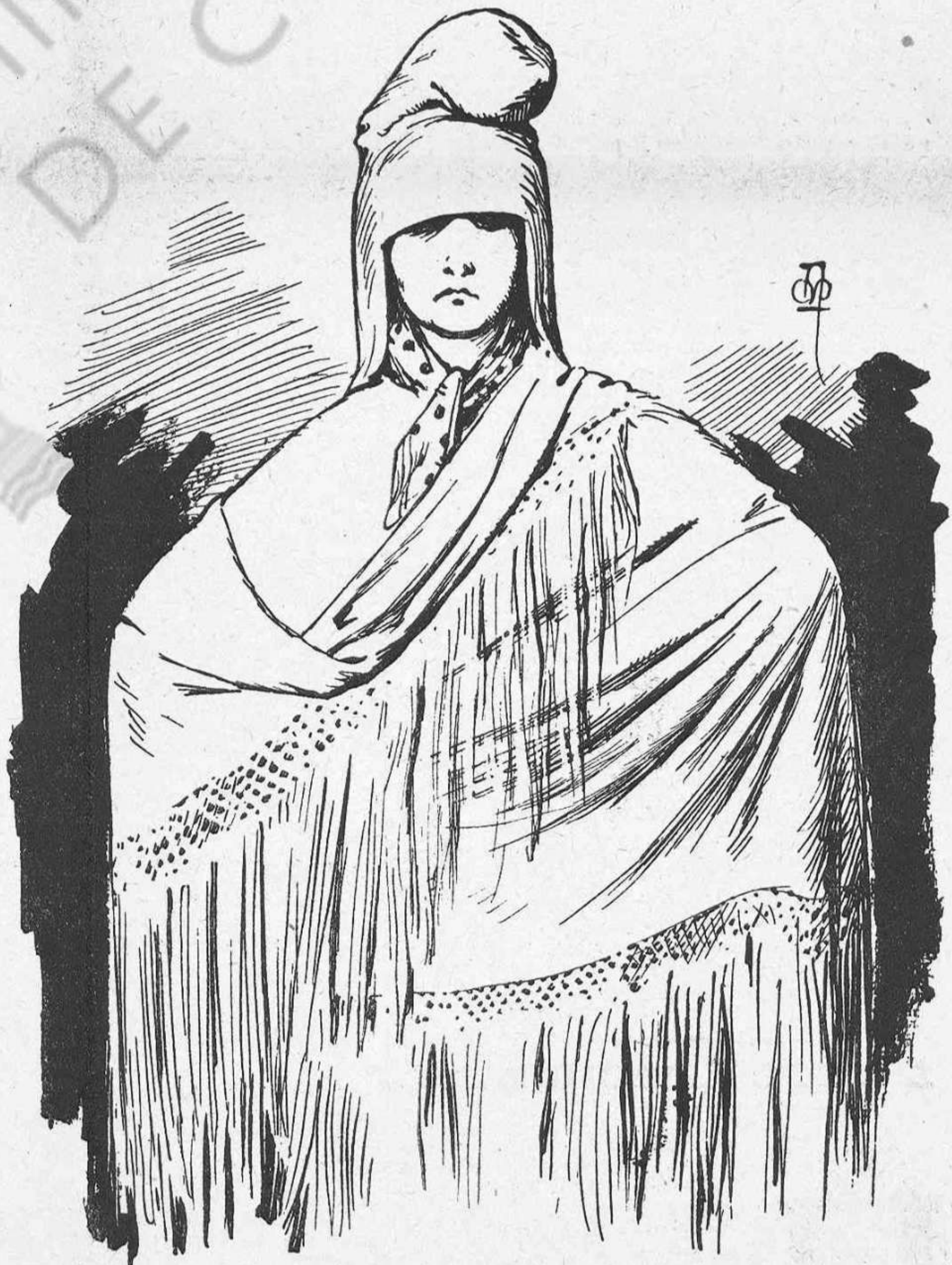
Ea cambi Espanya, vá probársela en 1873 y veyent que li venia gran s' ha quedat com un enza sense cuidarse més de arreglársela á la seva mida.

Castellfullit de la Roca.—Diumenje quan mes desitjavan els assistents á la missa que aquesta s' acabés perque faya un fret terrible, l' ensotanat va tenir la poca latxa de mal parlar de un pobre vell que s' havia mort y tot perque vivia en companyia de una dona. Ara vegin quin delictel! Com si 'ls que viuen en aques-