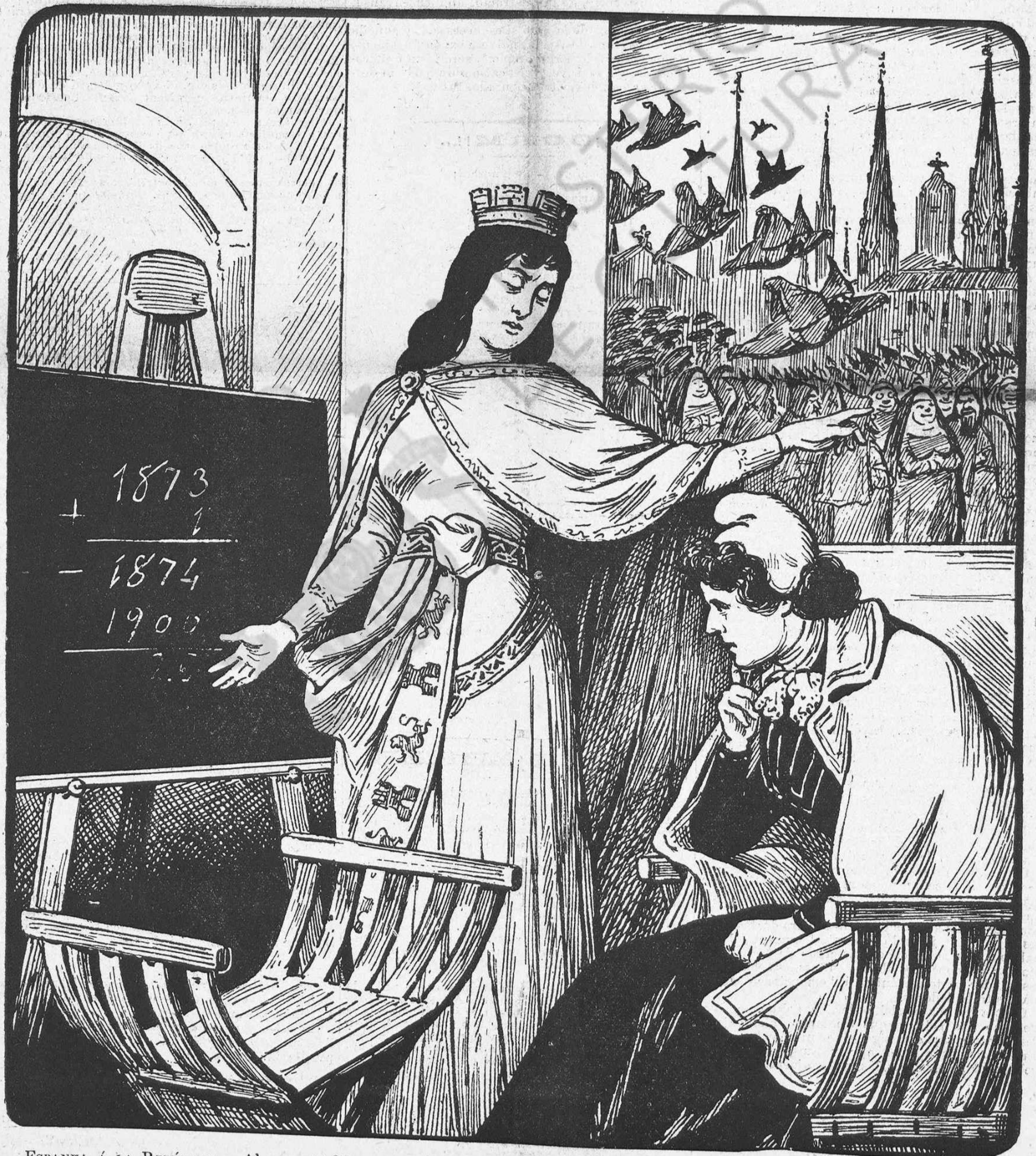
ESpanya á LA REPÚBLICA.—Ab aquests 26 anys que tú has perdut miserablement, aquí tens el quadro viu que m' han pintat.