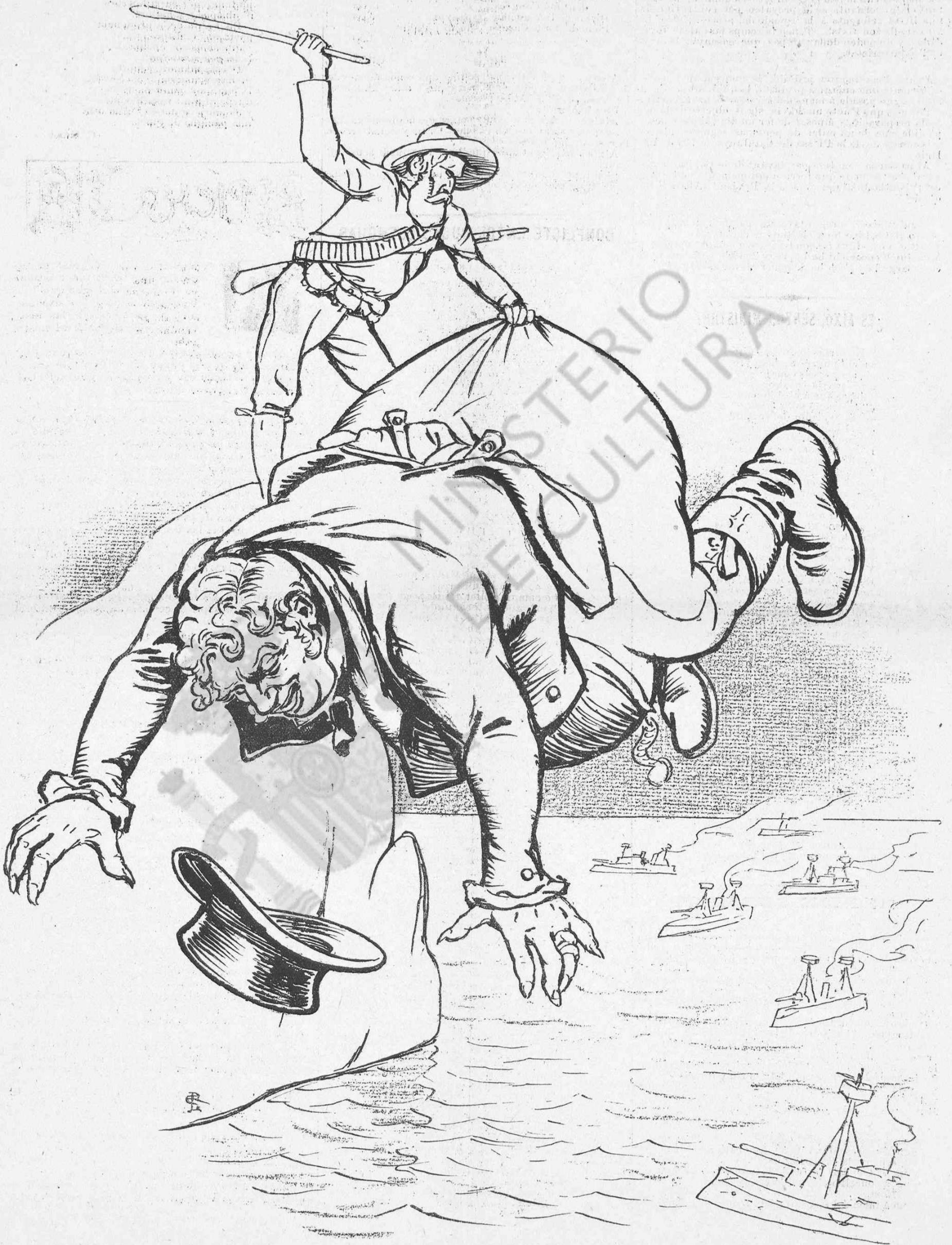
Els xichs pegan als grans quan tenen rahó y pit y bonas mans.