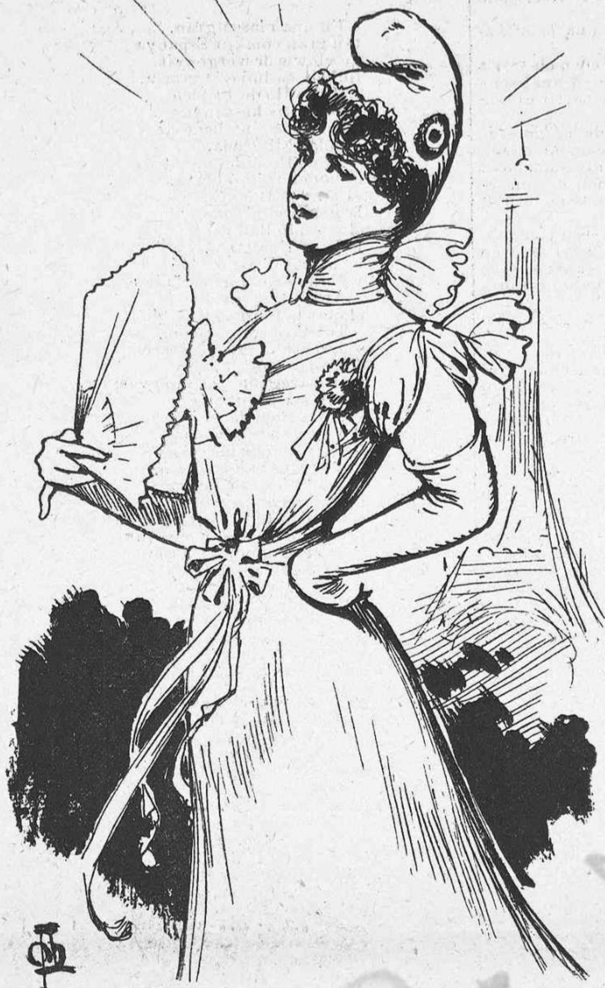
La Fransa va probar aquesta en 1870 y veyent que li anava que ni pintada, no ha volgut probarne d'altra.

—¿Un' altre... y per dins?—preguntarán vostés.—¿Qui es aqueixa dona? —Qui volen que siga. La conciencia.