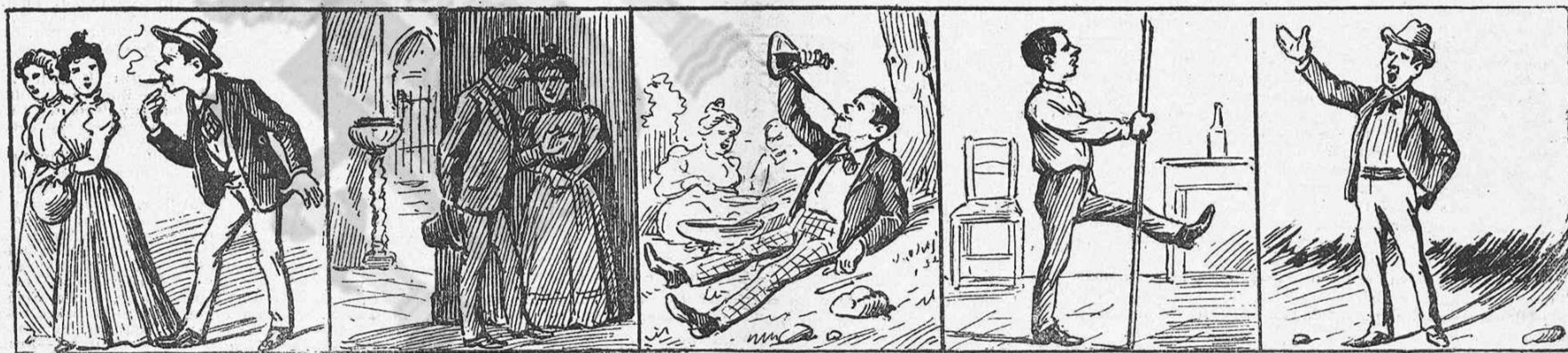
Dice ¡hostia! á las niñas bonitas.