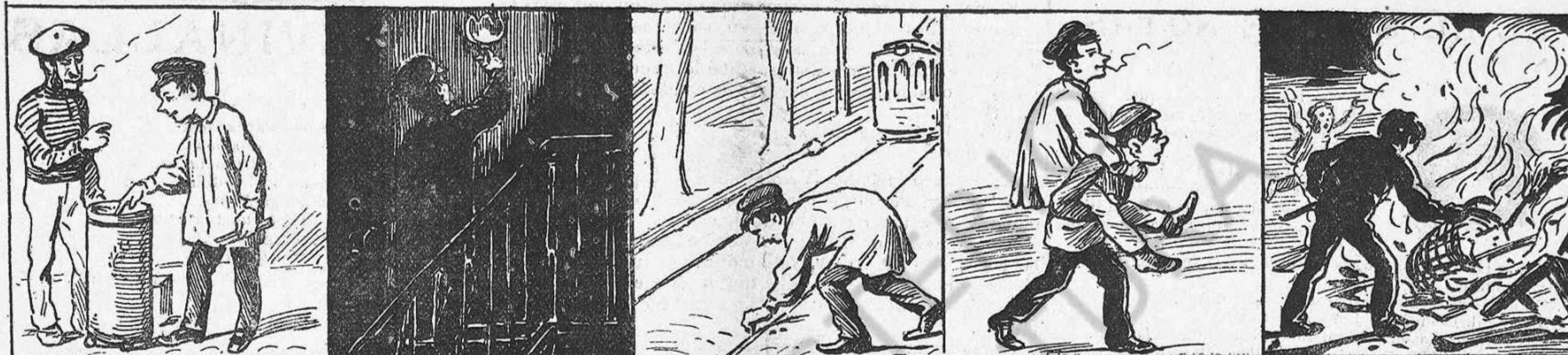
Es jugador de neulas.