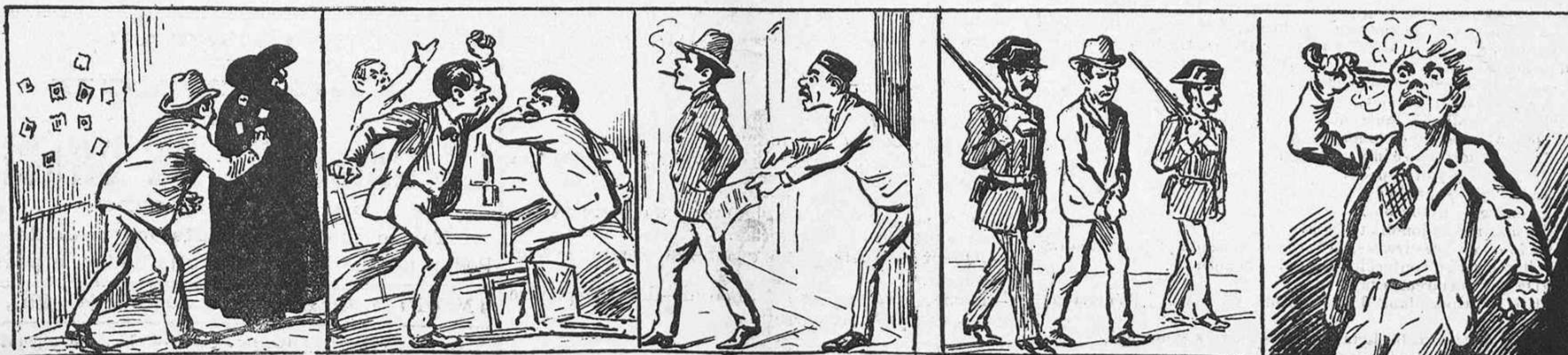
Pega sellos catalanistas en todas partes.