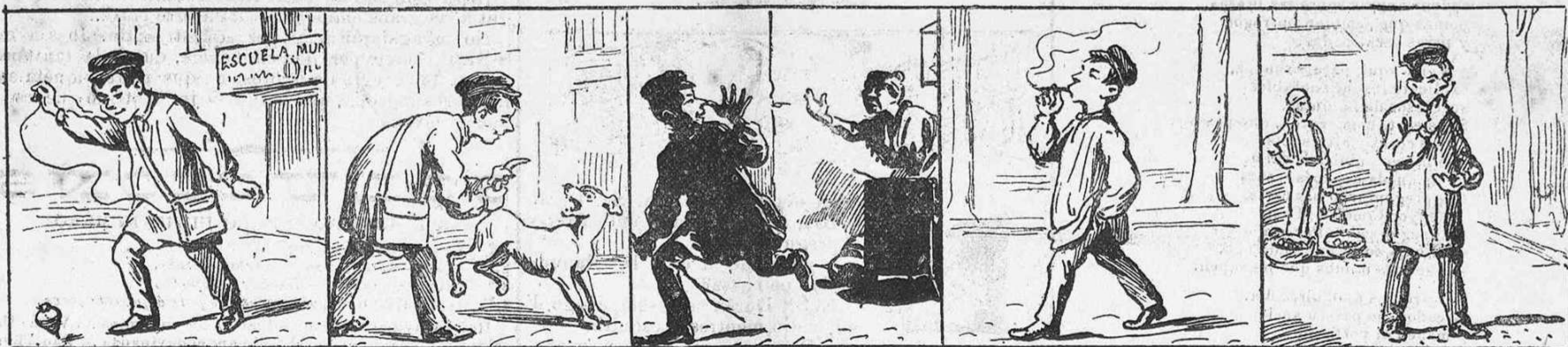
A la escuela hace campana.