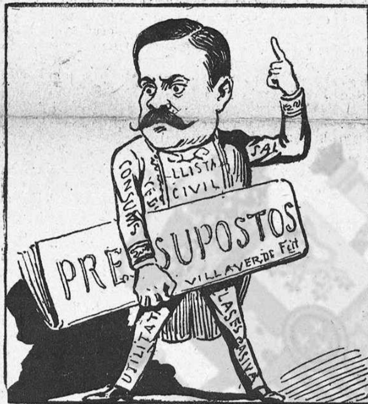
—Faré aprobá 'ls pressupostos en tota sa integritat.

«LO QUE VA DE AYER Á HOY» Ó 'L VESTIT DE 'N VILLAVERDE