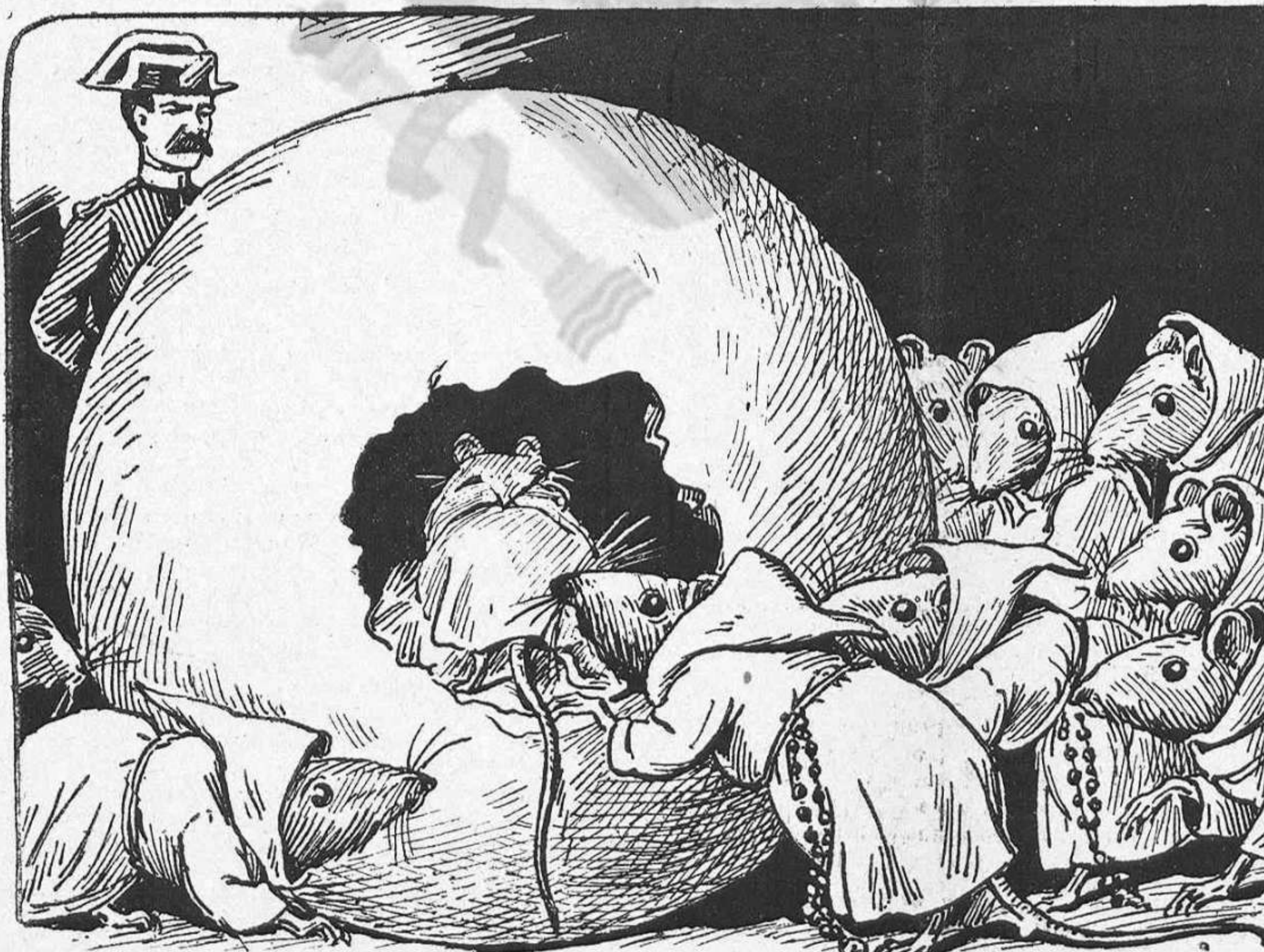
—Tornémnos á ficar dintre del formatje, ratas, que 'ls gats ja son fora.