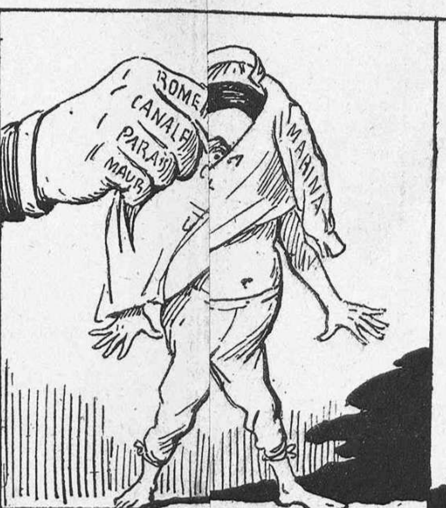
—Hasta 'm en la camisa! ¡Si qu' estich brrreglat!