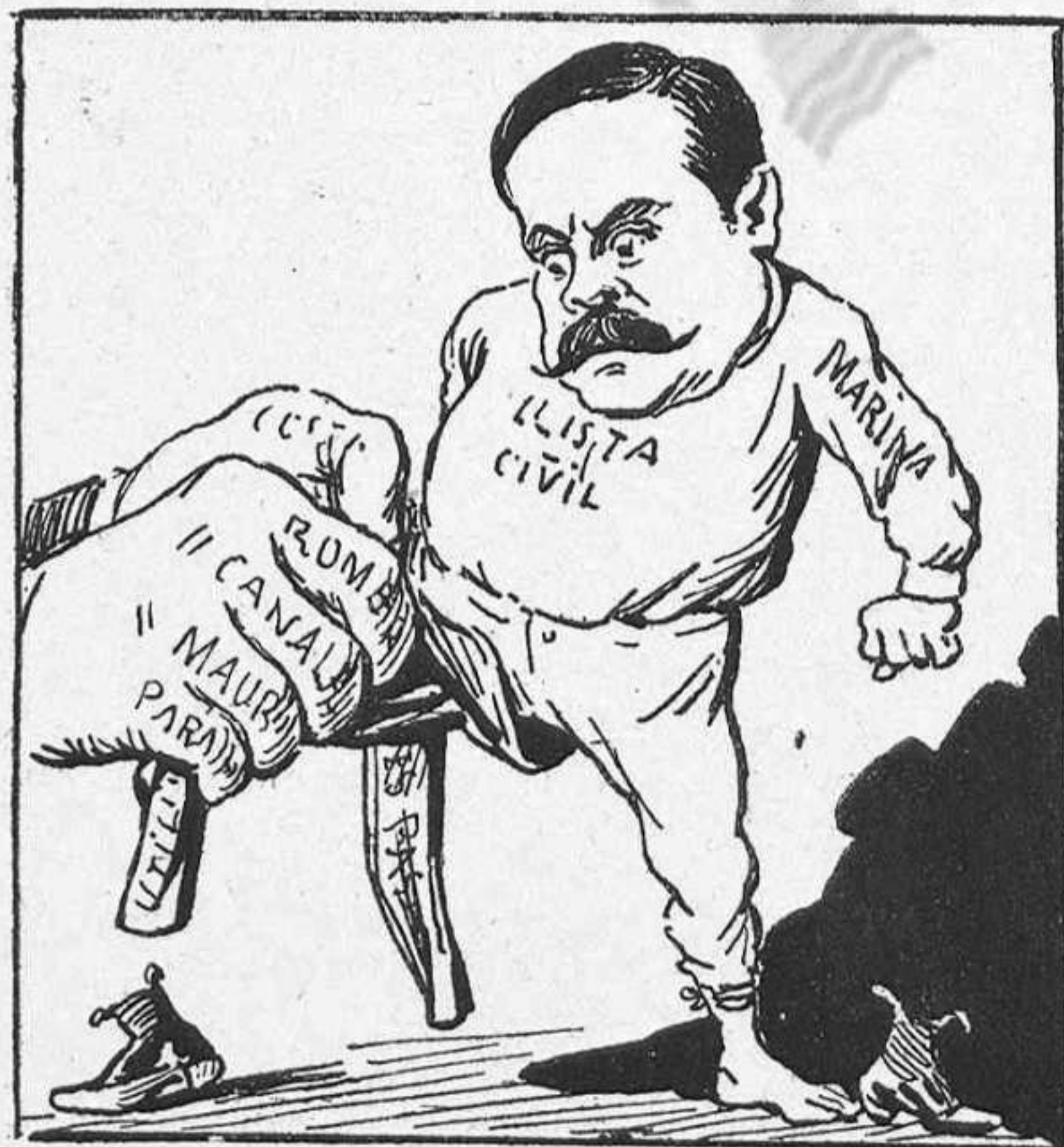
—¿Ara las calsas? ¡Caramba! Aixó ja m' empipa un xich.