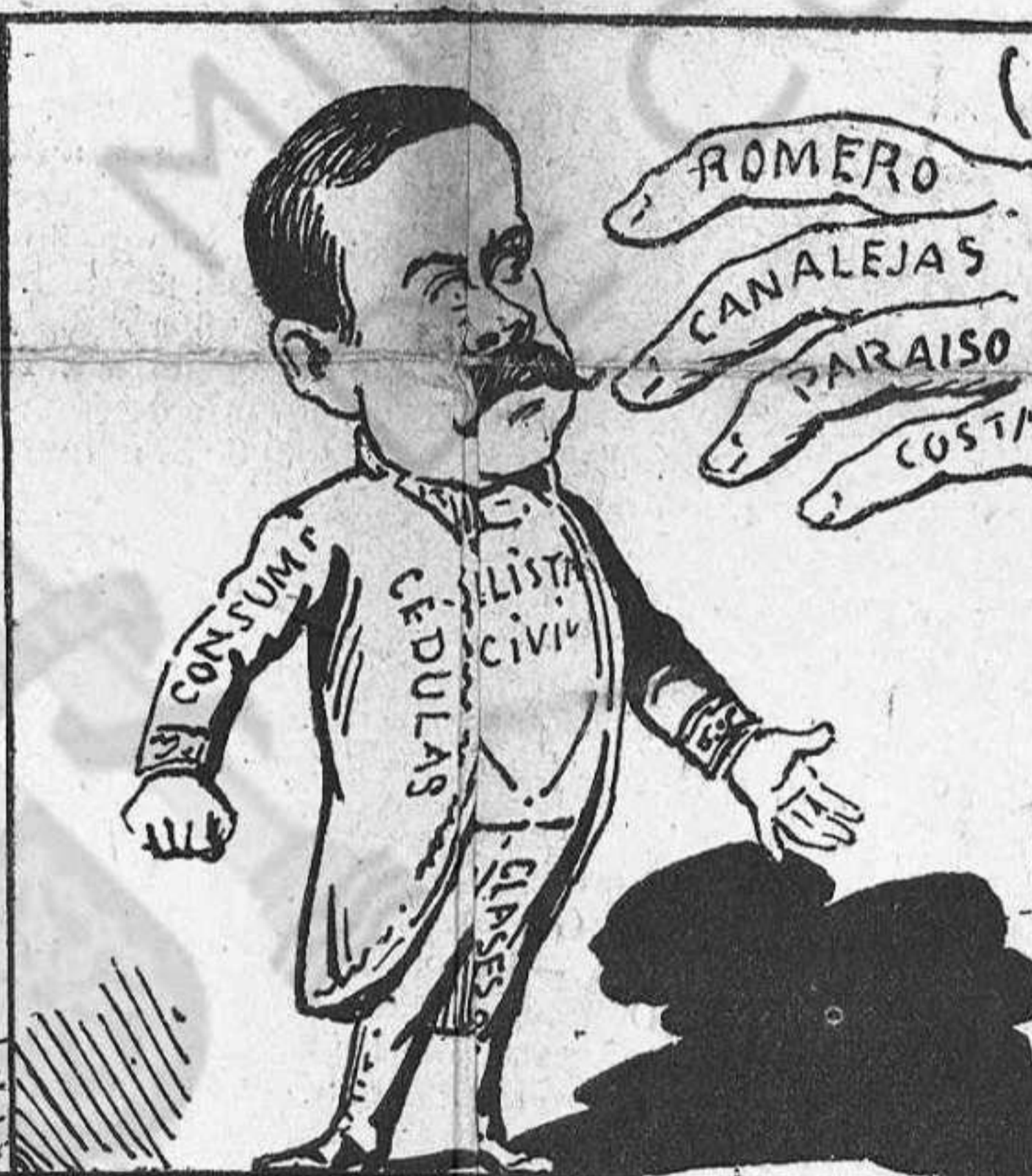
—¿Qué voler? ¿Que transigeixi? ¡No ho permeia dignitat!