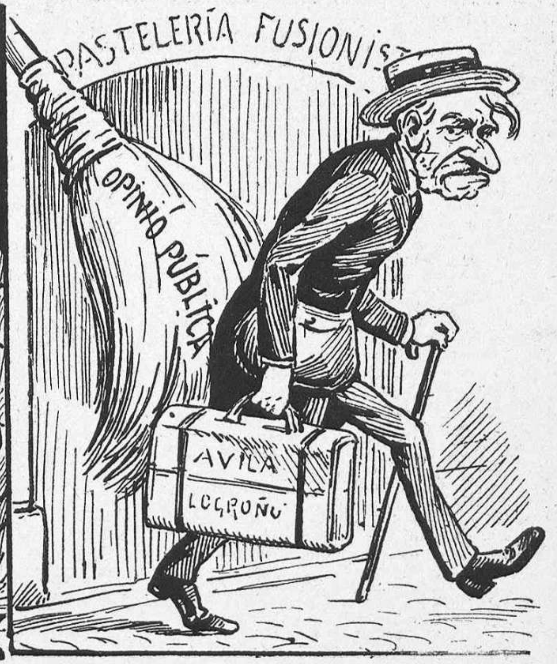
—¡Abur, rey dels trapassés! ¡Aixís no tornessis més!