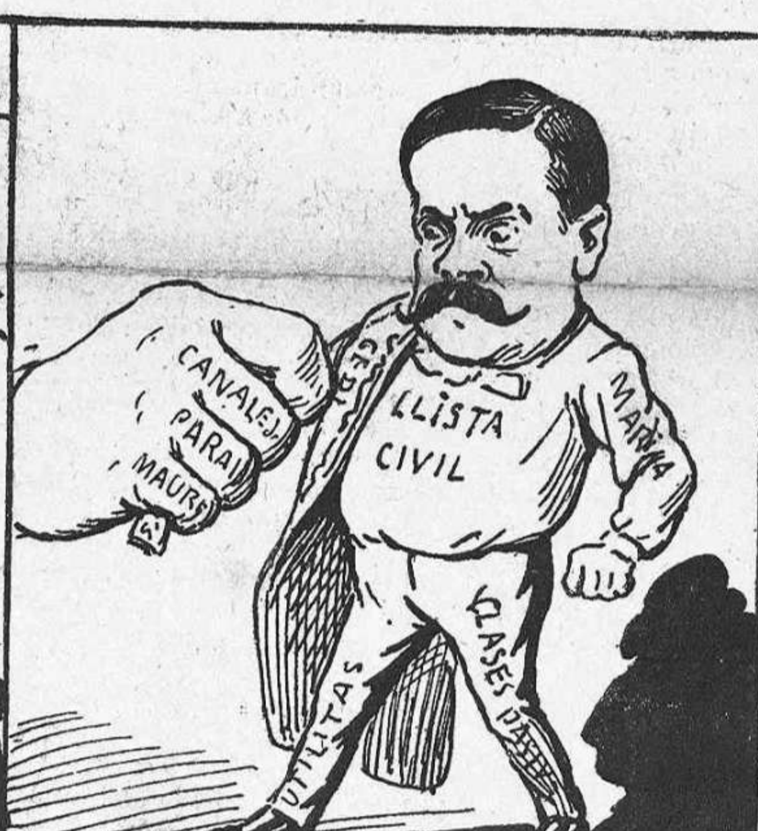
—Bueno, 'm treuré la casaca, pero res més, ja 'ls ho dich.