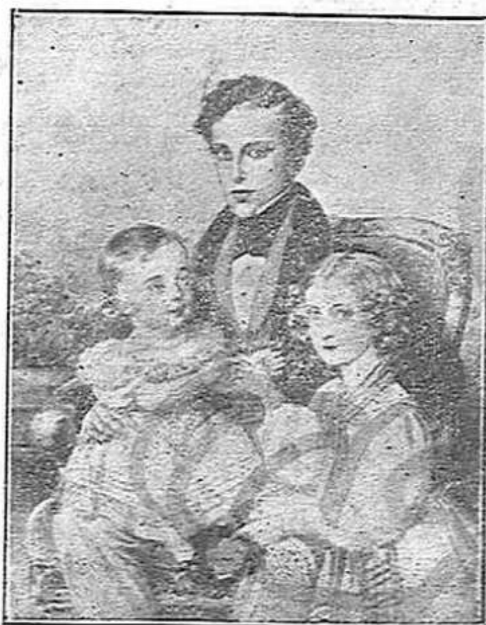
El duc de Reichstadt tenint sobre els genolls l'arxiduc, que sigué després l'Emperador Francesc Lluis

Recordem l'esbeltíssima figura de la comedianta francesa habillada amb els bells ropatges