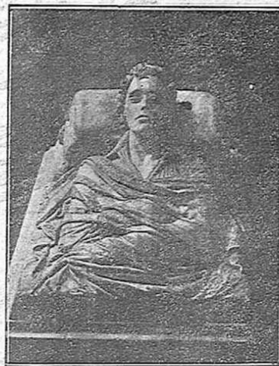
La veritable faç de l'aiglon

Mireu aquesta estampa, en la que L'aiglon està