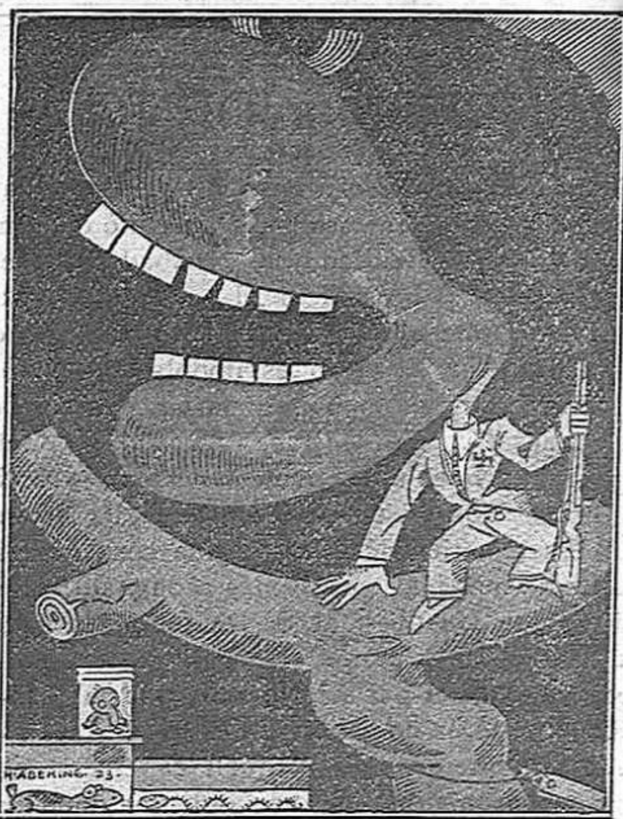
Aquesta vegada no en deixarem cap de viu

còlera o la peste bubònica. Quan un home és avari i de sentiments mesquins se li diu, com a insult suprem, com una escupinada llençada al mig del rostre: «Jueu!»