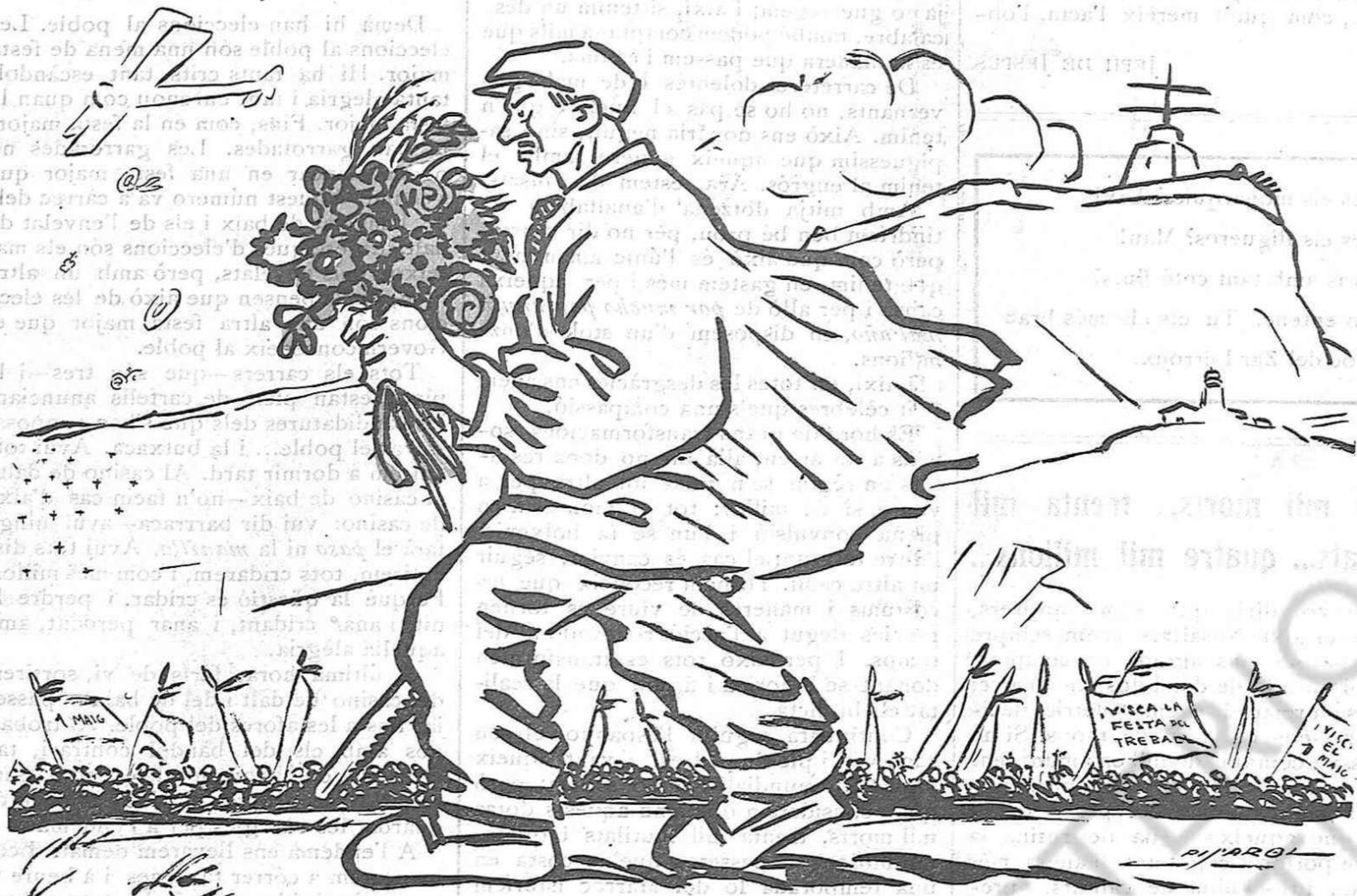
—Aquest any el celebrem com la diada de Tots Sants: portant flors als morts.