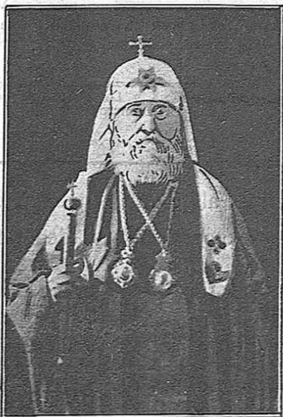
El patriarca Tikhon

A nosaltres, perdoneu la immodèstia, se'ns ocorreix una cosa. Anem a veure: el senyor Tikhon,