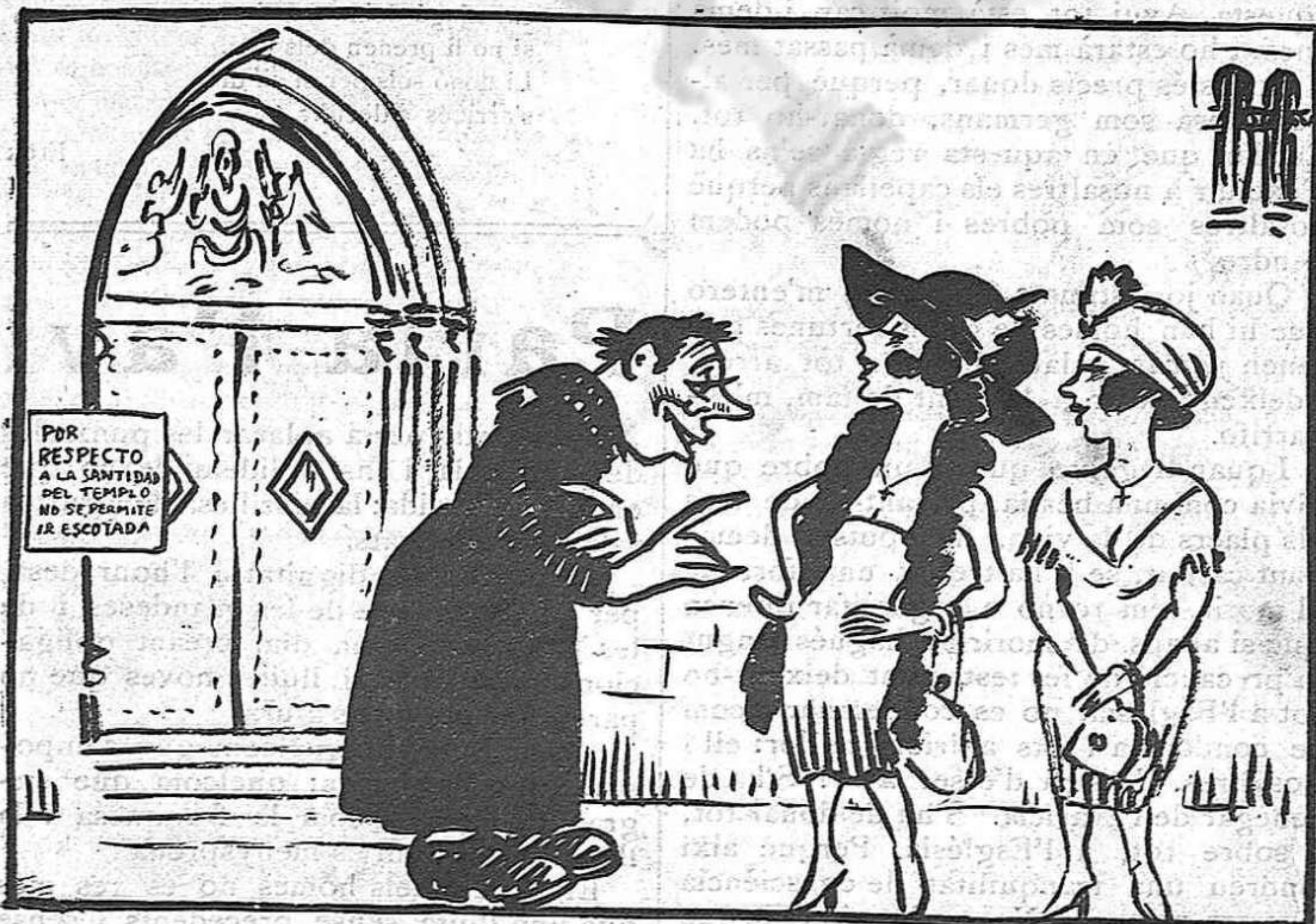
La moda i l'església.—Venint així tan escotades hauran d'entrar a la sagristia.