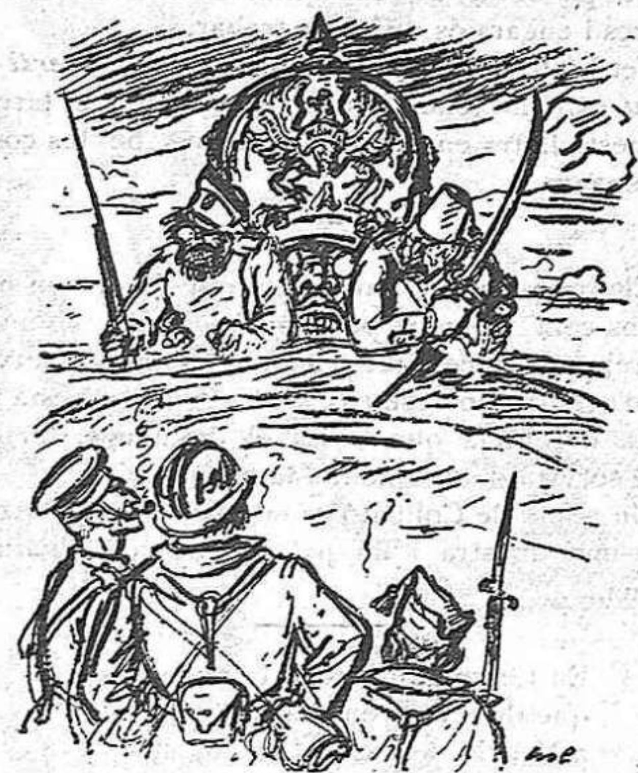
—No en feu cas si és que veieu tres caps: tireu contra un sol.

Rússia per un fet fatal, és la directora del mo-