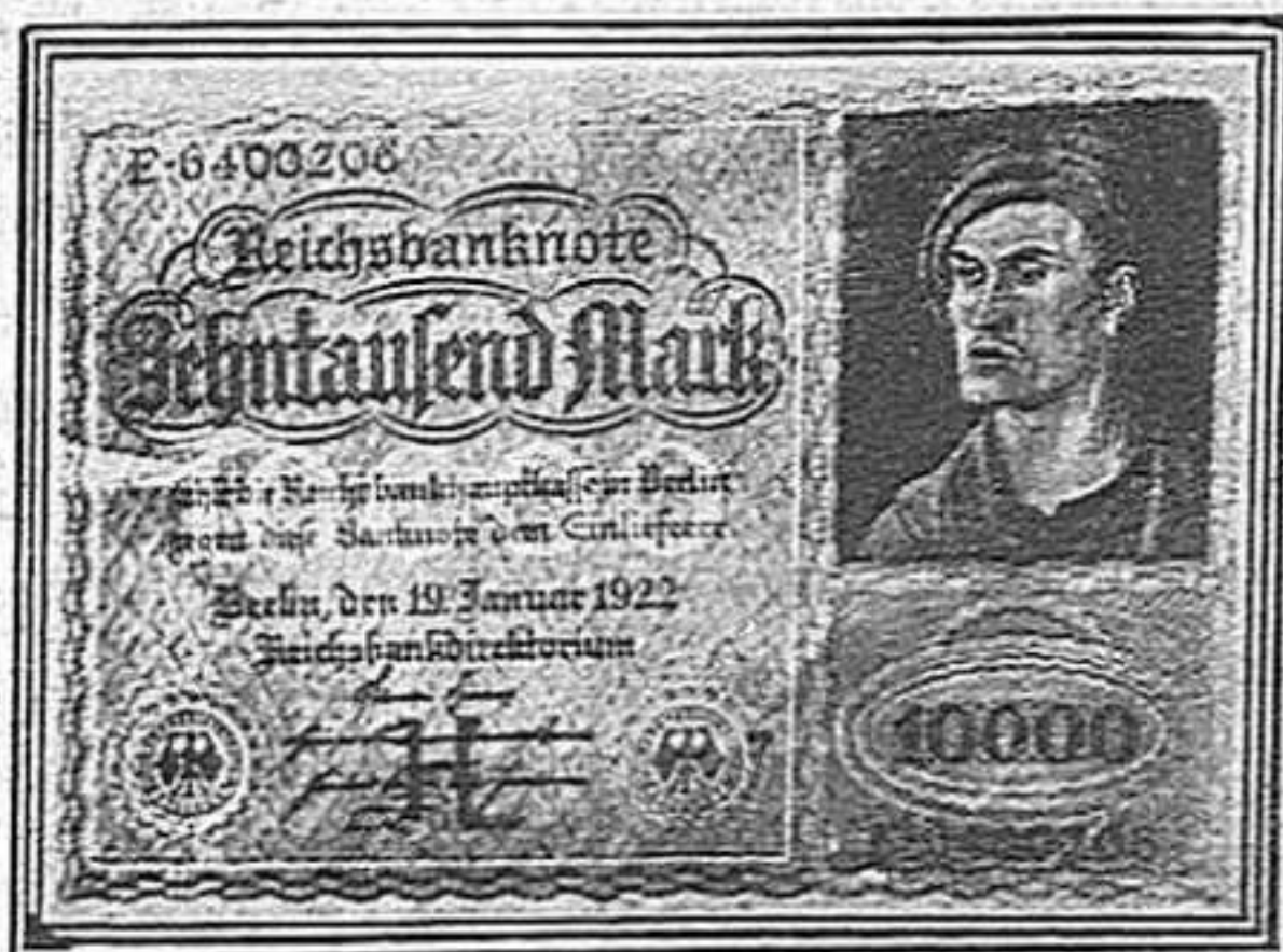
Un bitllet de Banc de la nova emissió que el poble alemany ha posat en circulació.

Encara ha fet més. Ha fet una mica de comèdia. Ha vist que la seva vesta era pobre, pobríssima, i en lloc de mostrar-la, se l'ha tret de sobre, ha dit que no en tenia cap, que ni vestida la volien deixar anar.