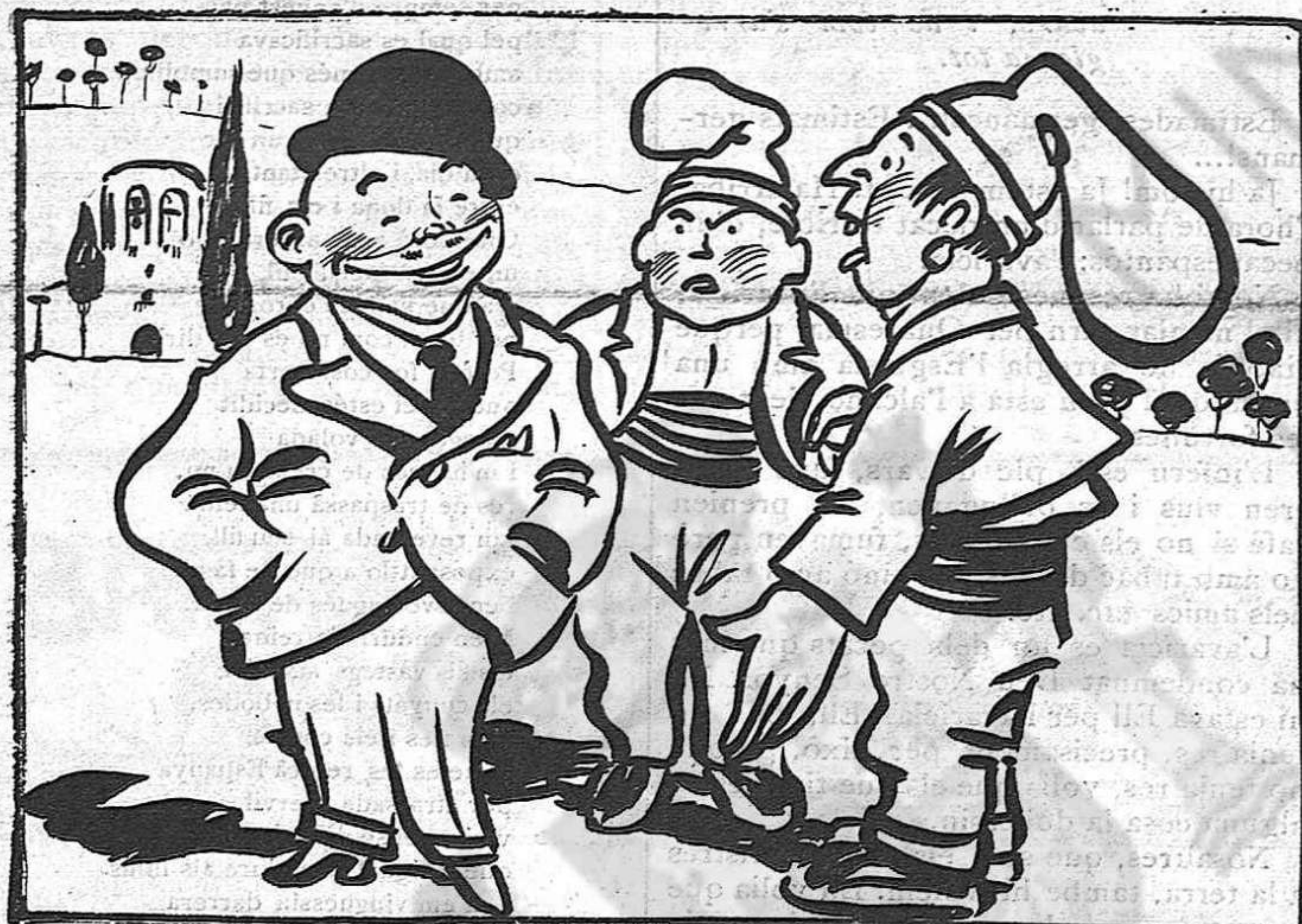
La pluja i les eleccions.—Ja que no ens podem vendre la collita, perquè no plou, ens vendrem el vot!