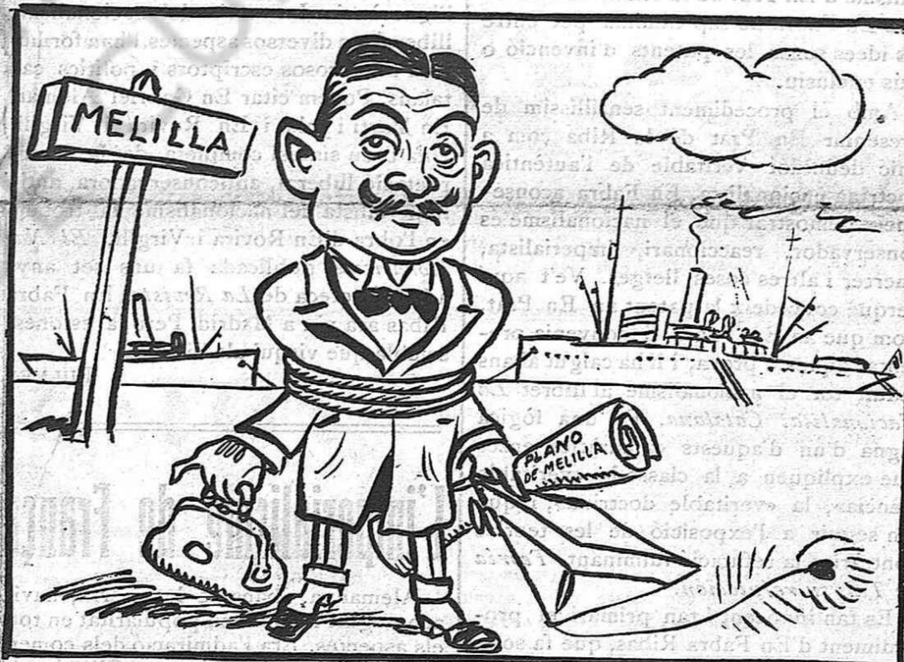
L'Alt Comissari.—Lligat com estic de peus i mans poca feina podré fer.