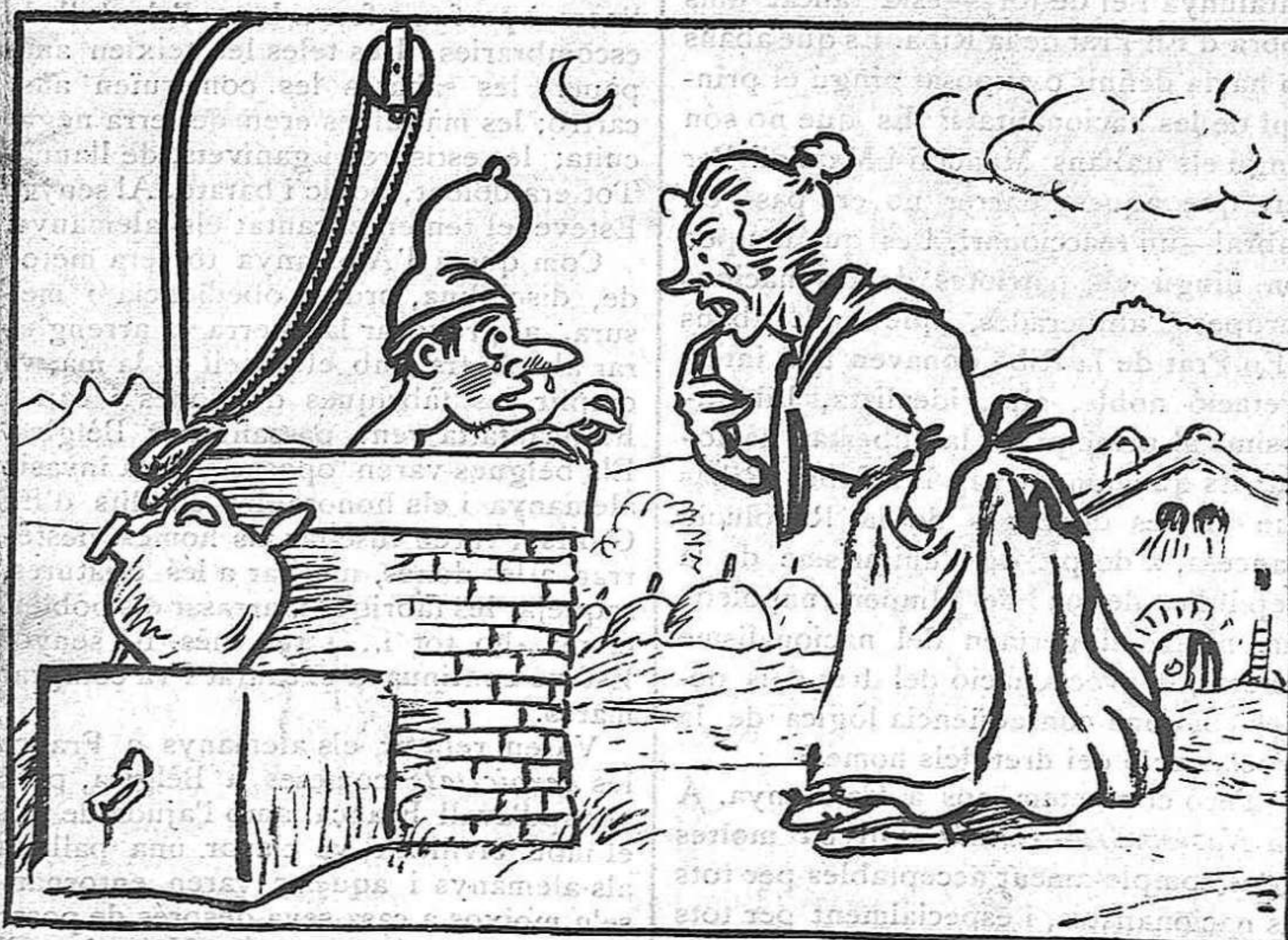
La veritat sortint del pou.—La veritat, Tuies, és que no hi ha gota d'aigua ni per remei.