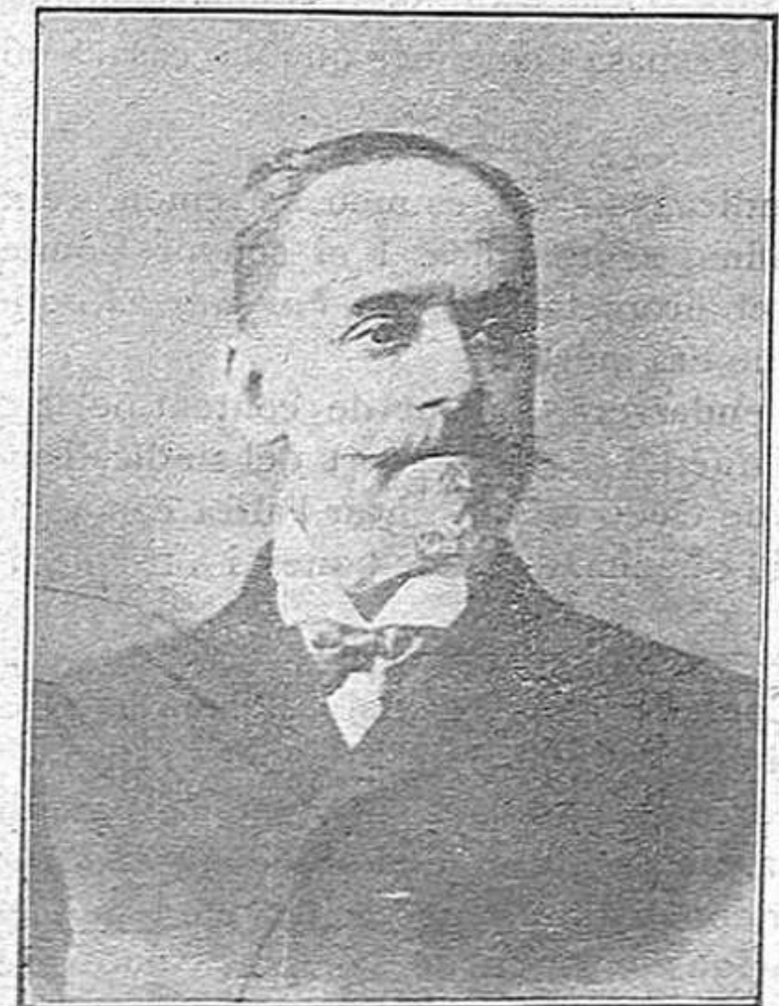
Don Miguel Villanueva el nou Alt Comissari del Marroc

—Està malalt, molt malalt. Imagini's tantes malalties com vulgui, les més afroses, totes les pot aplicar a l'Alt Comissari sense Alta Comissaria. No tingui por, no es queixarà. Hi ha malalties que valen més que certs disgustos.