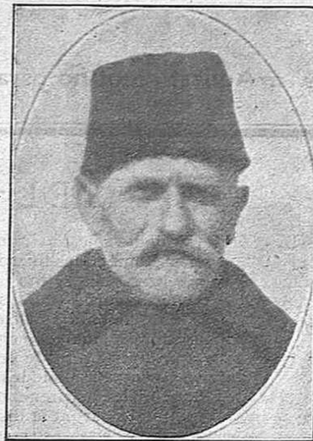
Stanislas Wojciechowski nou President de la República polaca

I encara, si bé es mira, la sotregada de la guerra no fou la més forta per Polònia; la que ho fou de debò, més per la seva gravetat per lo que signi-