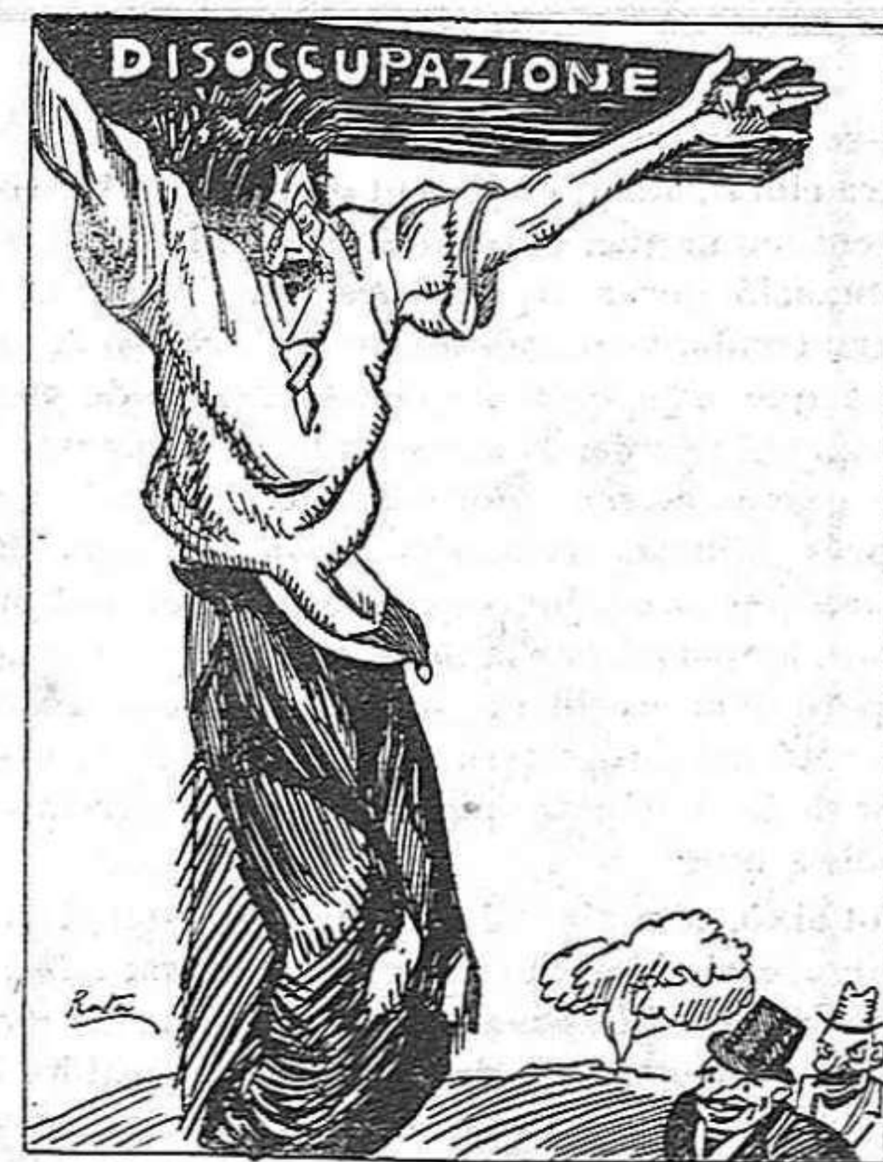
—I aquells senyors d'allà baix que durant la guerra m'havien promès el paradís! (De l'Asino)