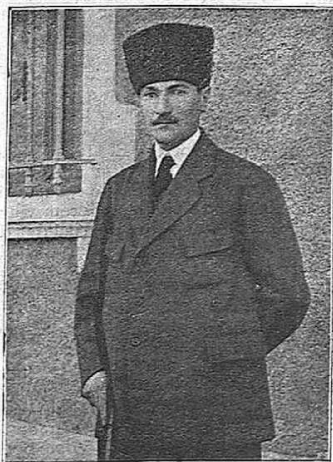
Mustafá-Kemal, quefe del Govern turc d'Angora i cap dels exercits victoriosos

Tot això hauran guanyat els moderns jueus.