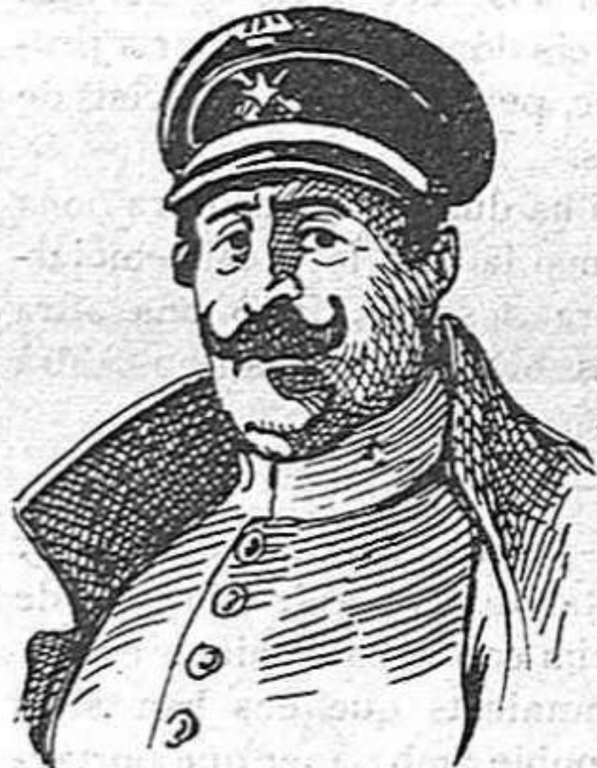
El general Burguete

França, la França que únicament és possible admirar i estimar, pot ésser per accident, reaccionària. Sempre, continuament, no. I presentim que si llurs directors s'entossudeixen en aquest sentit, acabaran malament.