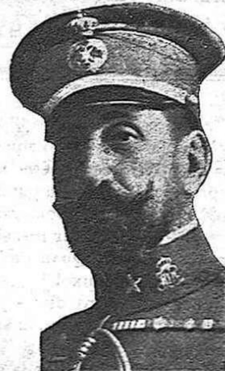
El general Navarro