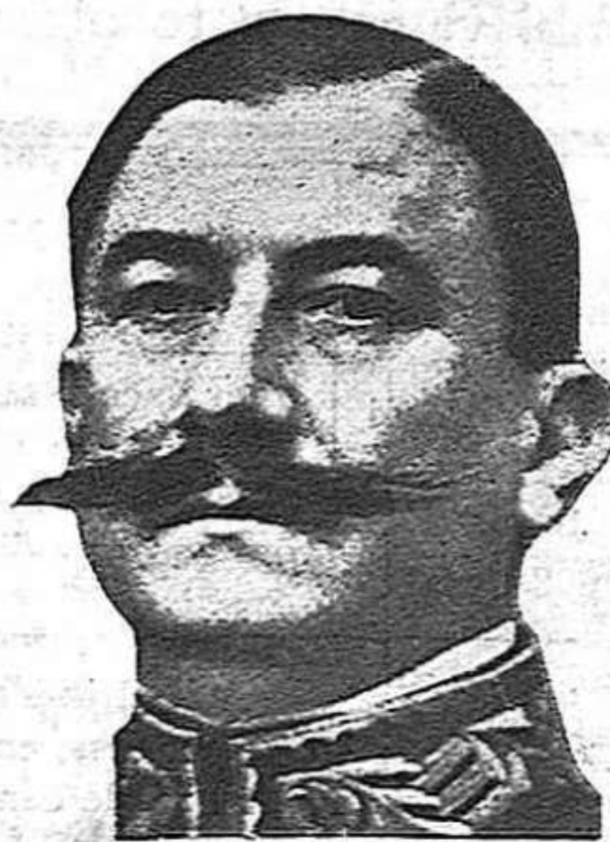
El general Berenguer