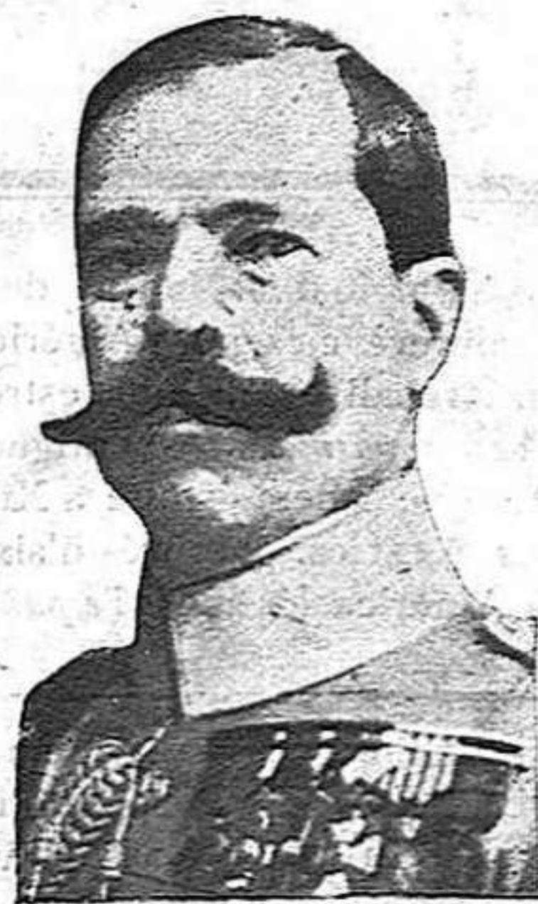
El general Silvestre