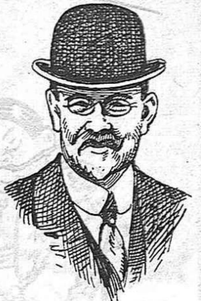
El nou prefecte de policia de París, que ha sigut objecte d'un atemptat