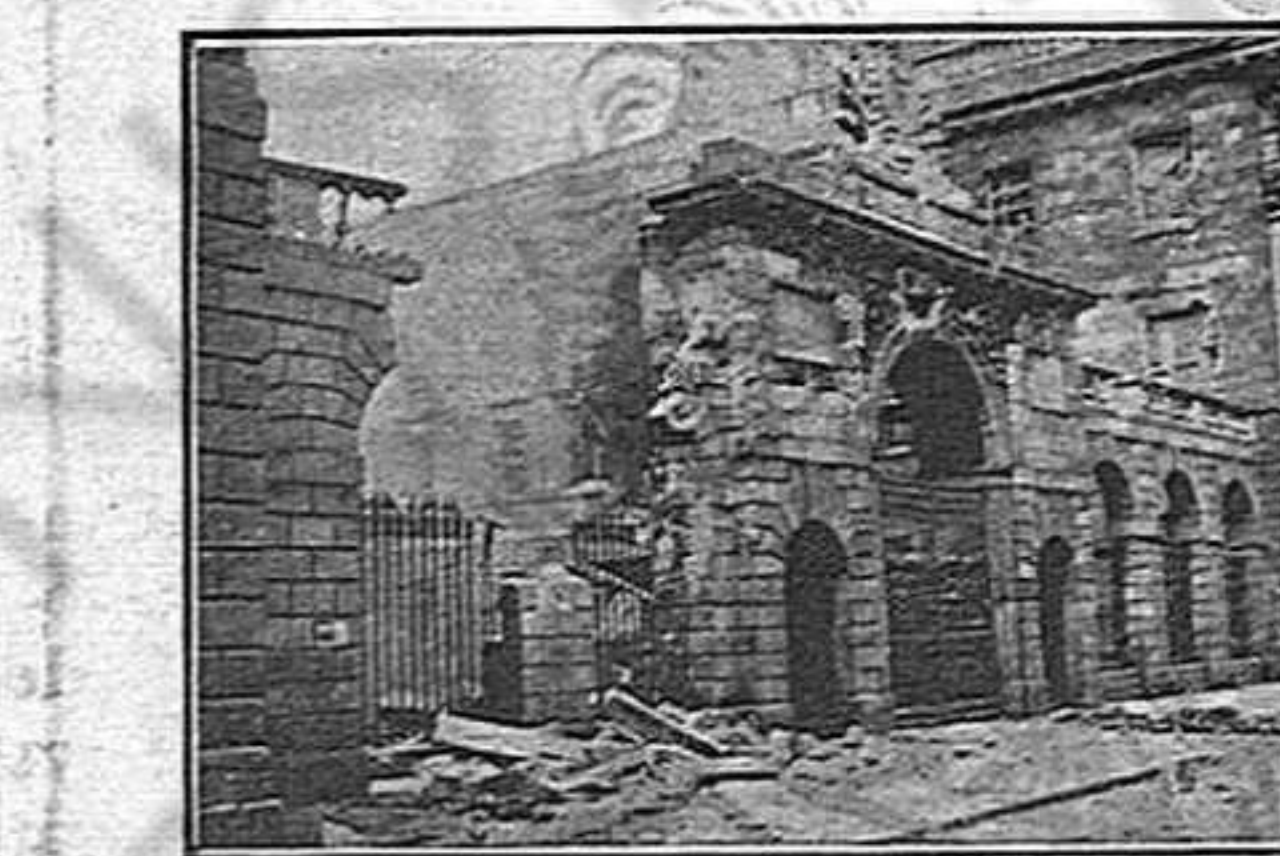
Un altre tros destruït de lala esquerra del Palau de Justícia.—Aquesta portalada ha sigut molt perjudicada pel bombardeig. Està situada a l'esquerra del riu, enfront del edifici nomenat Quatre Tribunals.

única manera d'ésser digna la perseverància i també la única de nomenar-se santa.