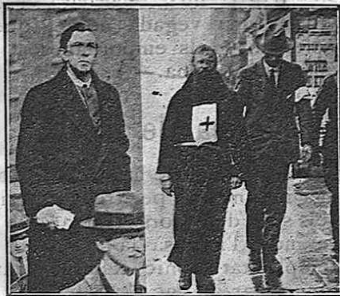
General Rory O'Connor i el Gornia Dominic, capturats.—O'Connor, l'extremista republicà, tenia el càrrec de general en cap, dins l'exèrcit de la lliure Irlanda. El Pare Dominic fotografat després de son arrest. Era dins el destacament que ocupava l'edifici dels Quatre Tribunals, com un senzill Creu Roja dels rebels.

Concessions com la feta al poble irlandès poden fer-se inclús, perquè no dir-ho, a Catalunya, poden fer-se a nosaltres que per més que hagim sofert no hem acabat encara de conrear-se la santa perseverància amb les armes a les mans,