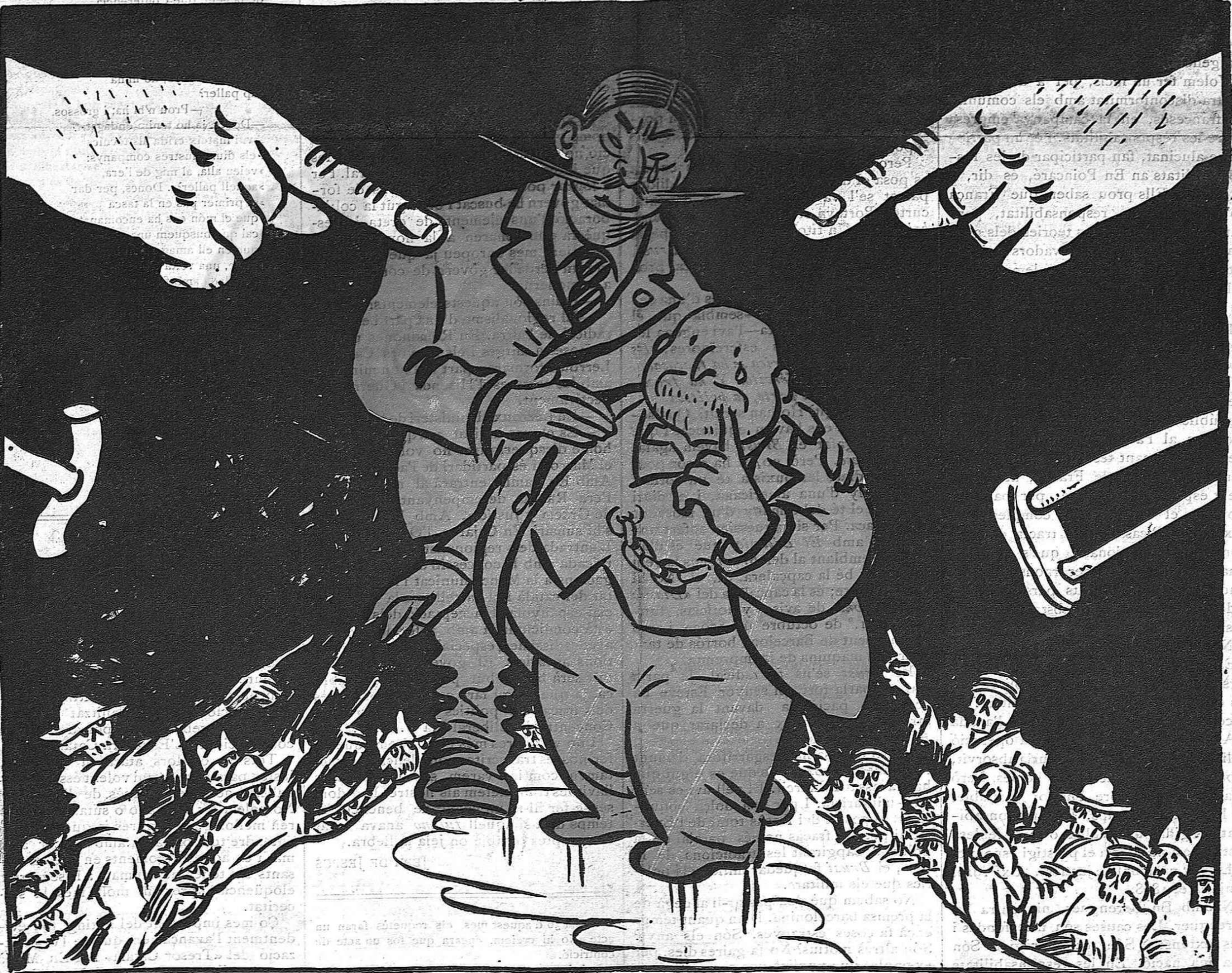
Són tants que posarien el dit a la llaga!