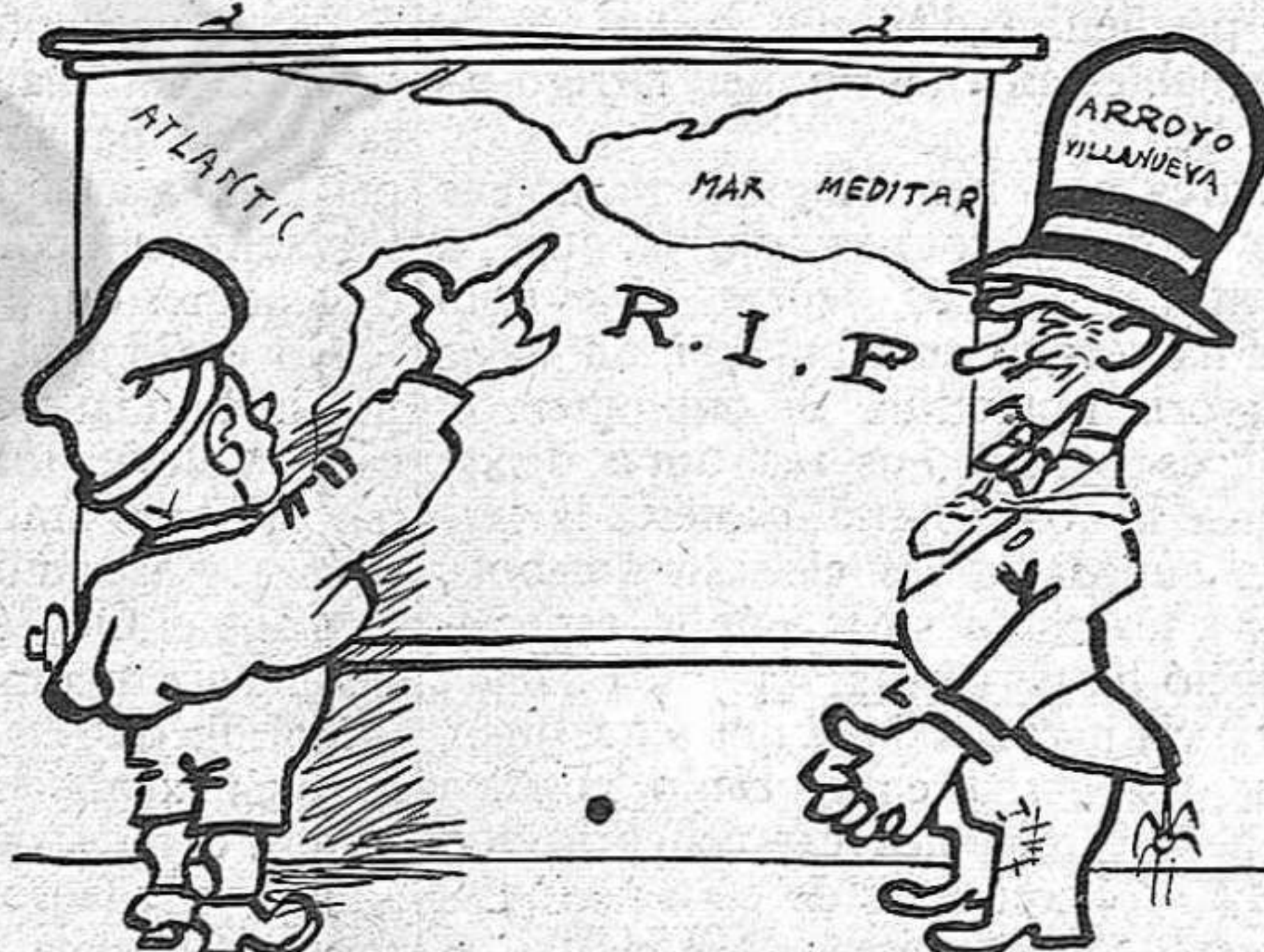
—Por el Sur con la guerra de Marruecos.