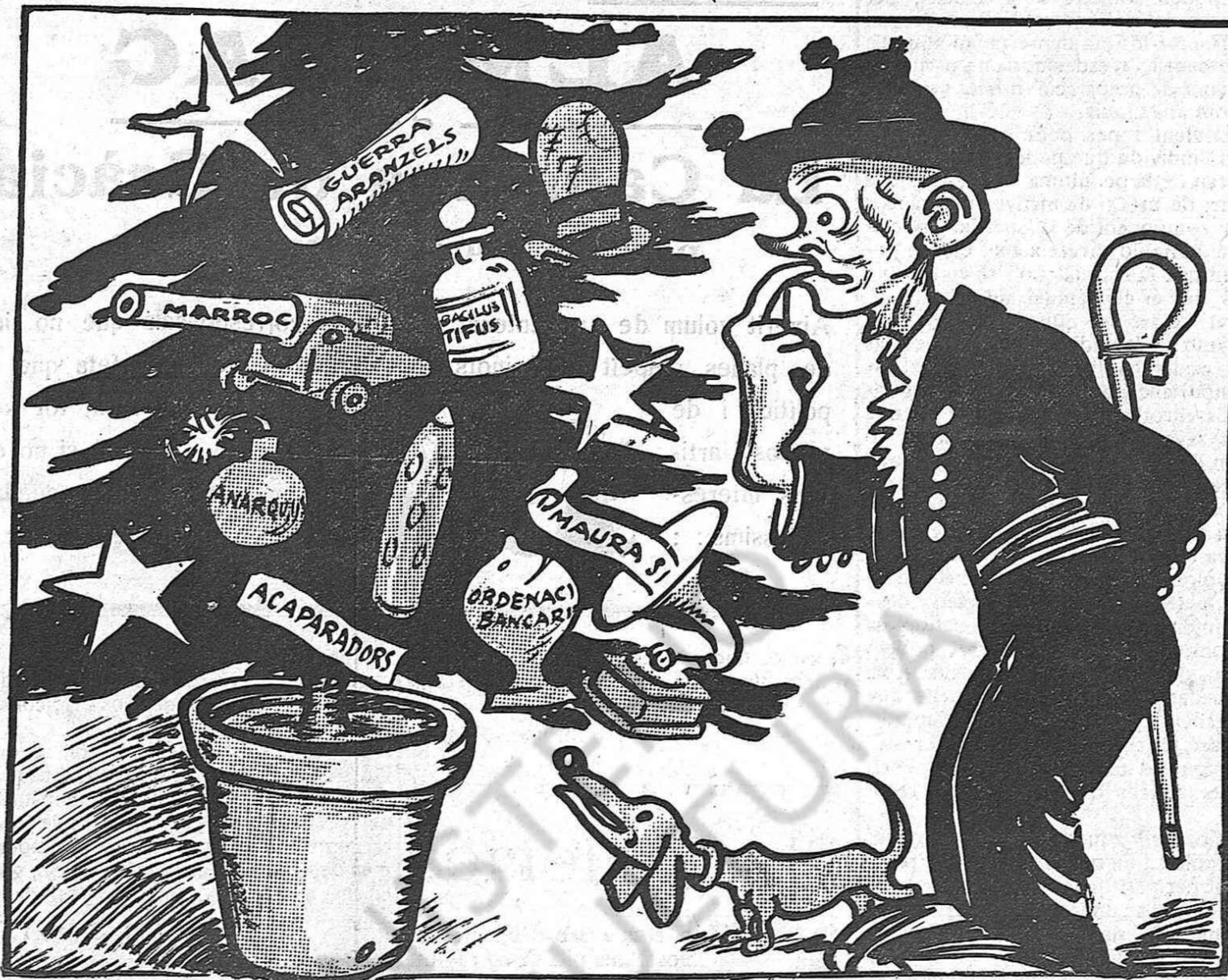
—Caral que't fum! .. Això sí que no és pas la festa de l'arbre!...