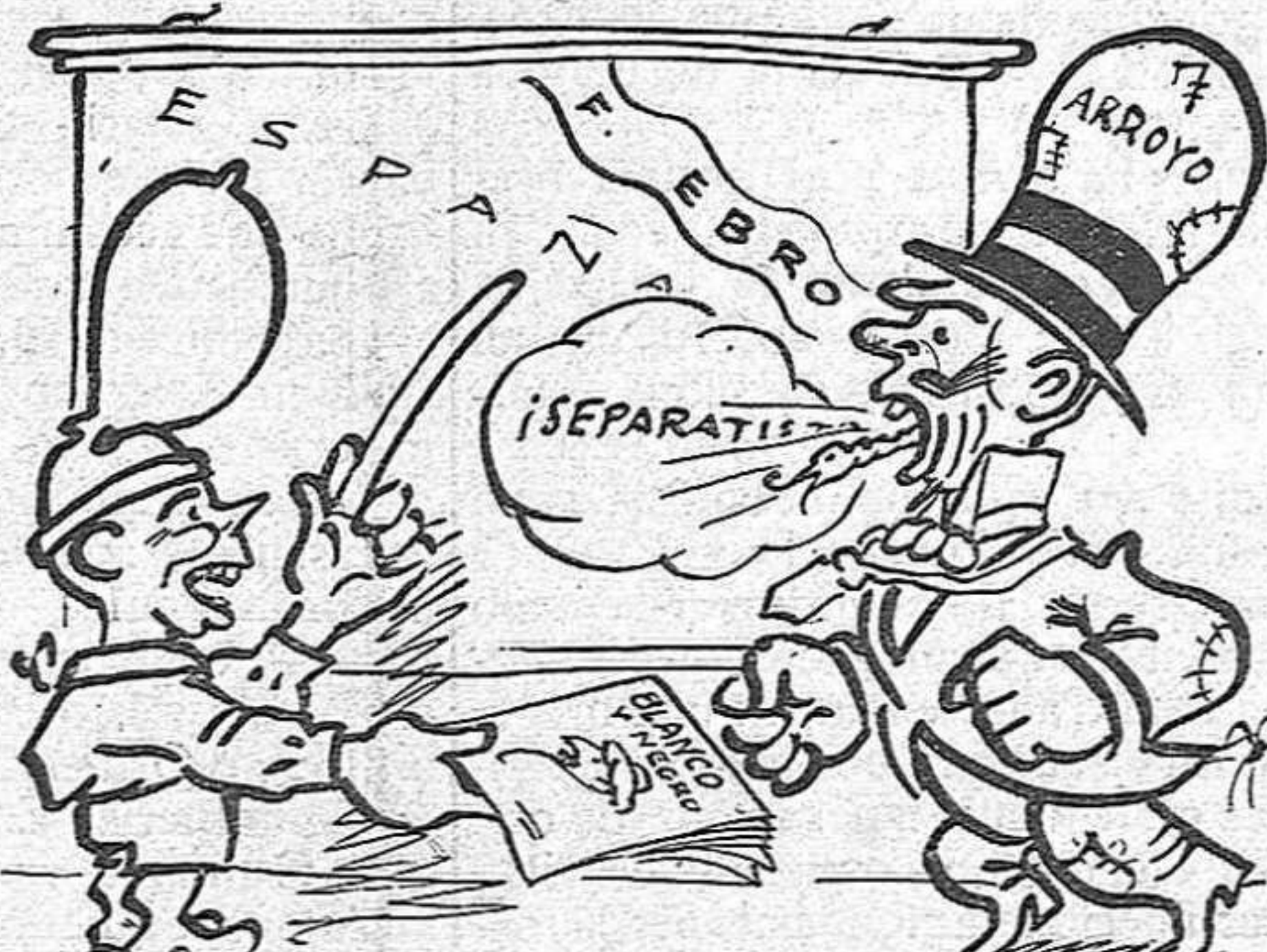
—Y por el Este con el nacionalismo catalán.