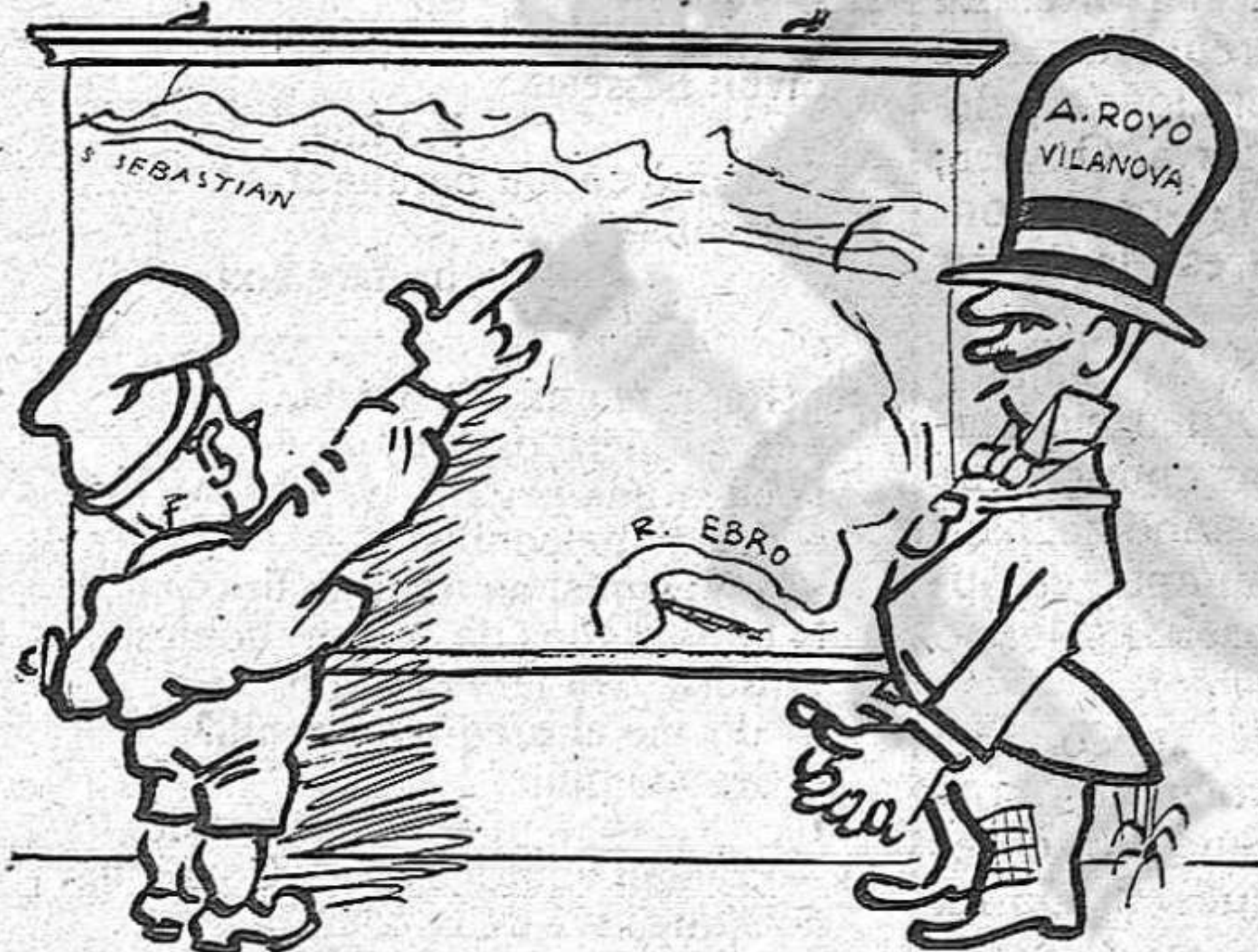
—Por el Norte con la guerra de tarifas de Francia.

(Paròdia d'un dibuix publicat en el darrer número de Blanco y Negro)