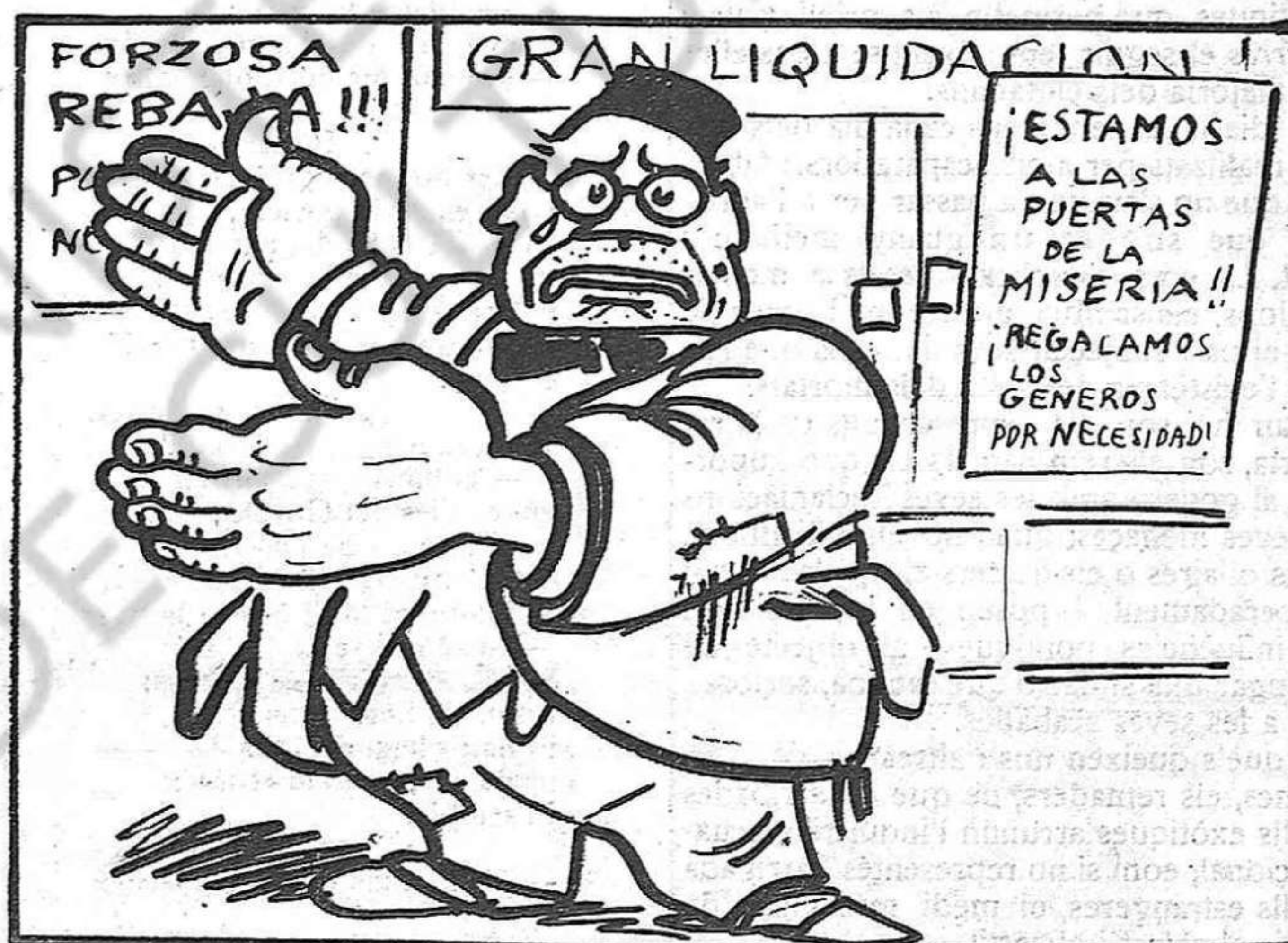
Els que dejunen ara

Ara resulta que el famós pensador rus Kropotkin no és mort; que la notícia degué ésser framesa per gent que voldria veure'l set pams sota terra.