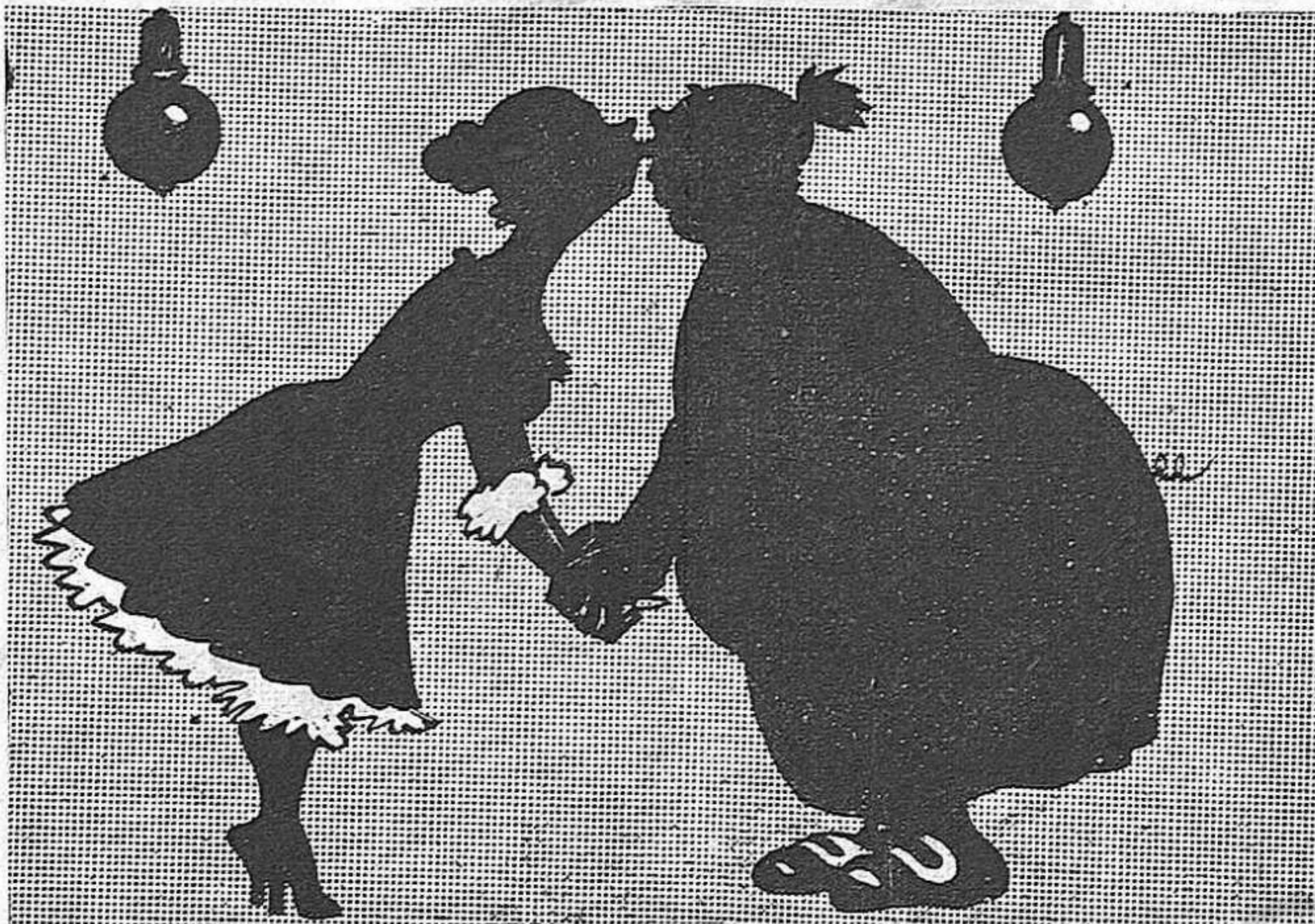
—Ai Toneta meval... Que dolça seria la vida amb vaga permanent d'electricistes.

que don Alba és el millor dels governants, no volgué de cap de les maneres prescindir del coix, ni deixar que ens quedessim sense pressupostos, aquests pressupostos.