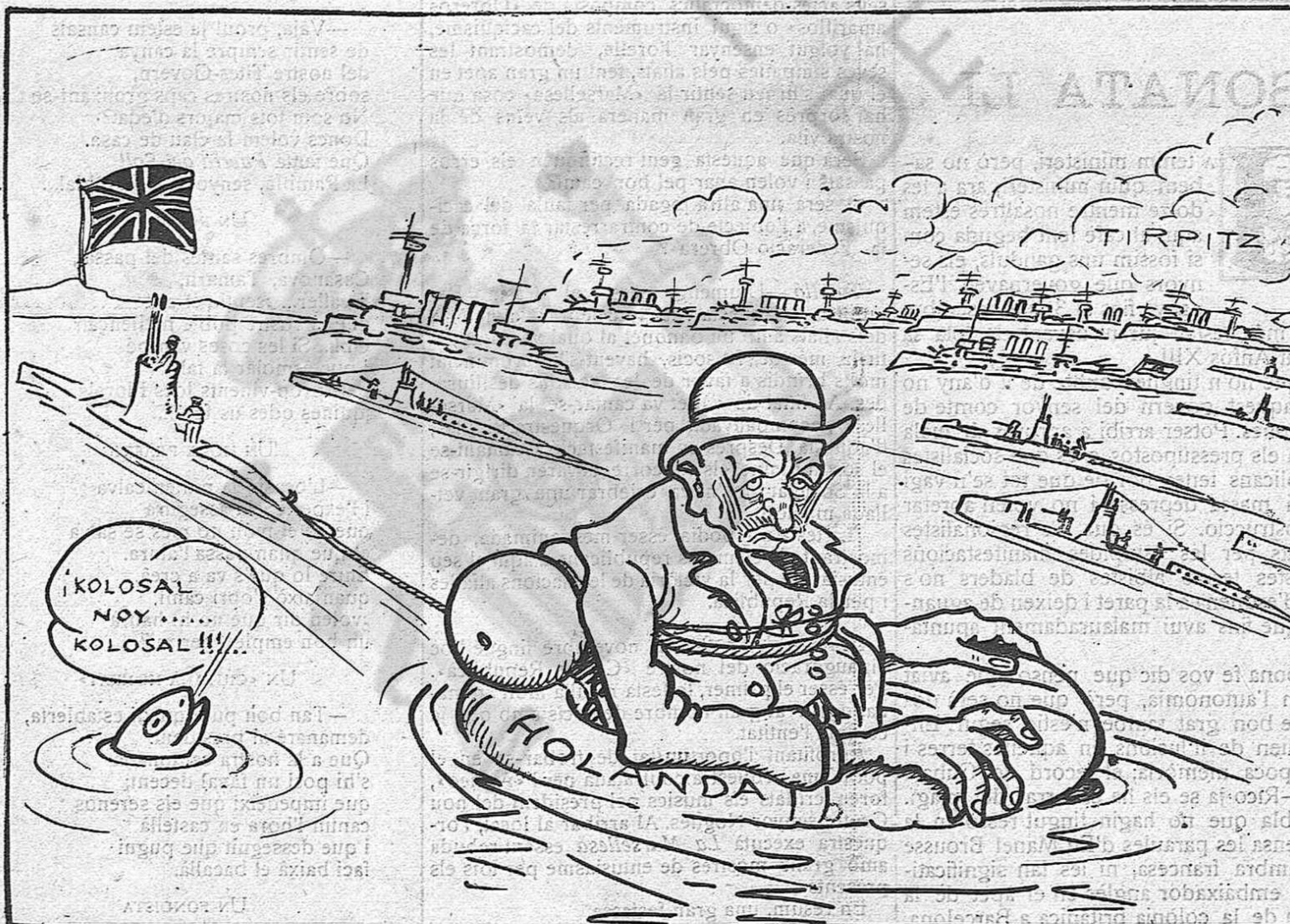
—Pensar que disposava de unes esquadres tant famoses!... i ara sort tinc del salva-vides!...