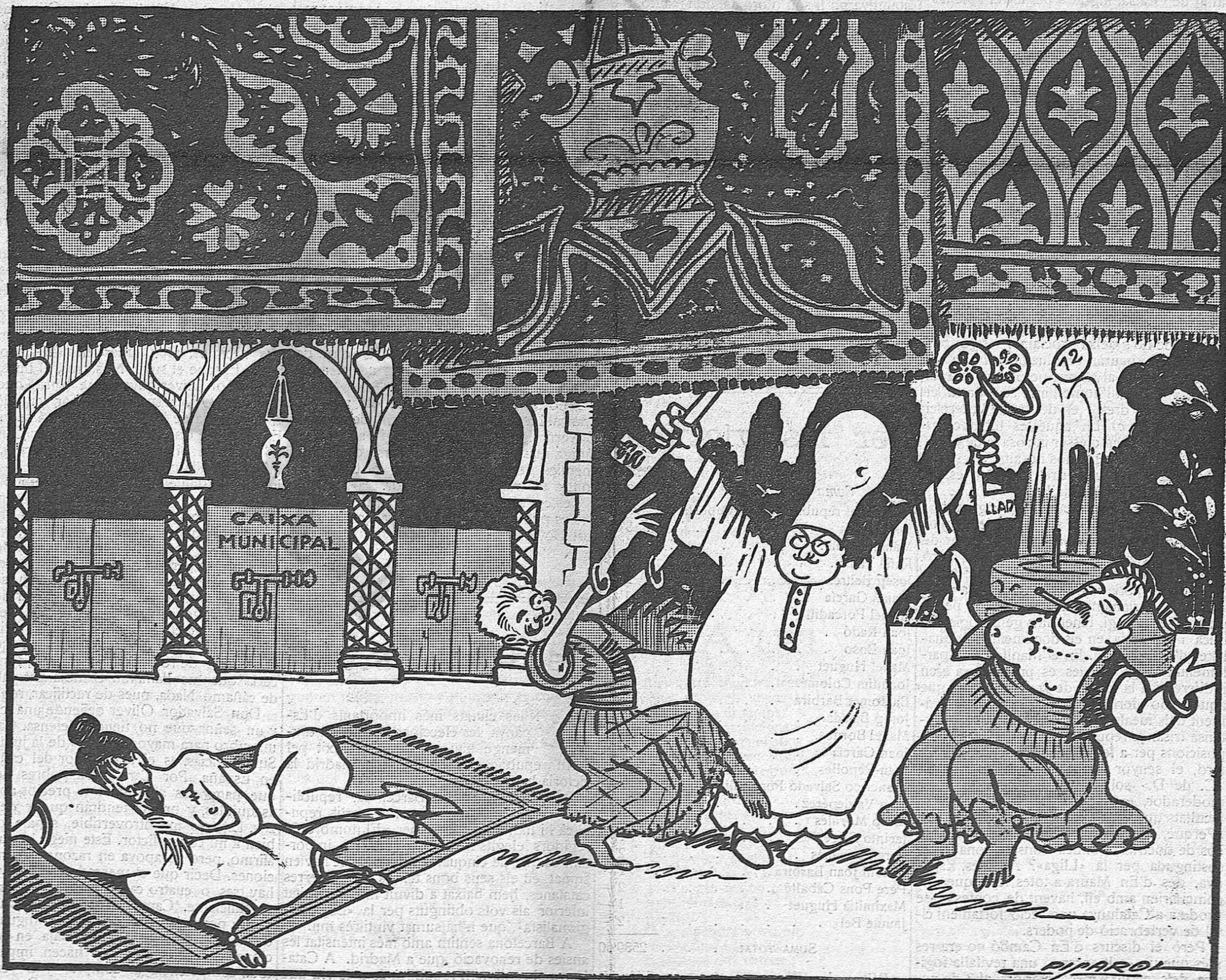
Una de les escenes culminants de "Scheherazade"