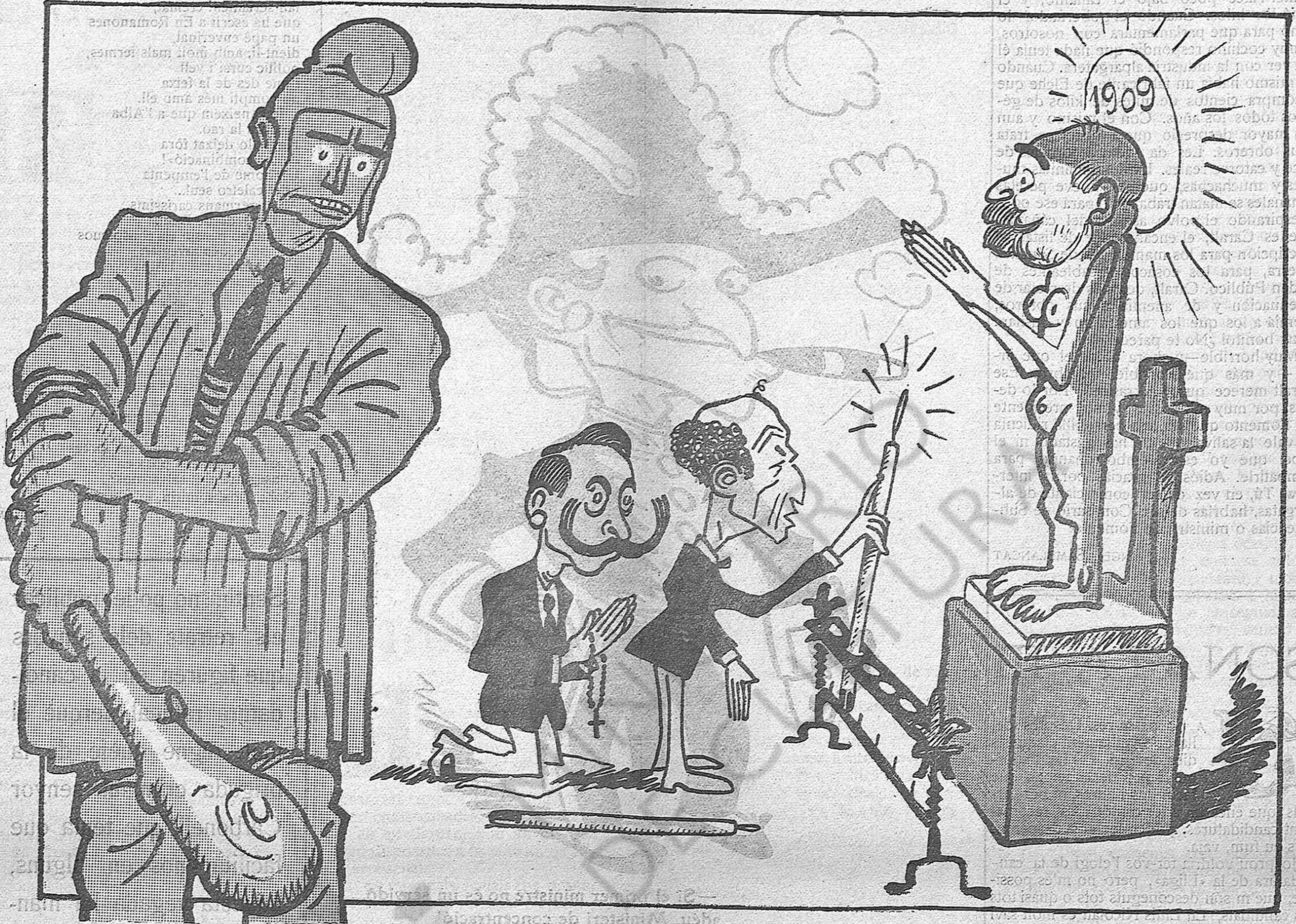
—Al tanto, eh?... que si el carro de l'Assemblea rodés per mals camins, no us hi valdrien ventoses.

un torpeder alemany i dos transports que anaven amb ell. Al mar Negre, un submarí rus ha tirat a fons un torpeder turc.