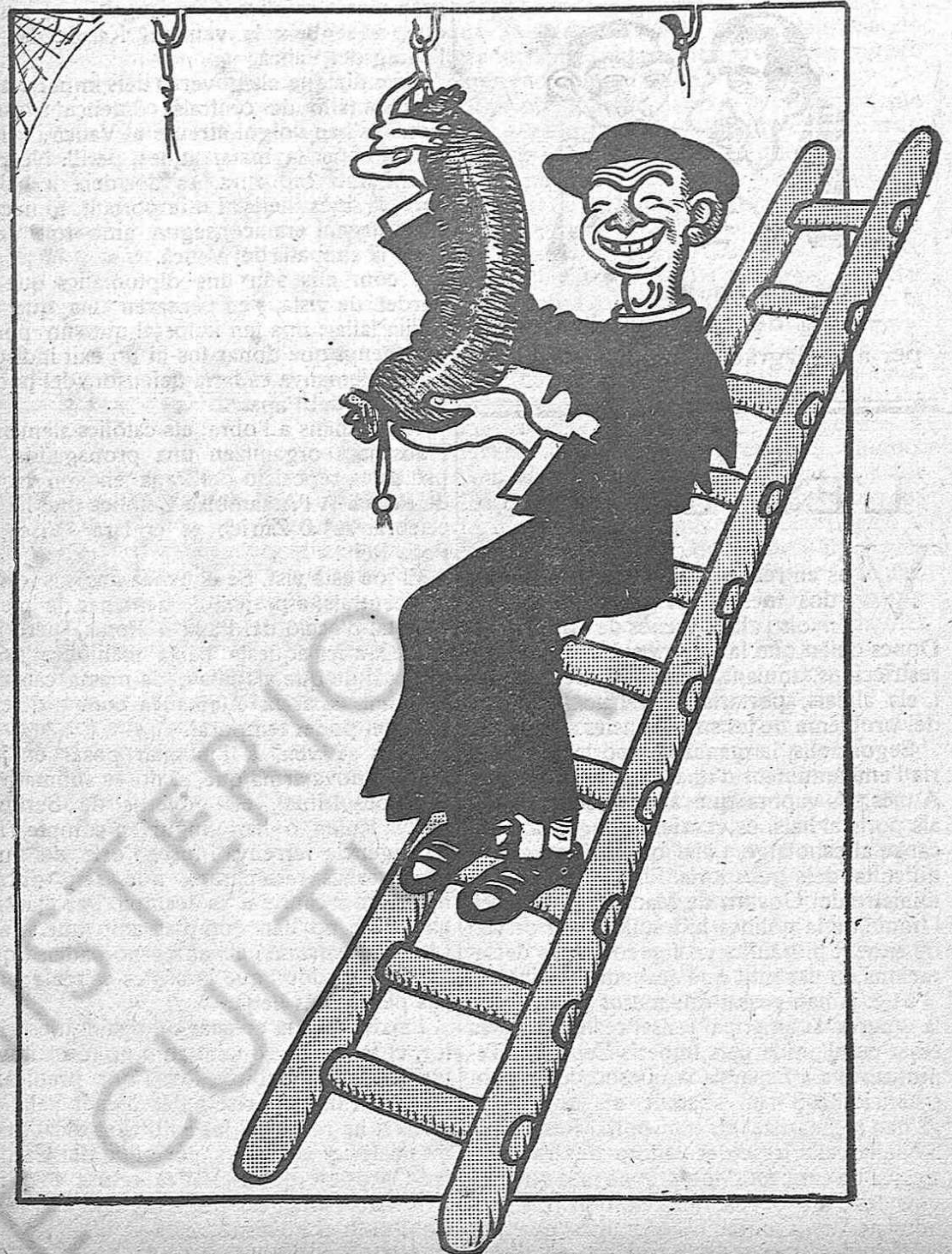
Un capellà penjant un bisbe

Sobre tot, ara, en vigília de vaga revolucionaria.