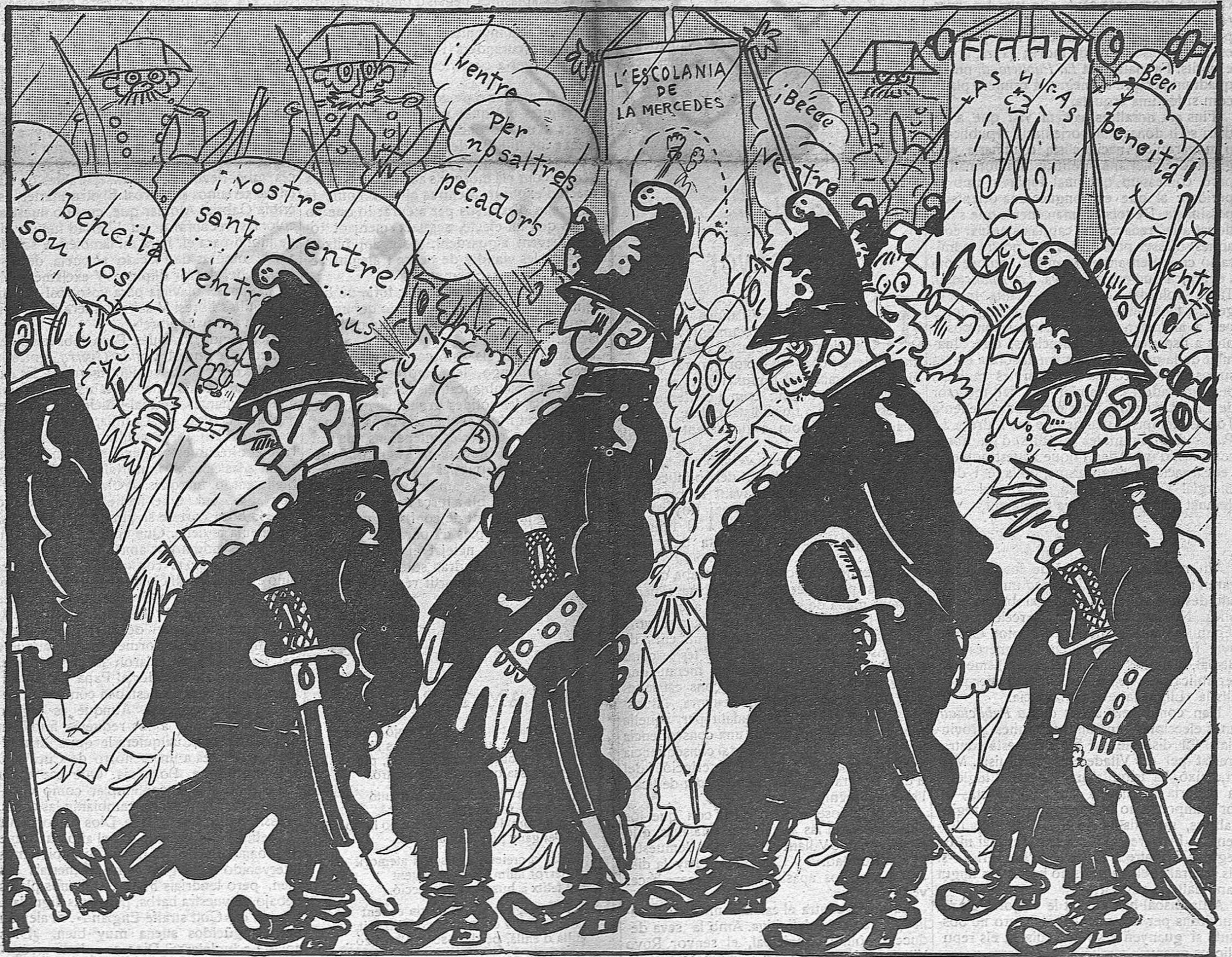
Darrer número de les missions: La processó del diumenge