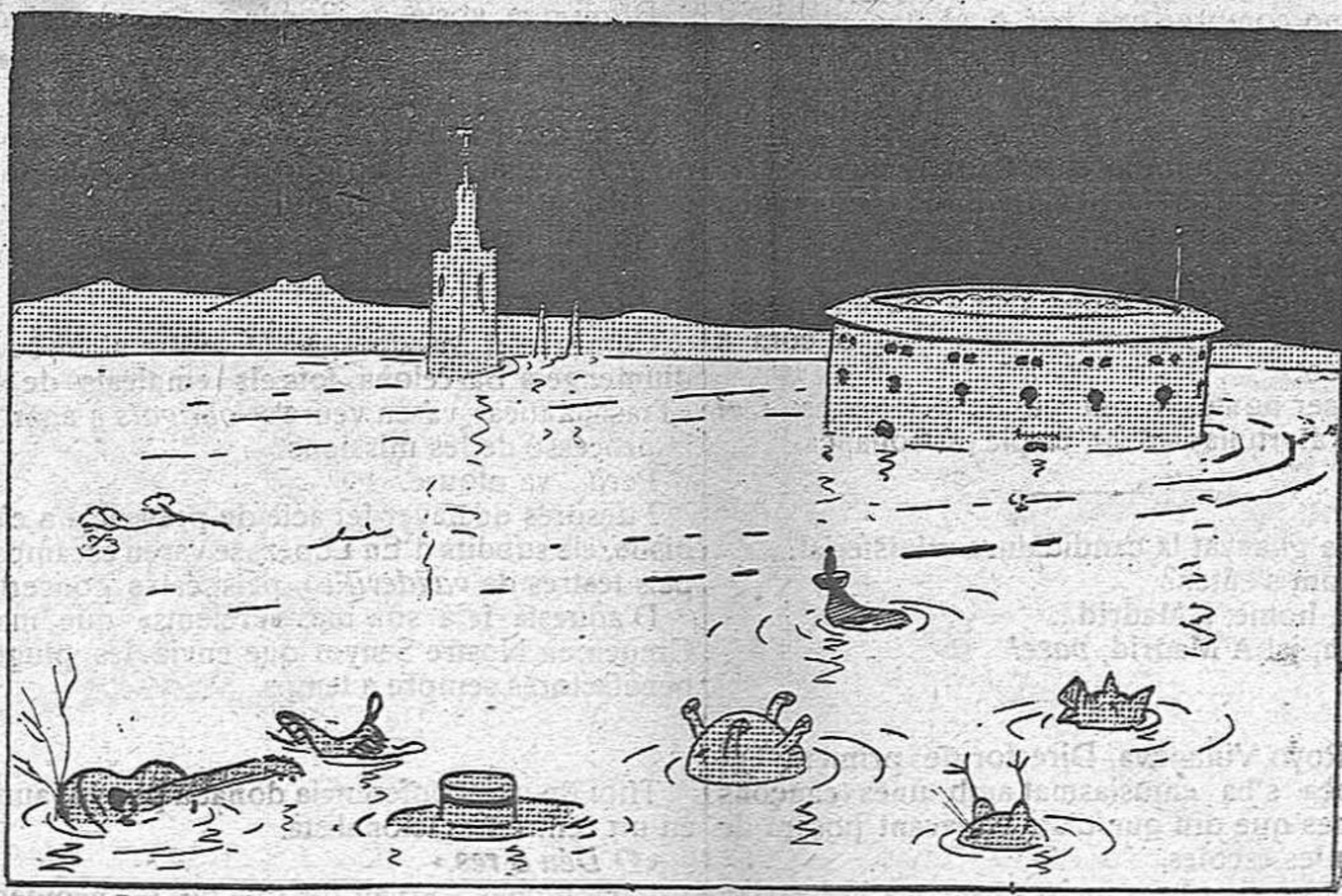
La segona batalla del "Guadalete"