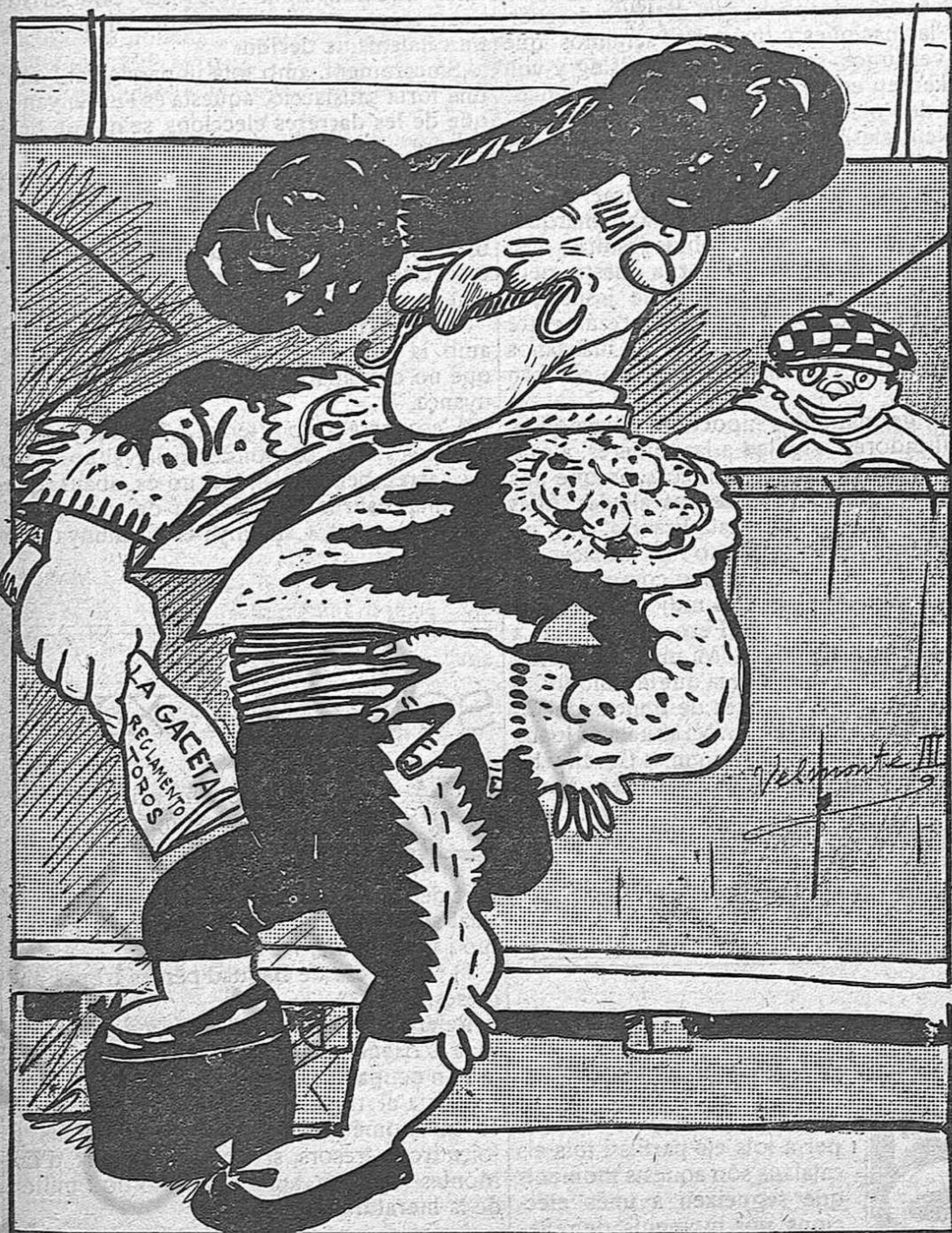
Belmonte III.— Y, ahora que está aprobao,... que sarga la fierá!...

pagne, inclòs l'altura 185, tan disputada. Entre francesos i anglesos han fet un miler de presoners alemanys.