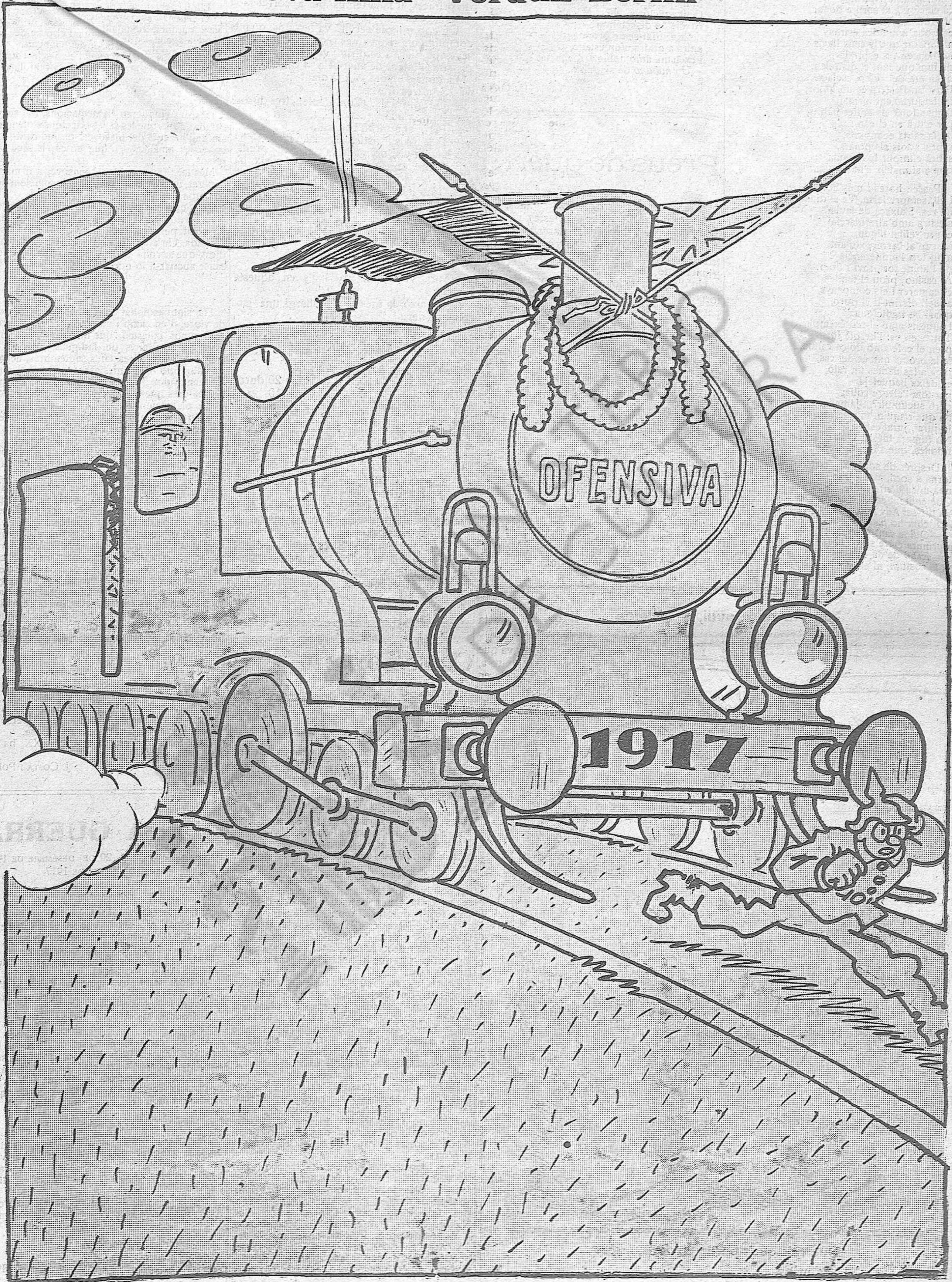
La màquina de un trén ràpid-exprés a punt de sortir