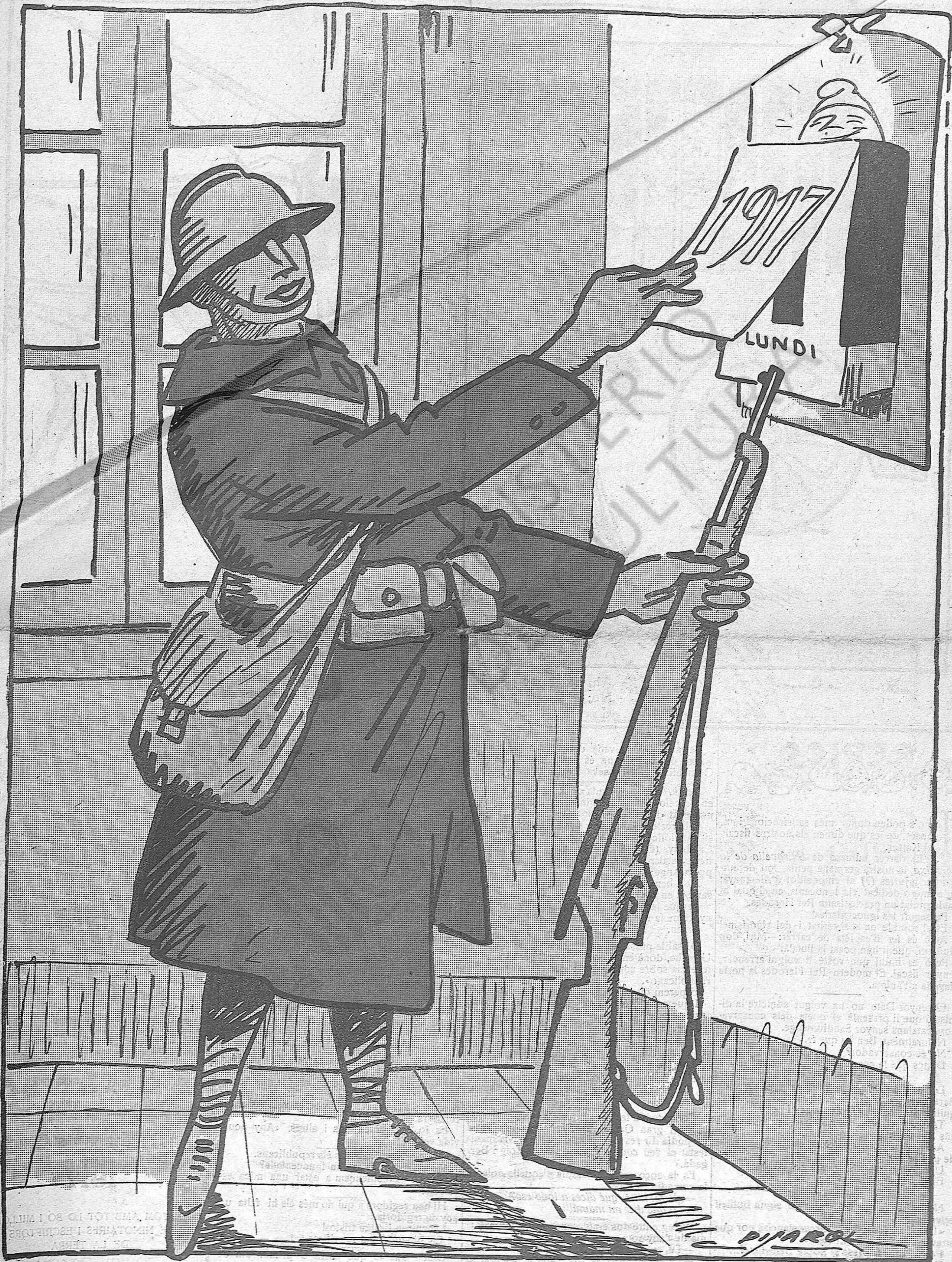
—No sé perquè'l cor me diu que aquest serà l'any de la victòria final.