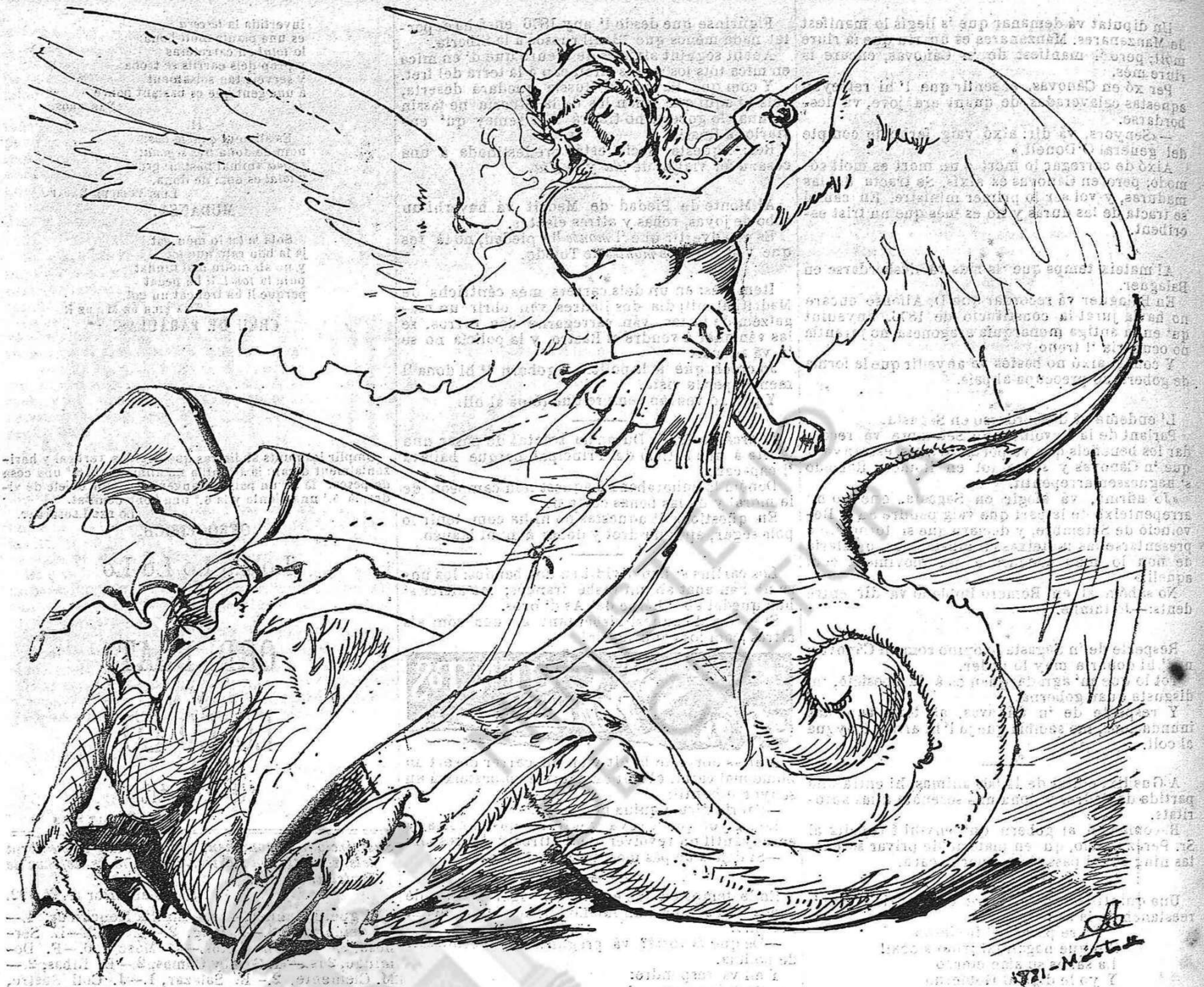
Y ab la major facilitat, vencent la reacciò, ella s' ha sabut desfer del seu mónstruo.