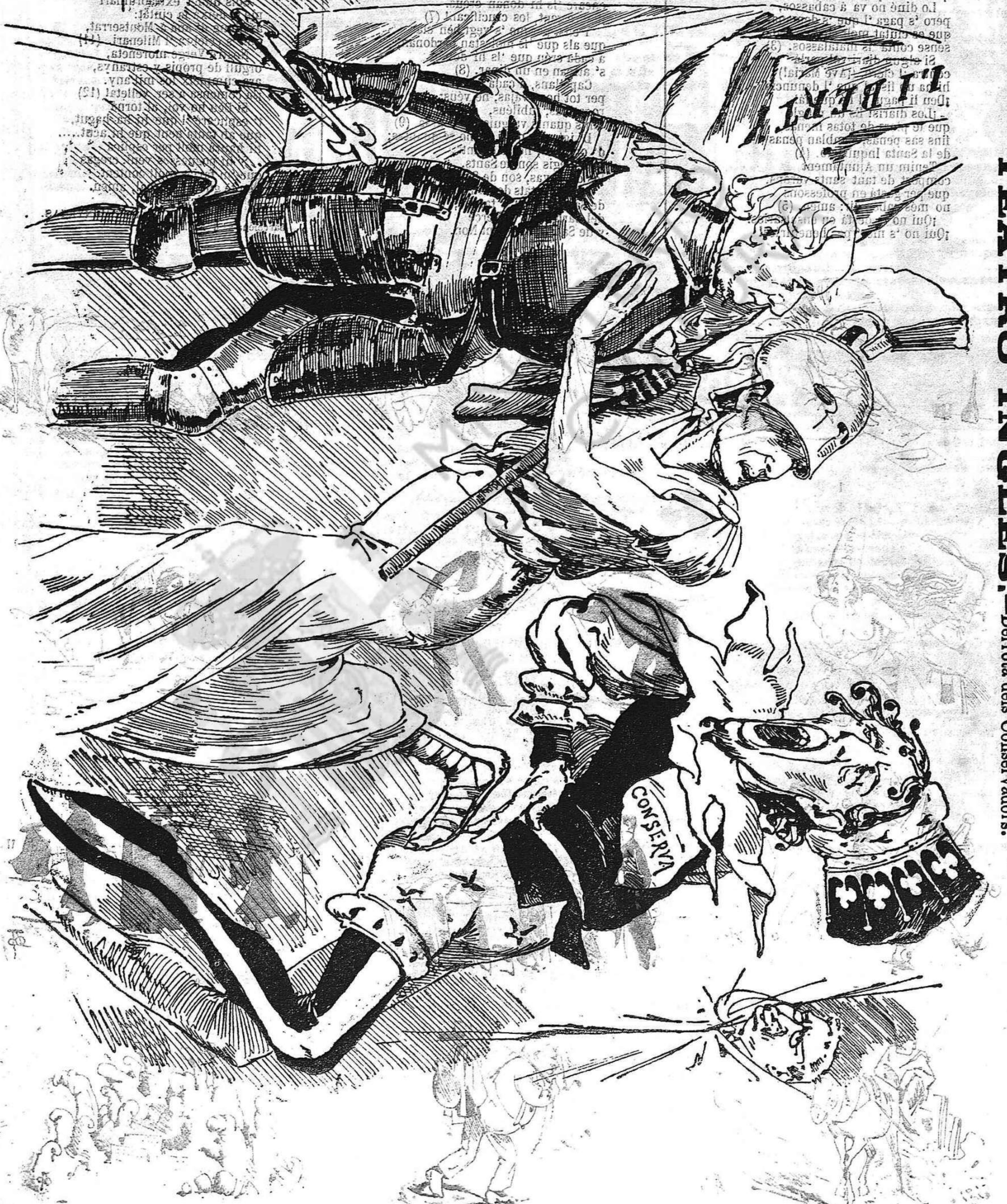
TEATRO INGLÉS.—Derrota dels Conservadors.