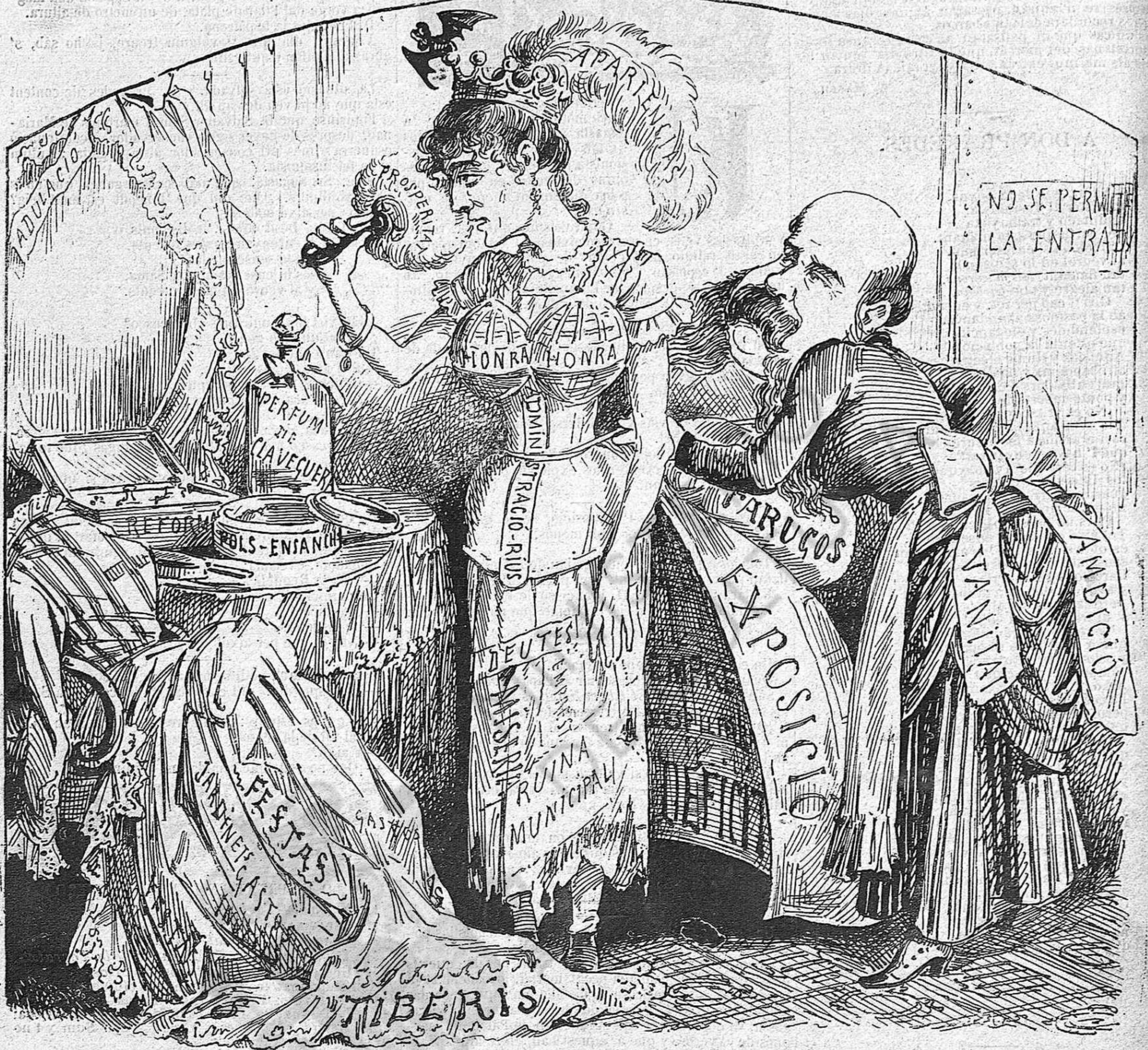
L' arcalde la va cubrint ab flors y adornos en gran, per taparli la miseria que avuy se la está menjant.