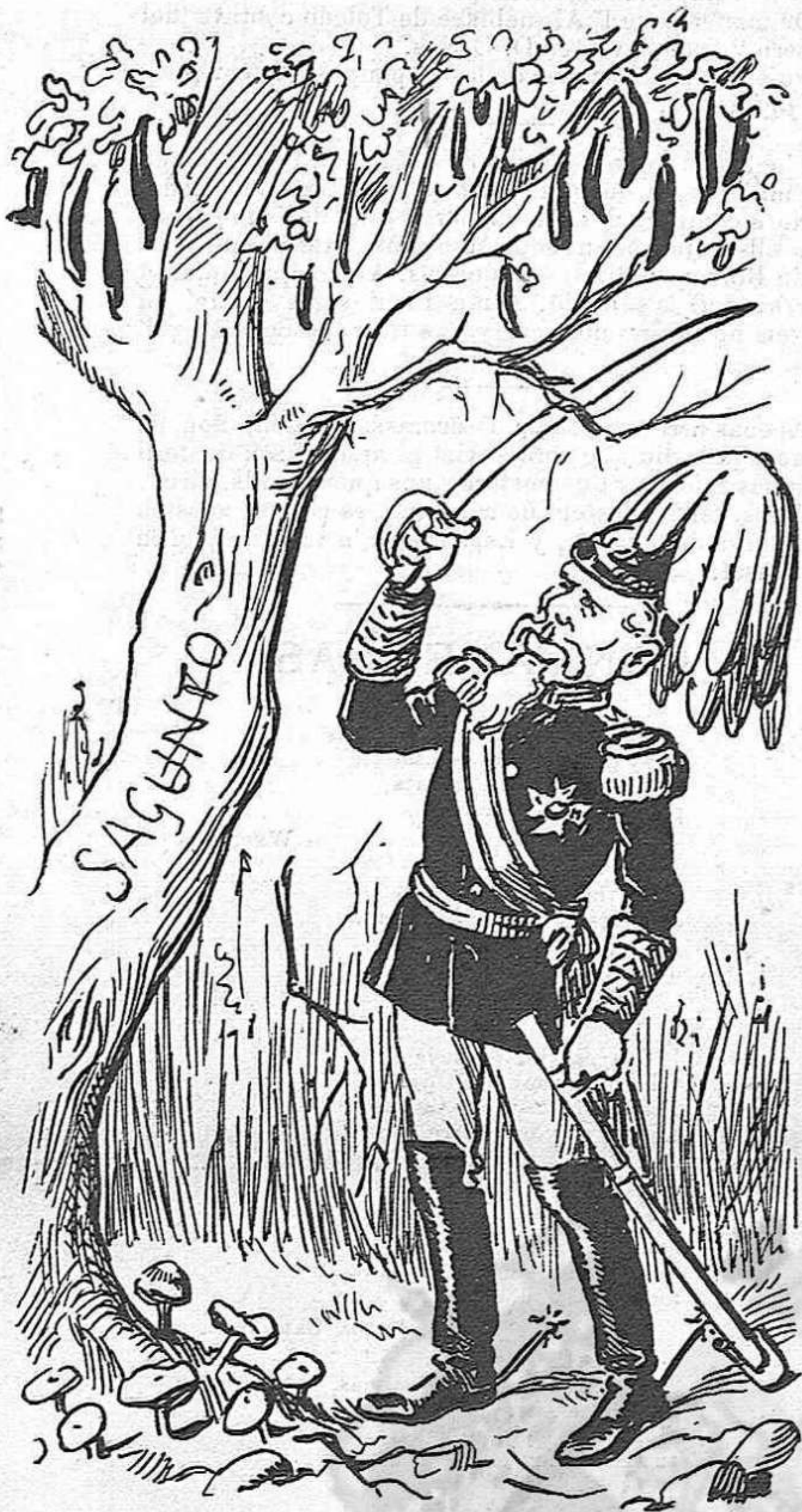
—Si senyó; 'l que va plantarlo, s' ha de cuydar d' espurgarlo.