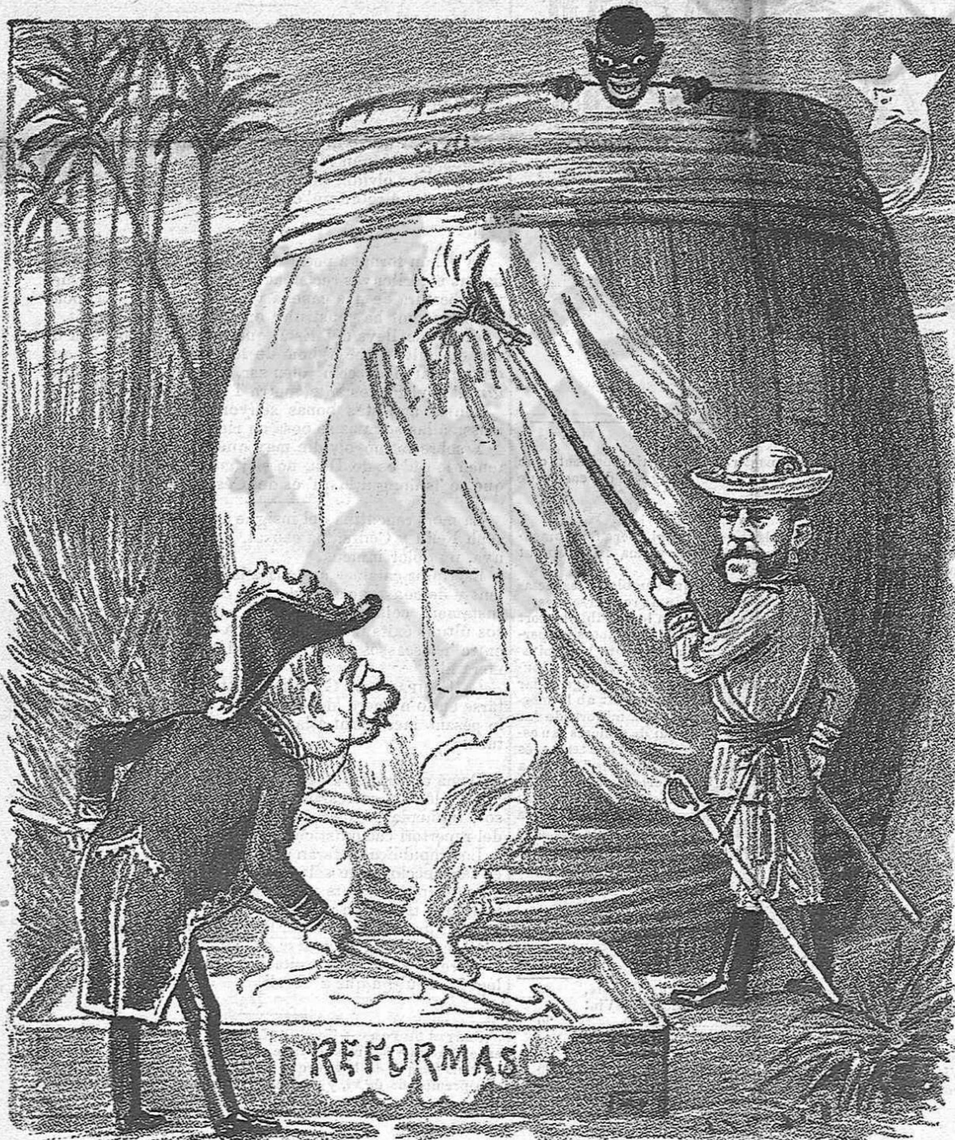
Fer mes que l'emblanquinin, tart ó d'hora tornarà á posarse negra.