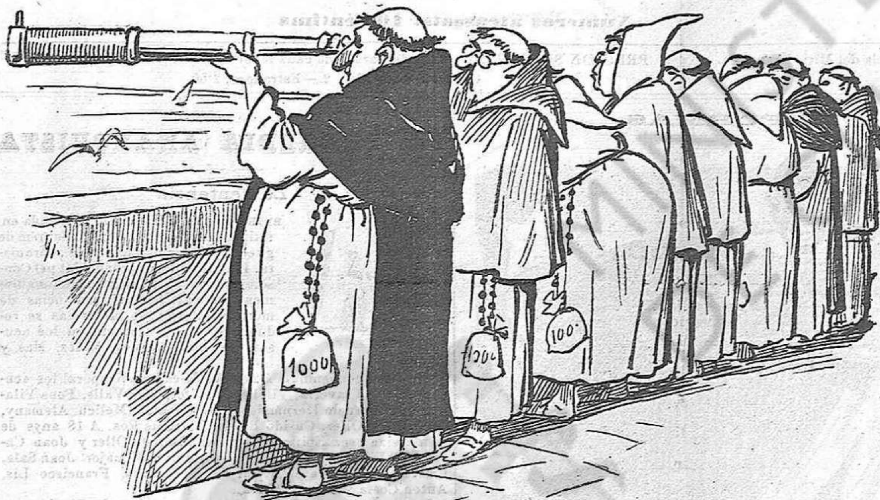
Esperant que arribi per veure com está del fetje.

Desde la una de la matinata s' observá per la Rambla un moviment inusitat en semblants horas, que aná creixent, á mida que transcurrian las horas. Eran moltas las personas que s' disposavan á trasladarse á la vehina montanya á presenciari l' acte tremendo de la justicia humana. Contribuí á excitar l' interés y á avivar la curiositat del públich lo moviment de tropas que ab alguns intervals s' encaminavan á Montjuich. Soldats de infanteria y de caballeria, numerosas forsas de la guardia-civil y tota la policia de Barcelona prengueren militarment la montanya, se destacaren en tots los camins y avingudas, y trassaren en certa manera l' camí que havia d' recorre la multitud dels curiosos.