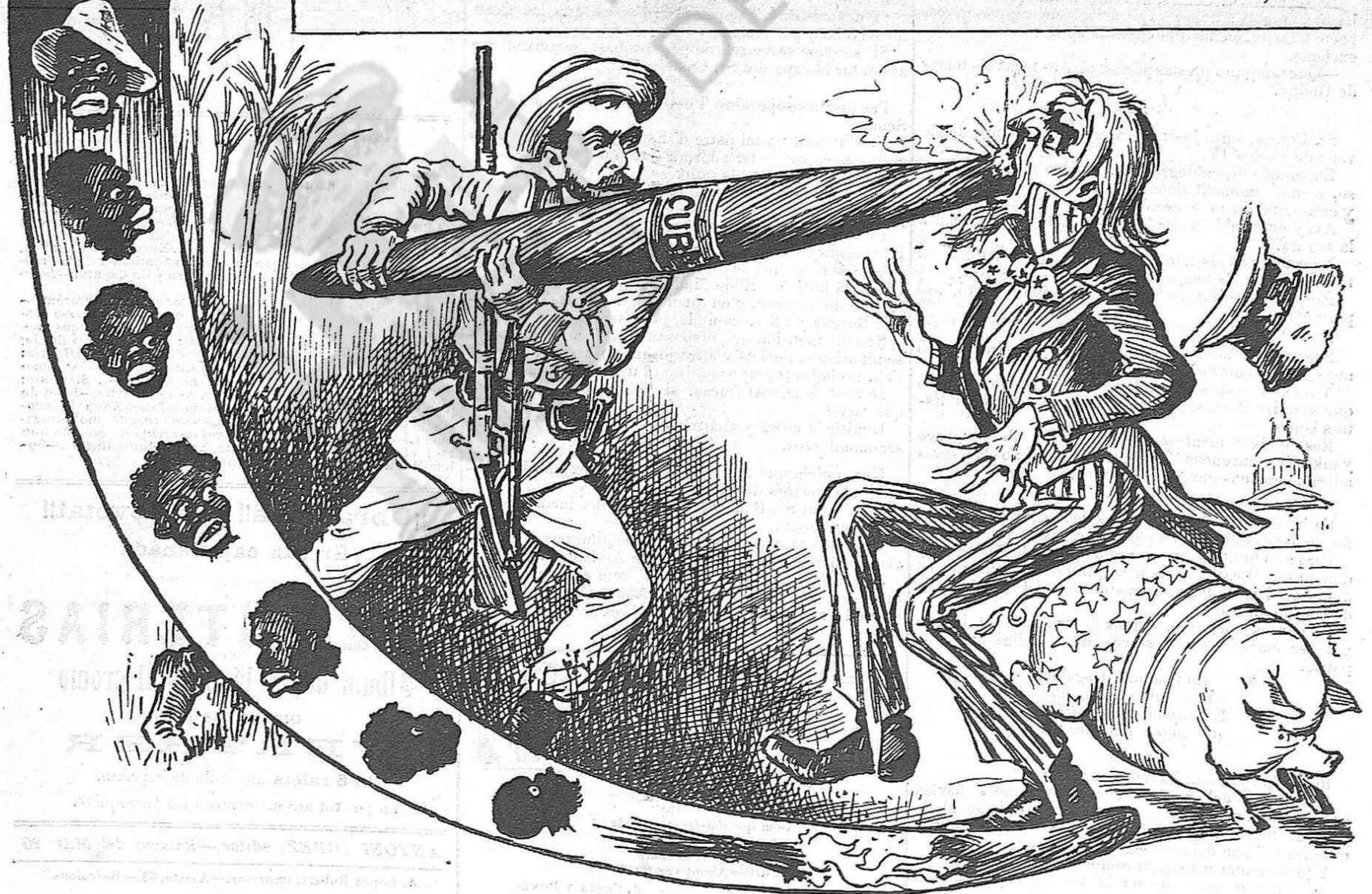
L' ESPANYOL AL ONCLE SAM:—Mestre, si te 'l vols fumar te tindrás de cremá 'l morros!

(Copia exacta de una caricatura del periódich Judge de New York.)