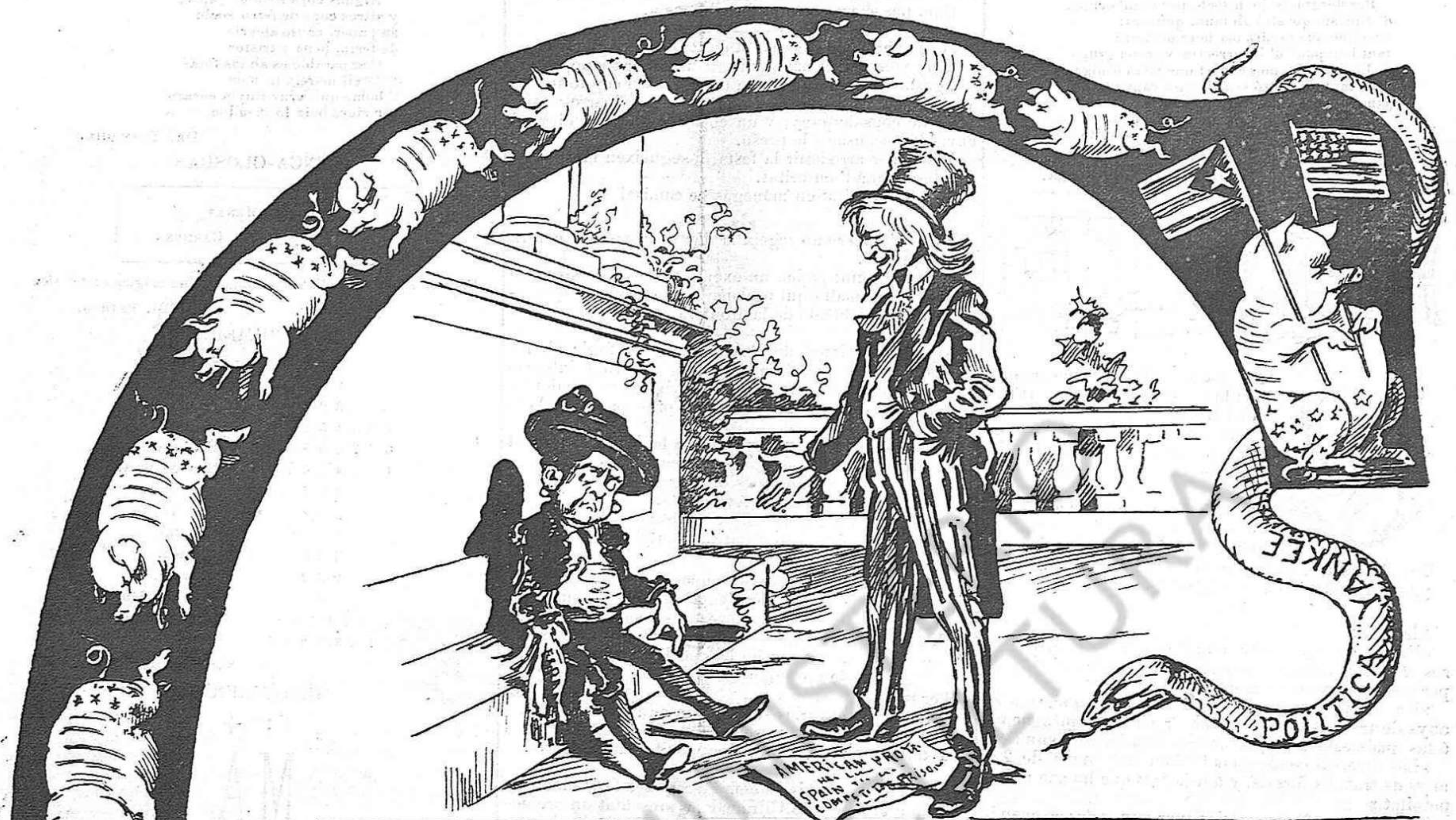
L' ONCLE SAM AL PETIT ESPANYOL:—Noy, lo millor que pots fer es donarme aquest cigarro, las criaturas no fuman.

(Copia exacta de una caricatura del periódich Judge de New York.)