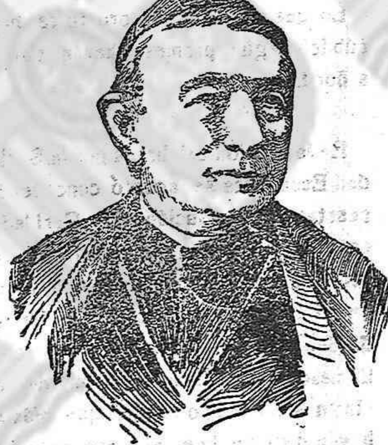
El Cardenal Aguirre

Mientras llamamos pues, la pérdida de tan sabio e ilustre purpurado, pidamos con todas las fuerzas de nuestro espíritu que el cielo nos depara un digno sucesor a fin de que se vean así cumplidos nuestros deseos.