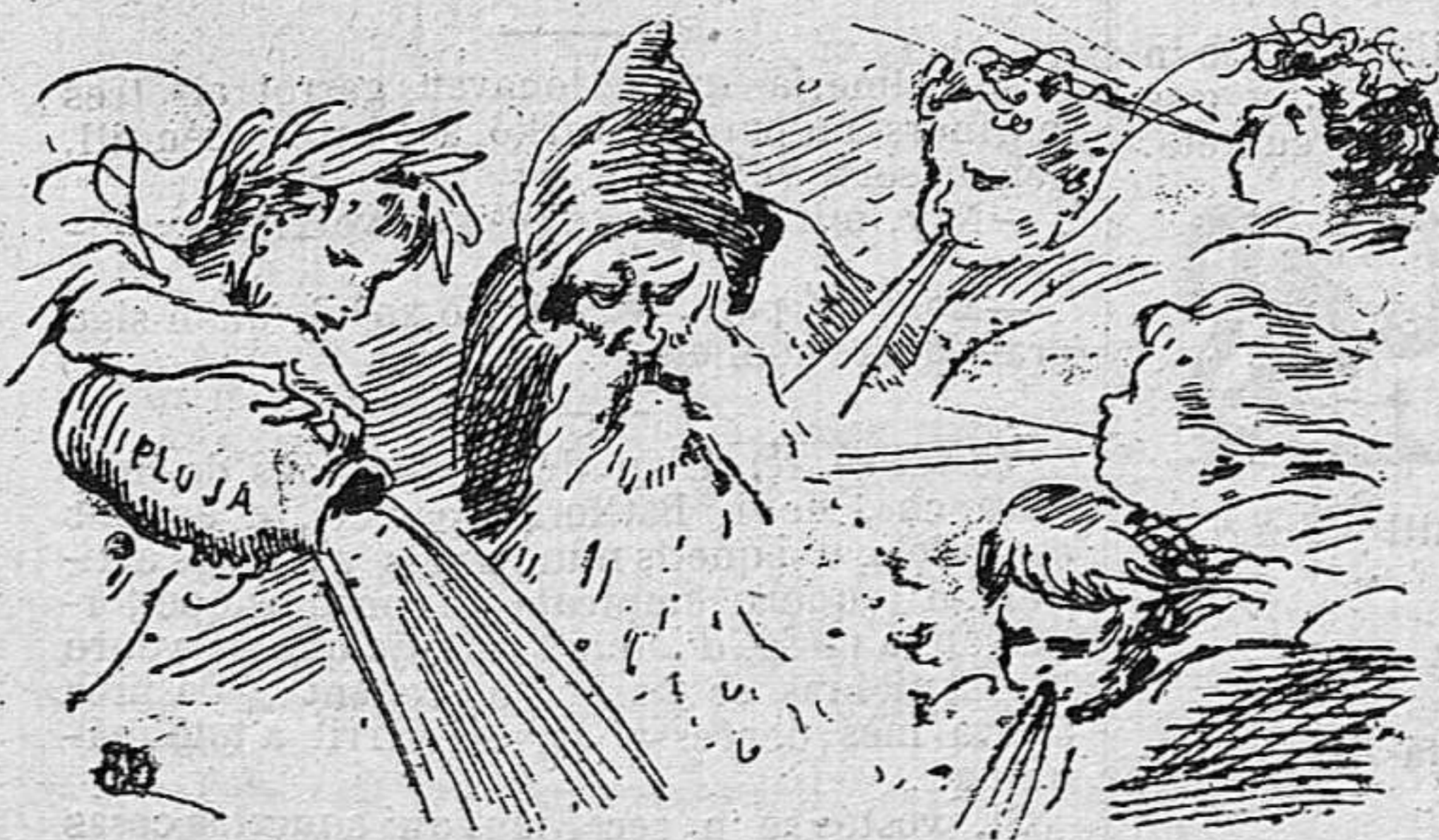
S' han reunít los hivernals.