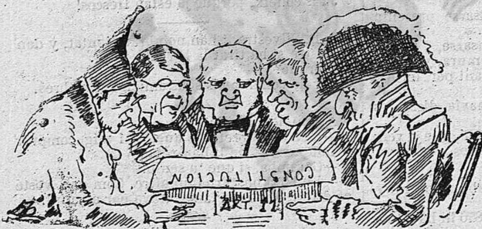
S' han reunít los histórichs.....