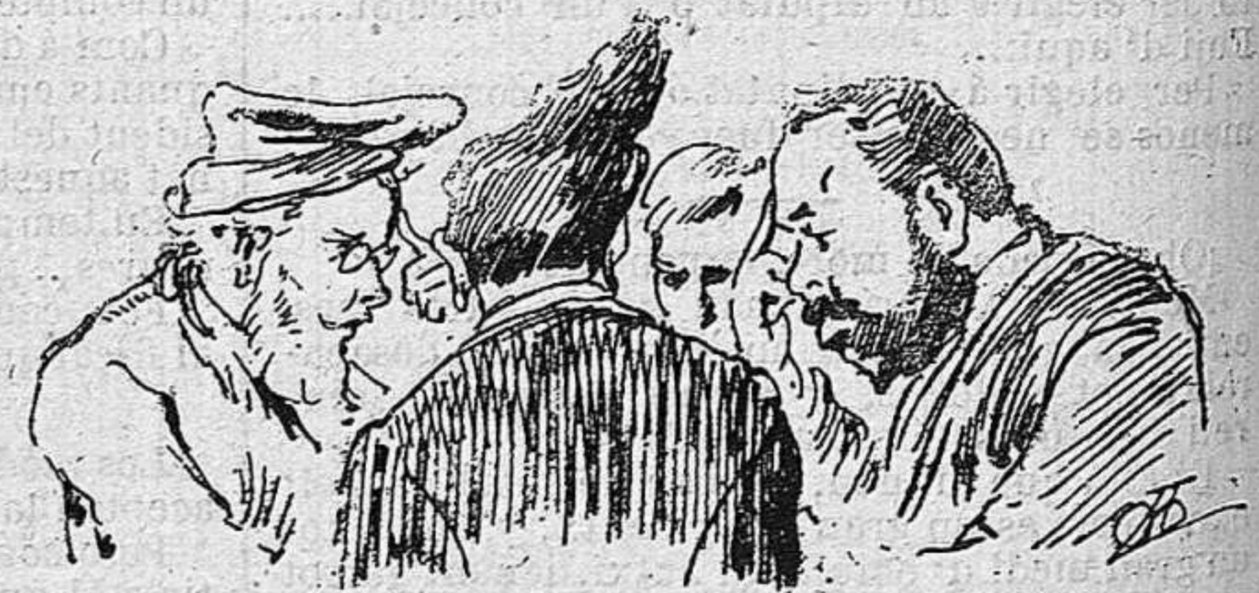
S' han reunít los constitucionals.....