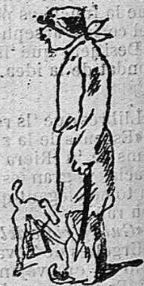
Apesar de lo qual, la vigila un municipal.