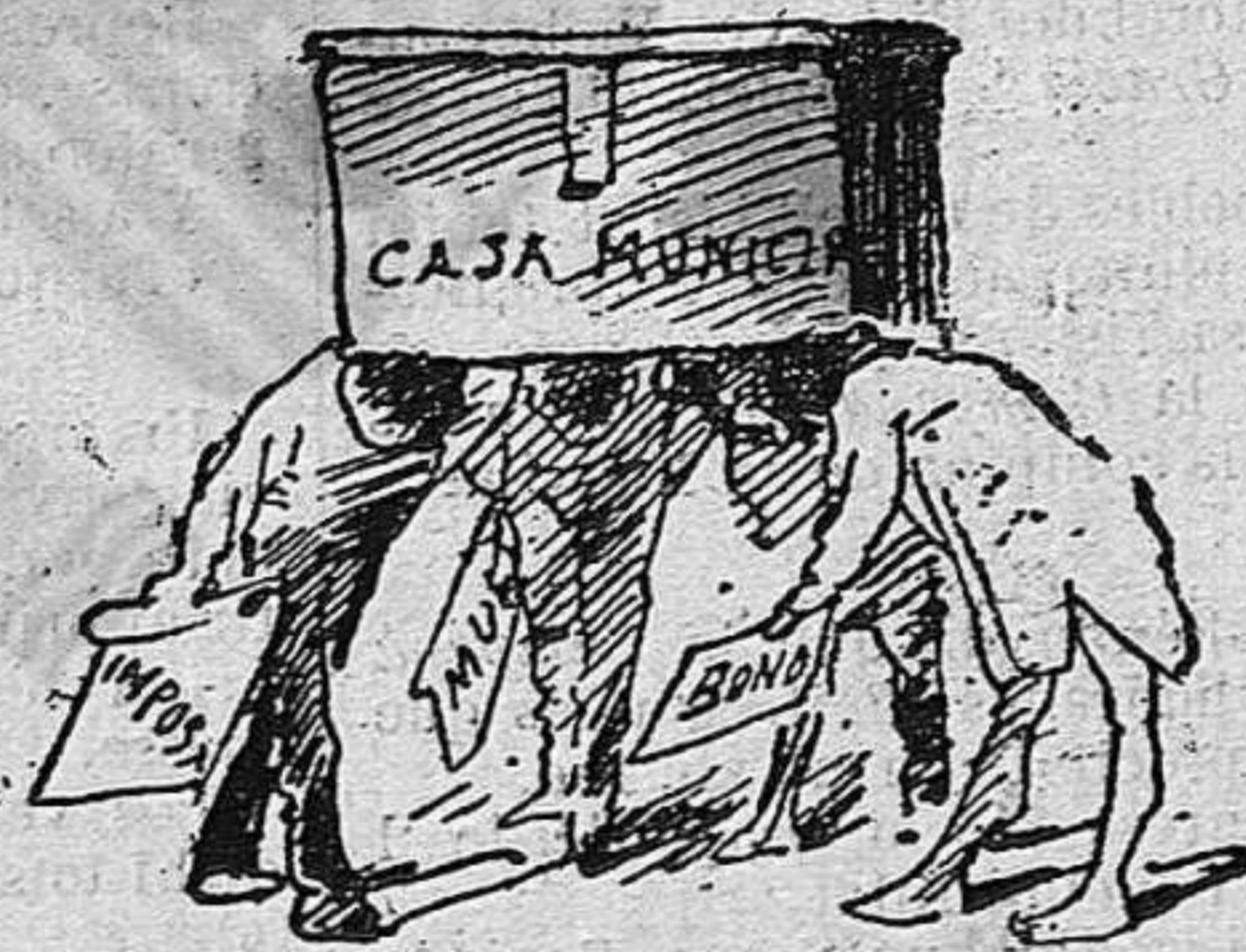
Sostinguda regularment per quatre infelissos.