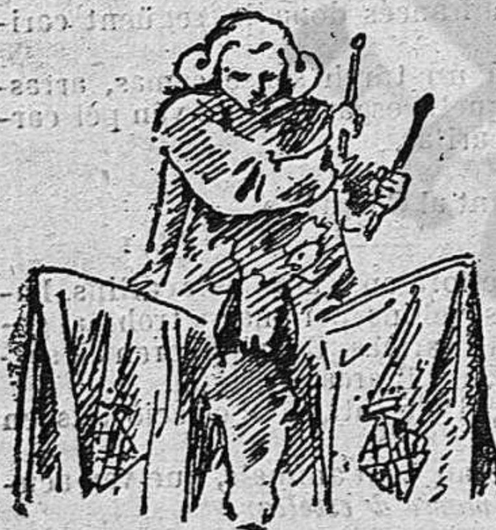
Una cosa que surt de ca la Ciutat.