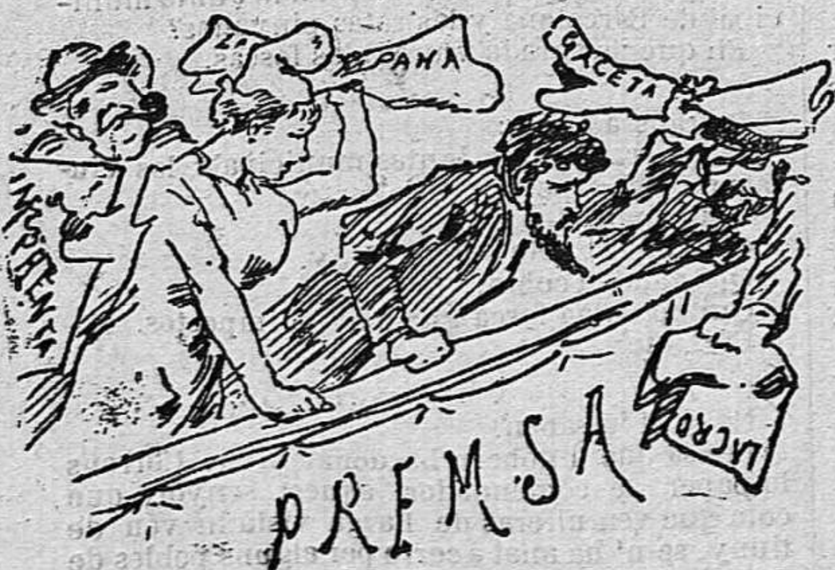
Tothom lí tira paperets.