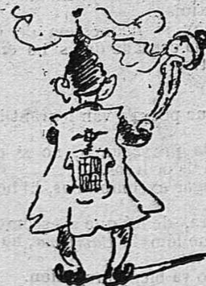
Fora una criatura que fins l' incensa.