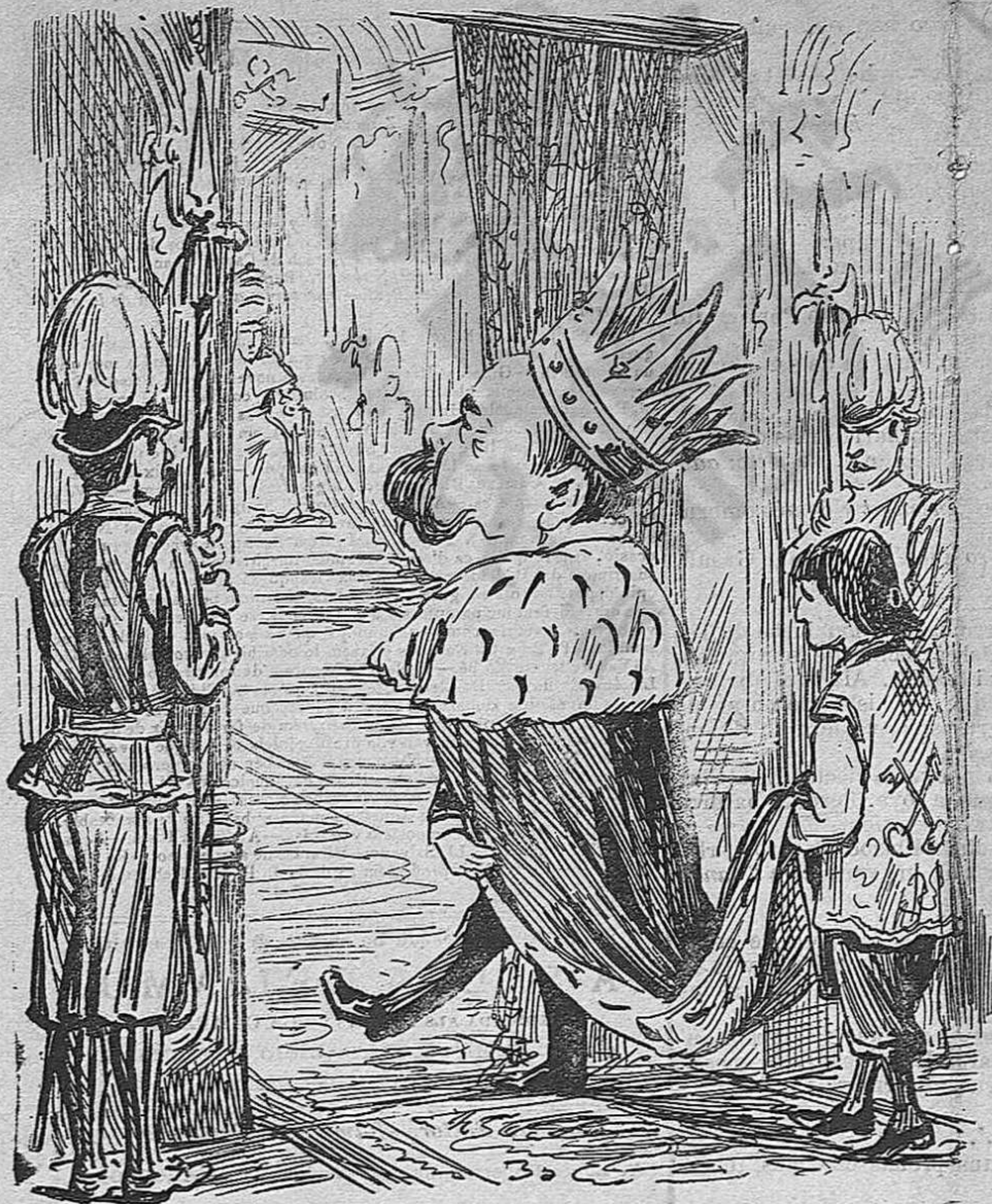
Va ser rebut com un rey.