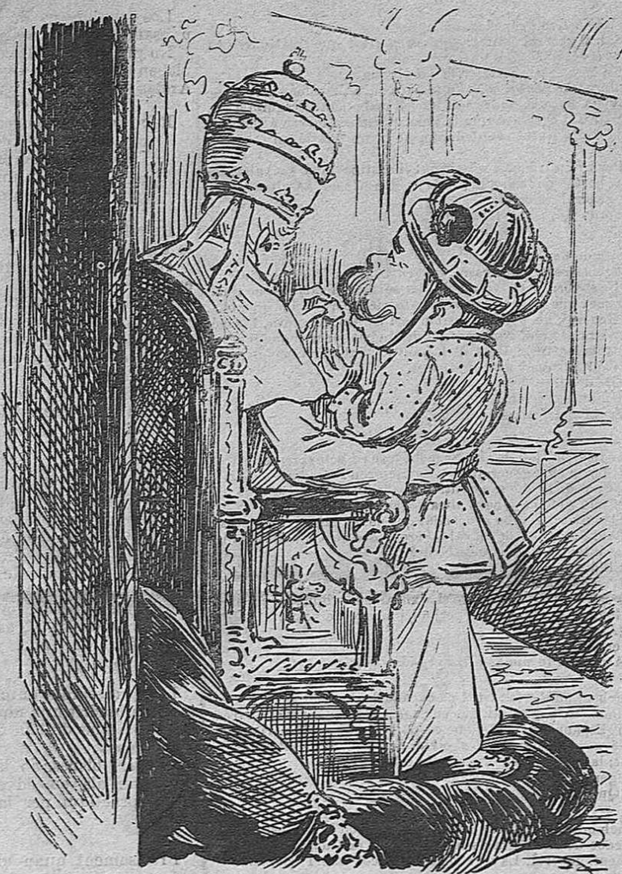
Y tractat com un fill.