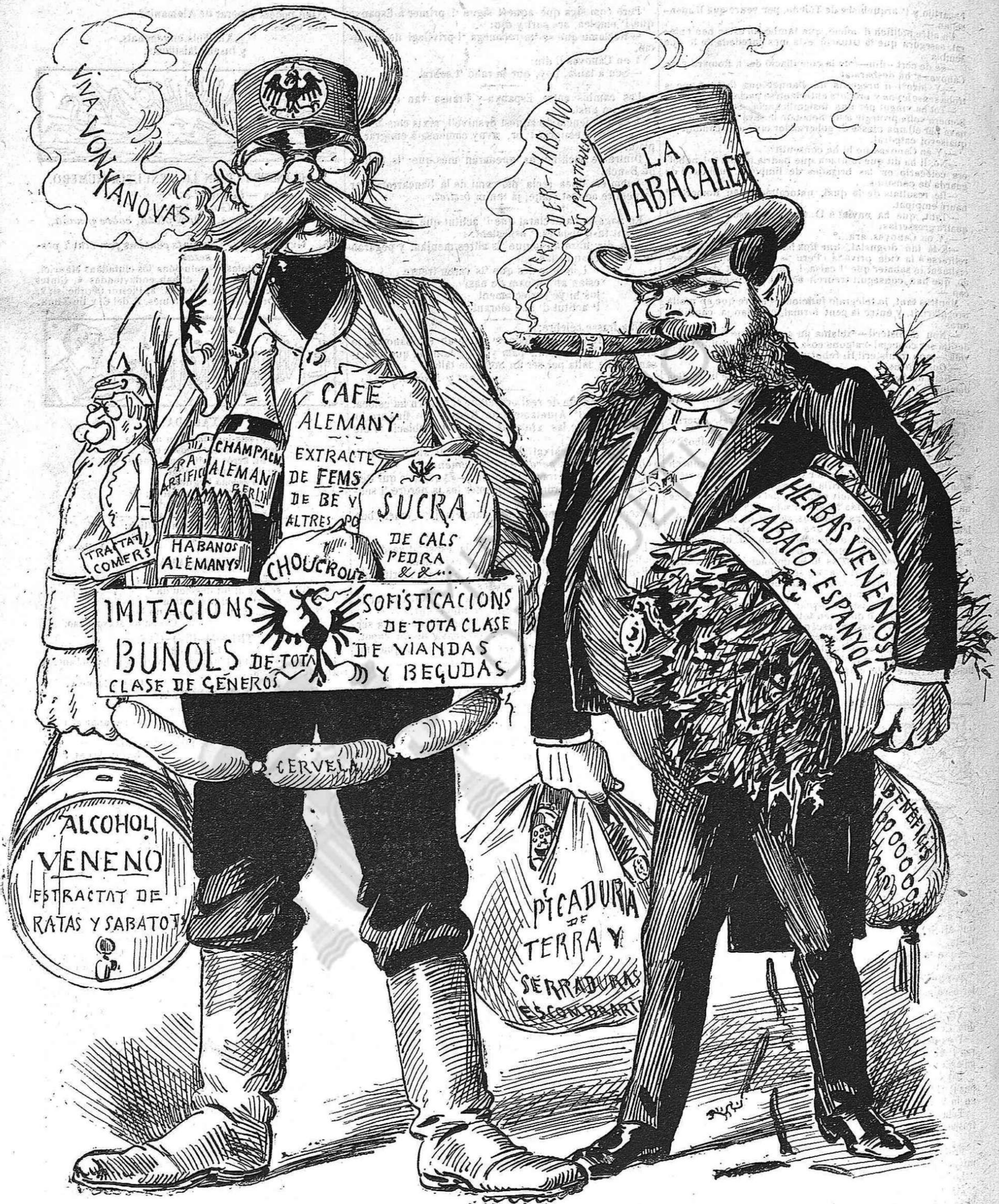
Un tip de menjar y un trago del que 'ns ve del extranger, quatre pipadas á un puro, y un pot dir que ja está llest.