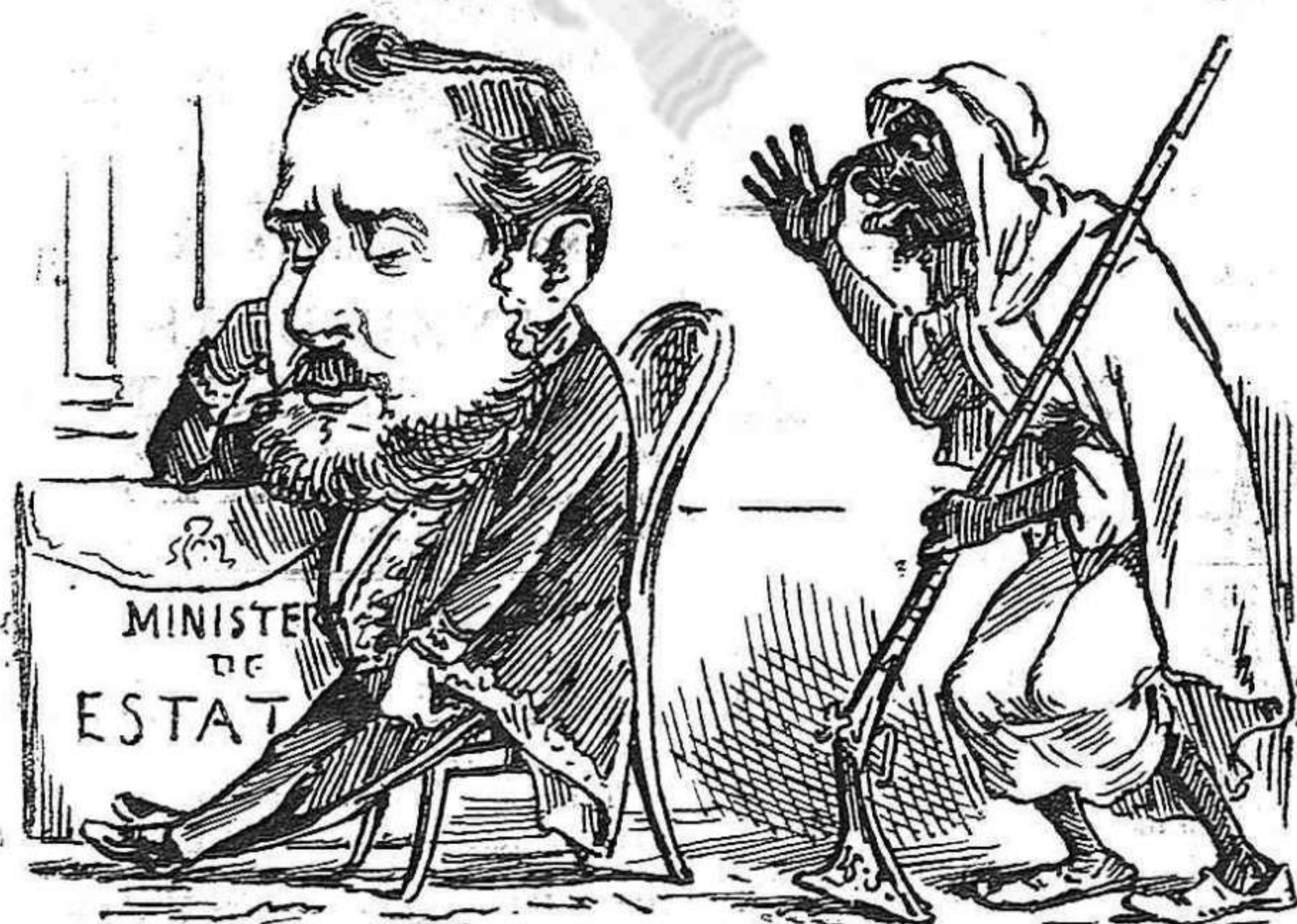
Las nostras debilitats donan aquests resultats.