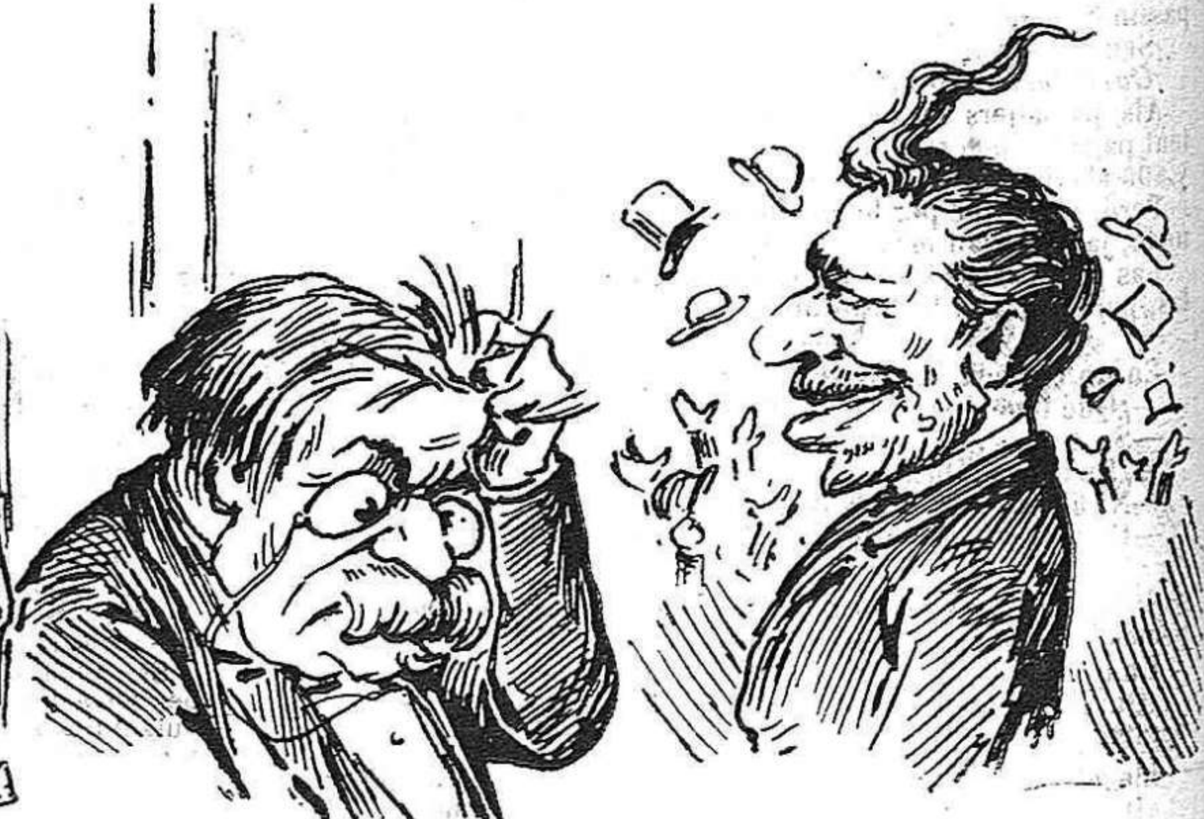
Don Antón plora, miñ boig, y en Sagasta riu de goig.