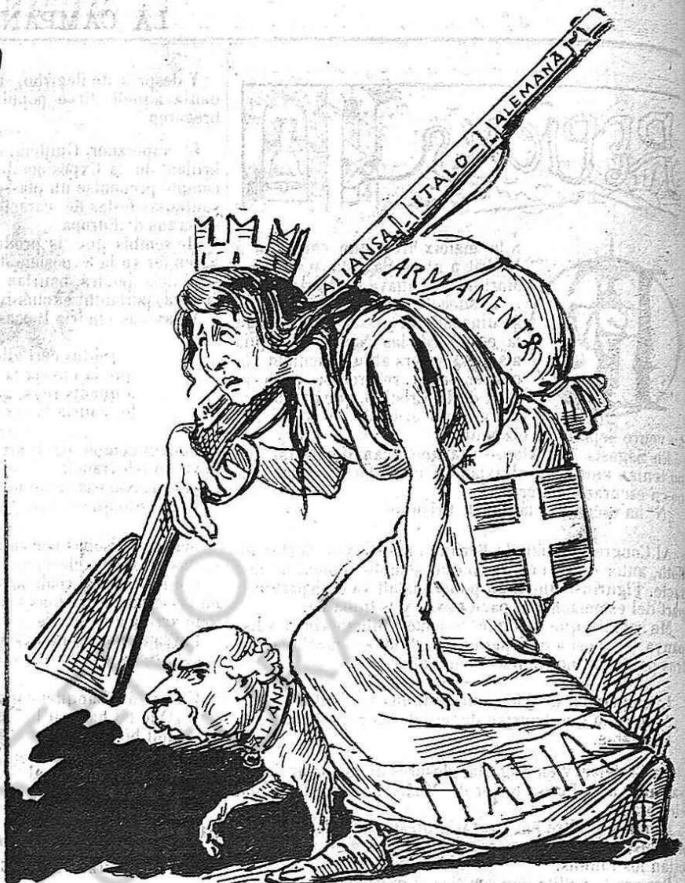
¡Pobra Itali! Mal alimentada y ab tant pes al drunt, està que no pot dir f. ha.