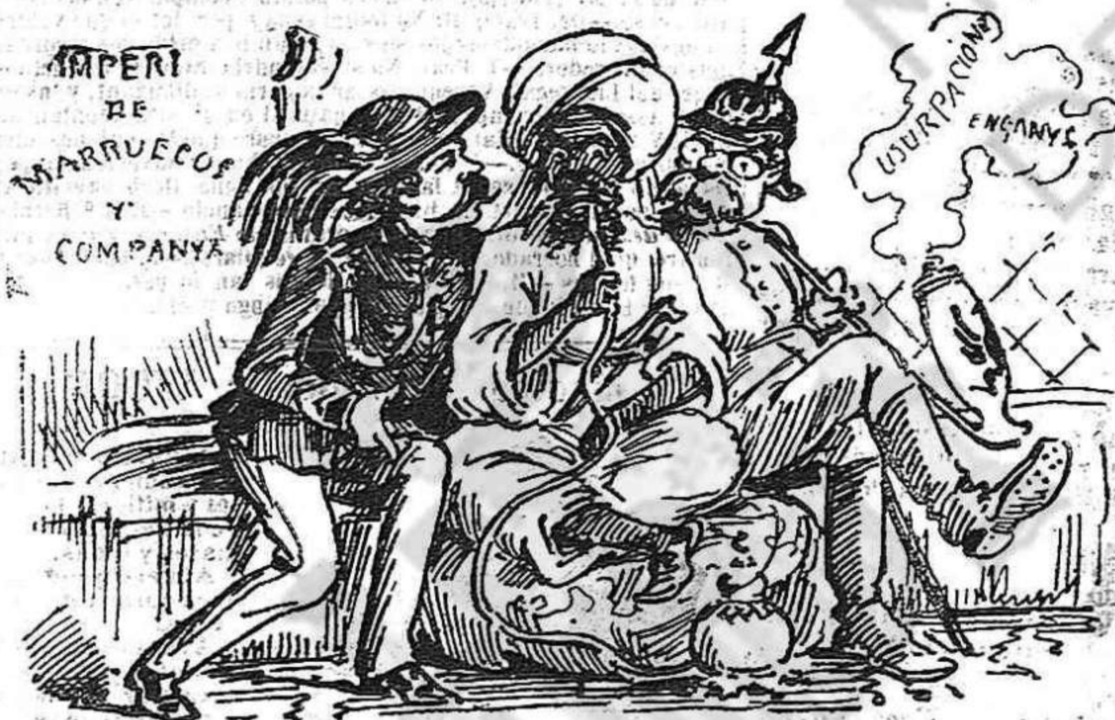
Los representants estrangers no deixan ni un moment al moro, aconsellantlo, mimantlo... y pentinantlo.