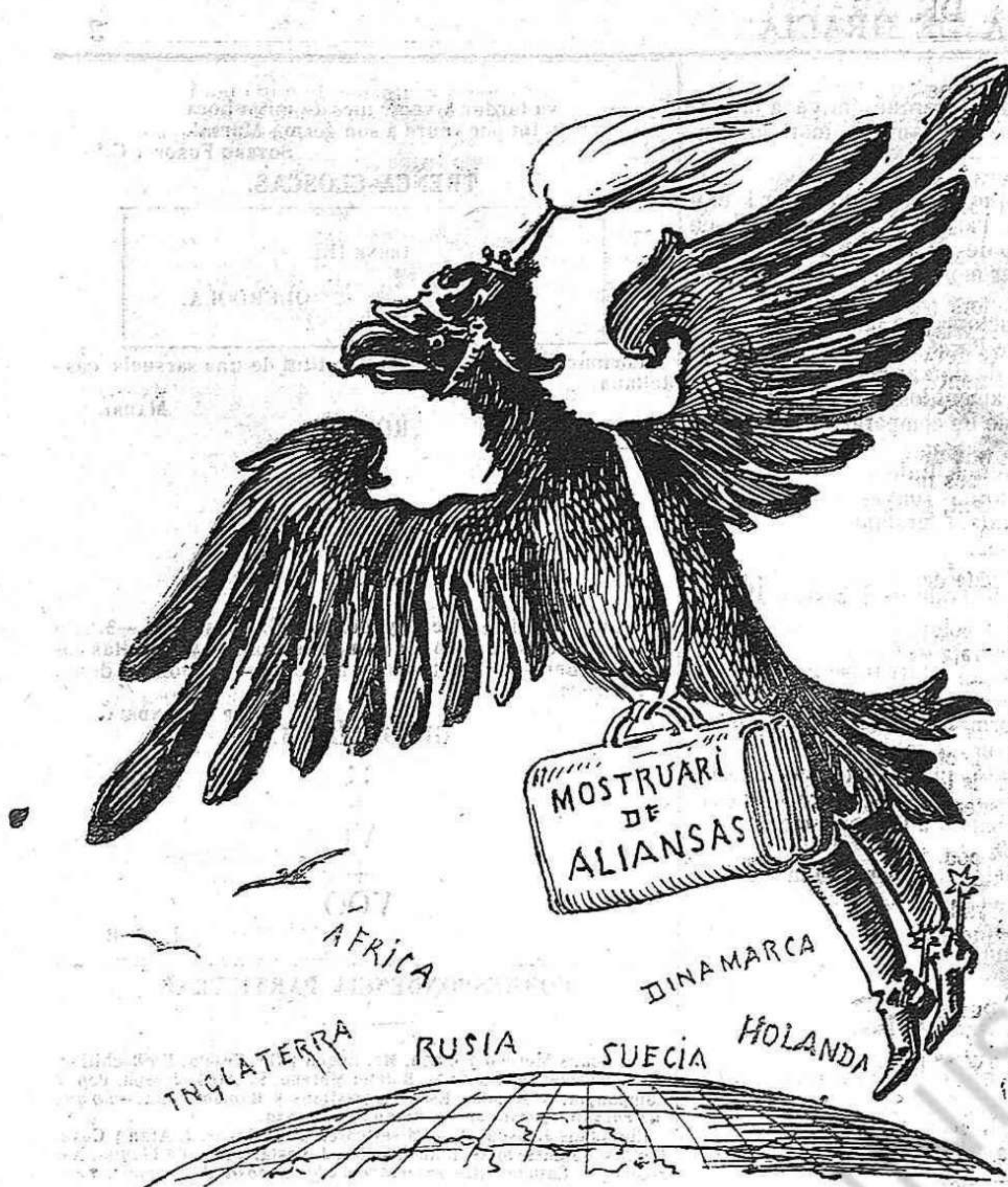
Un comissionista alemany, que viatja per col·locar los seus gèneros falsificats.